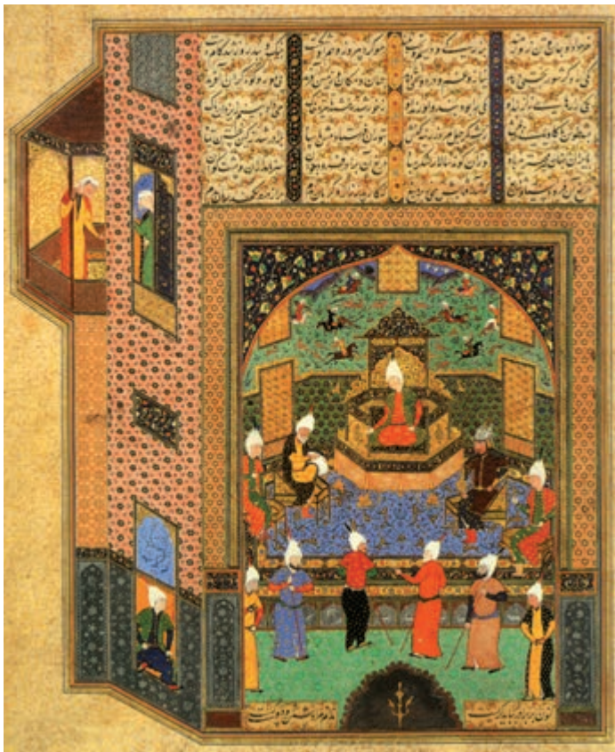
مجلس بحث فقها، اثر کمال‌الدین بهزاد مکتب هرات ۸۹۴ هجری قاهره، کتابخانه سلطنتی مهر