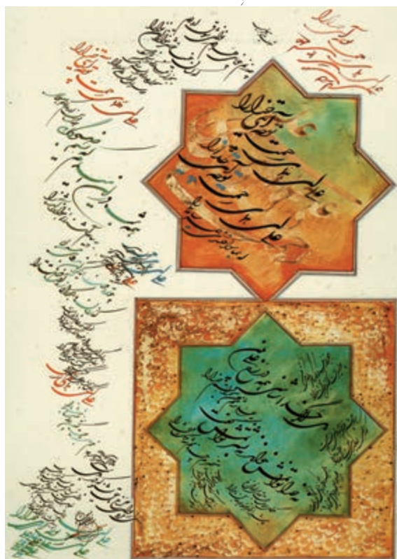
نقاشی خط اثر استاد اسرافیل شیرچی

به دو چشم خون فشانم، حله‌ای نیم رحمت که ز کوی او غباری به من آر توتیا را ۱۰. به امید آنکه شاید برسد به خاک پایت چه پیام‌ها سپردم، همه سوزِ دل، صبا را چو تویی قضای گردان، به دعای مستندان که ز جان ما بگردان ره آفتِ قضا را چه زخمِ چو نای هر دم، ز نوای شوق او دم؟ که لسانِ غیب "خوش تر بنوازد این نوا را «همه شب در این امیدم که نیم صبحگاهی به پیام آشنایی بنوازد آشنا را» ز نوای مرغِ یاقوتی " بشنو که در دل شب غمِ دل به دوست کفتن چه خوش است شریارا