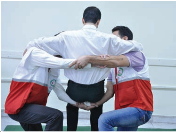
تصویر ۶-۱۰-۱ یکی از روش‌های حمل مصدوم توسط دو امدادگر

✓ در صورتی شما مجازید وارد صحنه حادثه بشوید که آن محل برای شما هیچ خطری نداشته باشد. در غیر این صورت باید تا رسیدن نیروهای امدادی صبر کنید. ✓ امنیت جایی که مصدوم حضور دارد، بسیار مهم است؛ زیرا اگر آن محل امن نباشد، باید مصدوم و یا مصدومین را بلافاصله با رعایت نکات ایمنی حمل و از صحنه حادثه خارج کنید. به طور مثال اگر میج پای مصدوم درد می‌کند، شما می‌توانید به کمک یک نفر دیگر او را مثل تصویر زیر حمل نمایید.