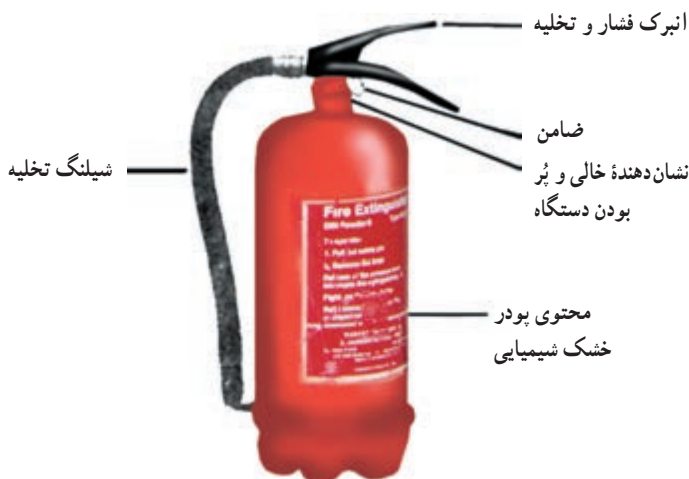
تصویر ۴-۱۰- خاموش‌کننده با پودر و گاز

نکته : شارژ و بازیابی کپسول‌های آتش‌نشانی در زمان مقرر انجام شود.