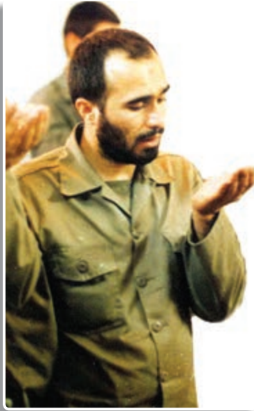
تصویر ۶-۷- شهید خرازی در حال نماز و نیایش با پروردگار

حسین خرازی در سال ۱۳۳۶ در اصفهان دیده به جهان گشود. او در طی دوران تحصیل از آموختن اصول و ارزش‌های مذهبی غافل نبود، و در دوران نوجوانی به مطالعه کتاب‌های اسلامی و انقلابی علاقه‌مند شد، و به تدریج با امور سیاسی نیز آشنایی پیدا کرد.