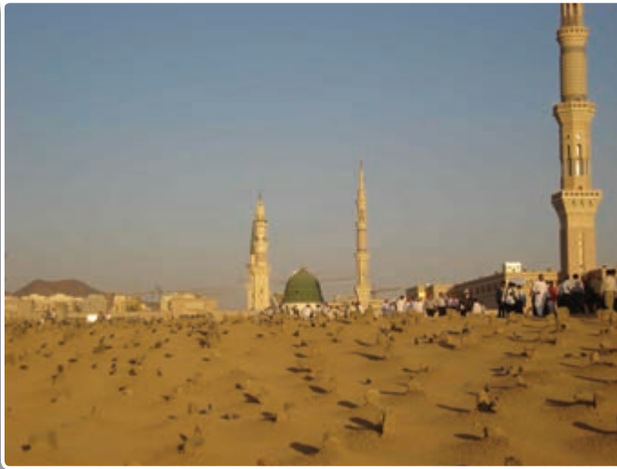
تصویر ۱-۷- قبرستان بقیع در کنار مسجدالنبی (ص) محل خاک‌سپاری چهار امام معصوم و تعدادی از بزرگان اسلام

او در دوران حیات پر برکتش نمونه کامل یک زن مسلمان در عفاف، پاکدامنی، حفظ حجاب و پوشش، رعایت حیا و نجابت و عامل به تمام ارزش‌های دین اسلام بود. سرانجام بنا بر روایتی ۷۵ روزاً و بنا بر روایت دیگری ۹۵ روزاً پس از رحلت آخرین پیامبر خدا، حضرت فاطمه (س) به شهادت رسید و دنیای اسلام از وجود با برکت زنی که از جانب پدرش سیده نساء العالمین (سرور زنان دو جهان) لقب گرفته بود، محروم شد. دختر پیامبر خدا وصیت کرد که او را شبانه غسل دهند و در تاریکی شب به خاک بسپارند. به همین دلیل محل دفن پیکر پاک ایشان برای ما مشخص نیست، اما به احتمال زیاد آن حضرت در یکی از دو مکان قبرستان بقیع یا مسجدالنبی به خاک سپرده شده‌اند.