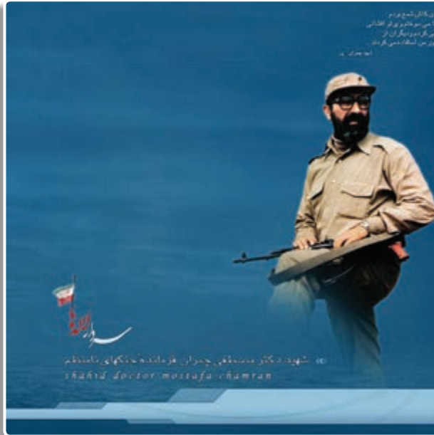
تصویر ۵ - ۷ - شهید چمران یکی از بندگان برگزیده خدا

دکتر چمران با وجود غم و اندوه از دست دادن آن شهید صبح همان روز هم‌رمز دیگرش به نام مقدم پور را انتخاب کرد و با خود به دهلاویه برد تا او را به رزمندگان معرفی کند. چمران با تک تک رزمندگان دیده بوسی کرد و با ذکر ایمان و شجاعت شهید رستمی گفت: «خدا رستمی را دوست داشت و برد، اگر ما را هم دوست داشته باشد می‌برد». شهید چمران برای آشنا کردن مقدم پور با منطقه او را به بالای خاکریز می‌برد تا وضعیت منطقه را برایش تشریح کند.