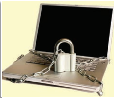
تصویر ۳-۵ - حفاظت از اطلاعات در مقابله با جنگ نرم یک اصل مهم است.

۱- جنگ نرم در پی تغییر هویت و شخصیت جامعه هدف است: در این جنگ، اعتقادات، باورها و ارزش‌های اساسی یک جامعه مورد هجوم قرار می‌گیرد. با تغییر باورهای اساسی جامعه، قالب‌های تفکر و اندیشه دگرگون می‌شود و مدل‌های رفتاری