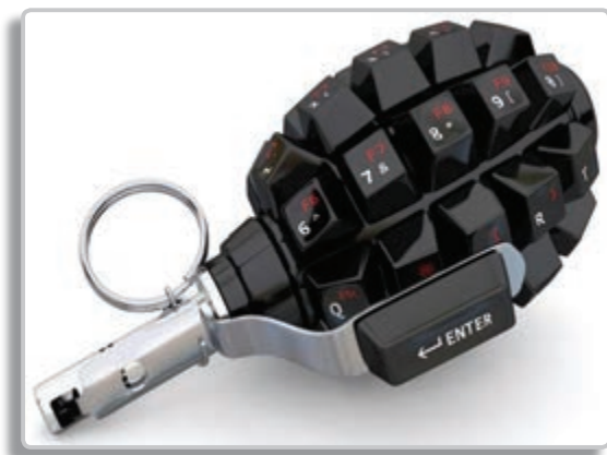
تصویر ۲-۶ فضای سایبر به بازیگران کوچک قدرت غیر واقعی می‌دهد.

۳- ایجاد اختلال در طیف الکترومغناطیسی دشمن، به طوری که توانایی آن را تضعیف کند.