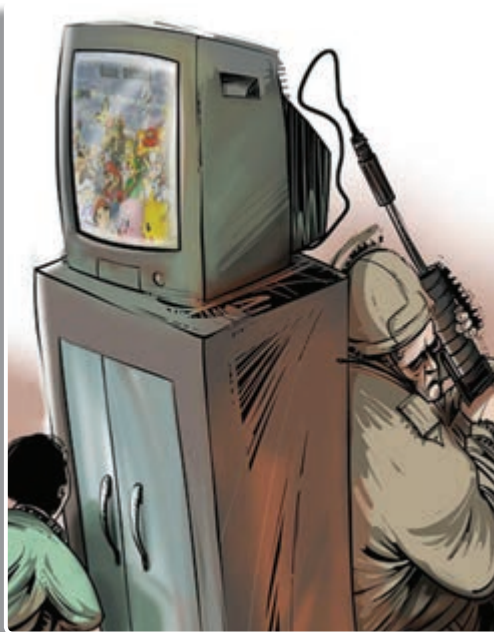
تصویر ۱-۵ - رسانه‌های جمعی یکی از ابزارهای مهم جنگ نرم

جنگ نرم عبارت است از هرگونه اقدام نرم، روانی و تبلیغات رسانه‌ای که جامعه هدف را نشانه گرفته و قصد دارد بدون استفاده از زور و اجبار اهداف خود را محقق کند. جنگ روانی، جنگ سفید، جنگ رسانه‌ای، براندازی نرم، انقلاب مخملی، انقلاب رنگی و... از اشکال مختلف جنگ نرم هستند. جنگ نرم به روحیه، به عنوان یکی از عوامل قدرت ملی