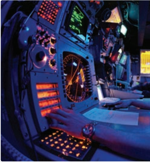
تصویر ۱-۶- یک نمونه از تجهیزات فرماندهی جنگ الکترونیک

گسترش روزافزون سیستم‌های الکترونیکی در حوزه‌های نظامی، غیرنظامی، تجاری و ... موجب شده تا بسیاری از فعالیت‌های عملیاتی این مراکز وابستگی کامل و یا بسیار زیاد به مدارهای الکترونیکی داشته باشند.