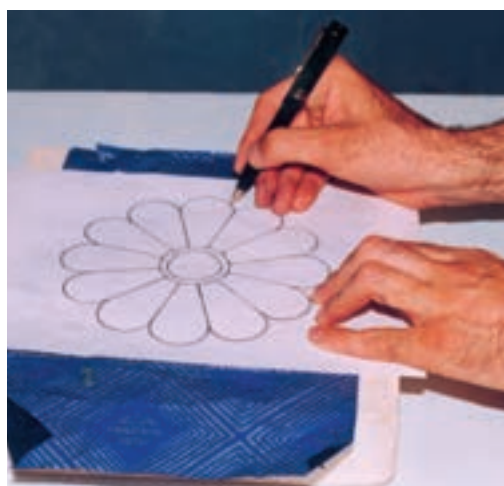
تصویر ۴- الف- انتقال طرح روی لوح گچی

بهترین روش ساخت نقش برجسته با گچ، «تراشیدن» است که طی آن با تراش و برداشتن زمینه، طرح اصلی برجسته می‌شود. برای این کار ابتدا لوح گچی به اندازه مناسب و با حداکثر ضخامت مورد نیاز ساخته، طرح را روی آن منتقل می‌کنیم. سپس زمینه را تا عمق مورد نظر می‌تراشیم تا حجم کلی