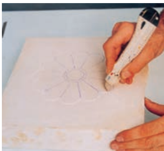
تصویر ۴- ب- برش محیط طرح

به وجود آید. آن‌گاه نقش را شکل داده به ایجاد ظرایف و ساخت و ساز آن می‌پردازیم. در پایان پرداخت نهایی و صیقلی کردن سطح نقش برجسته را با کاغذ سمباده انجام می‌دهیم (تصویر ۴- الف تا ح). در صورتی که لوح گچی کاملاً خشک باشد، برای سهولت تراش، محل مورد نظر را مرطوب می‌کنیم.