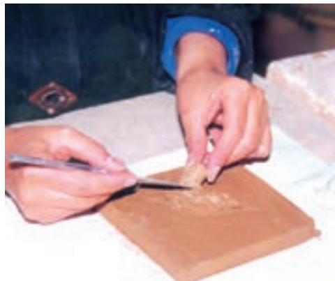
تصویر ۳- الف- افزودن خمیر گل بر سطح طرح

۲-۱- ساخت نقش برجسته گلی به روش افزودن: در این روش با افزودن گل بر روی سطح، برجستگی به وجود می‌آید. لوح گلی مناسب برای این کار بهتر است ضخامتی در حدود یک تا دو سانتی متر داشته باشد. طرح را روی لوح گلی انتقال می‌دهیم و بر روی سطح طرح شیارهایی ایجاد نموده، با کمی دوغاب ۱ از