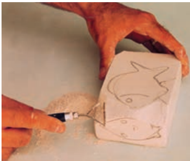
تصویر ۶-ب - تراشیدن قسمتهای اضافی

پس از مدتی گچ خود را خواهد گرفت، دیواره قالب را باز کرده، کار حجم‌سازی را شروع می‌کنیم. این کار می‌تواند با انتقال طرح روی سطح گچ یا به صورت ذهنی انجام شود. برای