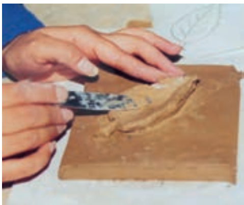
تصویر ۳- ب- شکل دادن حجم گلی

همان گل مرطوب می‌کنیم تا خمیر گل بهتر روی لوح گلی متصل شود. پس از آن لایه خمیر گل بر روی سطح طرح اضافه می‌کنیم تا نقش برجسته به وجود آید. بعد از این که شکل کلی نقش برجسته کامل شد، آن را تا حد چرمینگی خشک کرده و سپس به ایجاد ظرایف و ریزه کاریها می‌پردازیم (تصویر ۳- الف و ب).