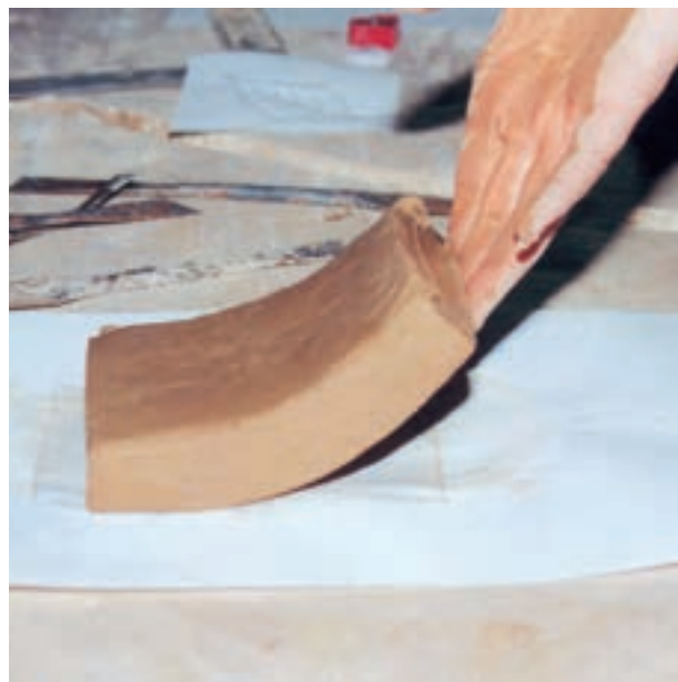
تصویر ۱- الف - مقدار رطوبت لوح زیاد است و هنگام بلند کردن خم می‌شود.

پس از آن که لوح گلی آماده کار شد یعنی رطوبت آن به اندازه‌ای رسید که به هنگام بلند کردن خم نشود، طرح مورد نظر را با ابزار نوک تیزی مانند مداد بر روی آن منتقل نموده و با ابزارهای برش‌دهنده عمق لازم را در خطوط محیطی طرح ایجاد