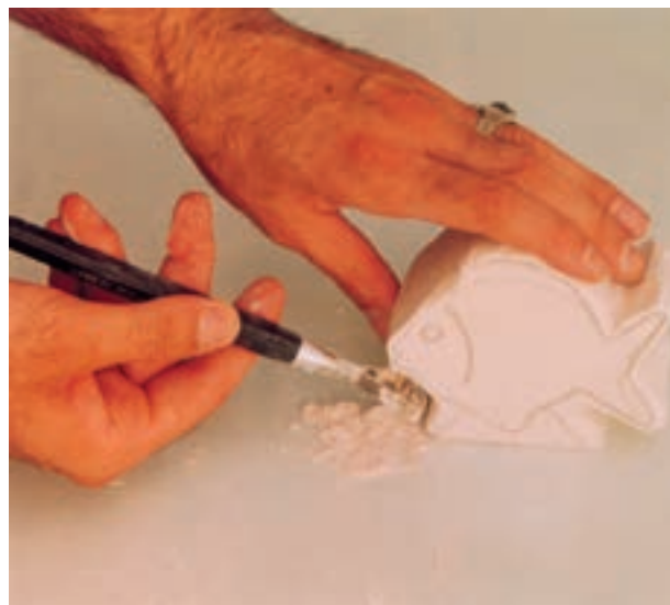
تصویر ۶-ج - تراشیدن قسمتهای اضافی