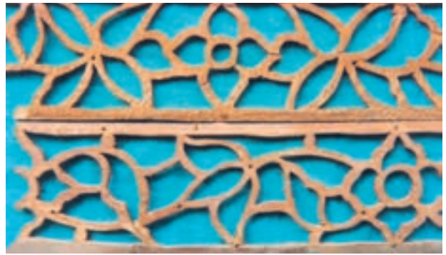
تصویر ۱-۱-۲- شبکه‌بری با نقش ختایی

از رشته‌های زیرمجموعهٔ شبکه‌بری می‌توان به پارچه‌بری اشاره نمود در این فن دو لایه چوب به‌طور مشابه شبکه‌بری می‌شوند و در بین آنها قطعاتی از شیشه رنگی نصب می‌گردد (تصویر ۱-۱-۳).