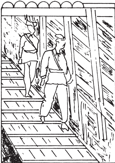
شکل ۶-۱۱- گذرگاه مخصوص کارگران

خواهند بود که در ابتدای نوبت کار، بایستی وارد کارگاه‌ها شده و به فعالیت بپردازند و در پایان نوبت کار از معدن خارج شوند. بنابراین؛ مدتی از وقت یک نوبت کار صرف رفت و آمد می‌شود و در این مدت از راهروها و چاه‌های زیرزمینی برای حمل مواد معدنی نمی‌توان استفاده کرد. برای آن‌که مدت رفت و آمد به حداقل ممکن برسد، از وسایل مکانیکی استفاده می‌کنند و در هر حال رفت و آمد کارگران باید برحسب آئین‌نامه و مقررات خاص حفاظتی صورت گیرد. همچنین، لازم است، تمام کسانی که در معادن زیرزمینی کار می‌کنند هنگام رفت و آمد در راهروها و تونل‌ها، مراقب اطراف و مسیر خود باشند تا به‌طور ناگهانی با مانعی برخورد نکنند و یا در چاله یا گودالی سقوط نکنند. هرچند امروزه، با استفاده از وسایل روشنایی عمومی و انفرادی، مسئله تاریکی در زیرزمین تا حد زیادی حل شده ولی مع‌ذالک، به علت این‌که دیواره‌ها و ماده معدنی، نور را به خود جذب کرده و از انعکاس آن جلوگیری می‌کنند، باز هم روشنایی مطلوب نیست و محدود بودن ابعاد تونل‌ها و کارگاه‌ها نیز امکان وقوع سانحه و تصادف را افزایش می‌دهند؛ به‌خصوص آن‌که تونل‌ها و کارگاه‌ها منحصر به رفت و آمد افراد نیست و ماشین‌آلات معدنی نیز در آن‌جا در حرکت هستند. برای آن‌که عبور لکوموتیو و واگن‌های دنبال آن، منجر به برخورد و تصادف با افراد نشود، در یک طرف کناره تونل‌ها و گالری‌ها، گذرگاهی را برای عبور افراد در نظر می‌گیرند و معبری درست می‌کنند که فاصله دیواره تالبه و واگن در آن حداقل از ۶۰ سانتیمتر کمتر نباشد یا آن‌که لکوموتیوها را با چراغ‌های پرنوری در جلو و عقب مجهز می‌کنند که وجود هرگونه مانعی را قابل تشخیص سازد و افراد را از تردد قطار آگاه کند.