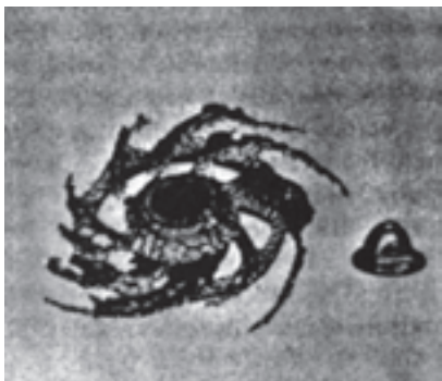
شکل ۲-۹- خوردگی سایشی پروانه‌ای از جنس فولاد زنگ‌نزن در یک نوع پمپ.

این قطعات، قطعه‌ی ثابت و سیال متحرک است که با سرعت زیاد در لوله جریان دارد و باعث خوردگی می‌شود.