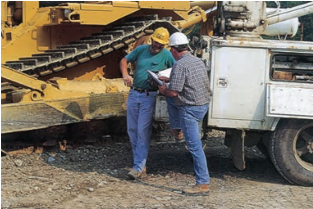
شکل ۱-۴- سوالات تعمیرکار از متصدی ماشین در مورد وضعیت عیب و عملکرد دستگاه

دستگاه گنجانده شده، آشنا و مأنوس شوید. آخرین بولتن و نشریات رسیده را مطالعه کنید زیرا احتمال دارد پاسخ مشکل شما در همان بولتن درج شده باشد. پس از آشنایی با سیستم برقی، برای رفع هرگونه عیب در دستگاه برقی، آمادگی بیش تری خواهید داشت. ۲- سوالاتی که از متصدی ماشین آلات می شود: یک مکانیک یا تعمیرکار فنی با تجربه می تواند اطلاعات زیادی از