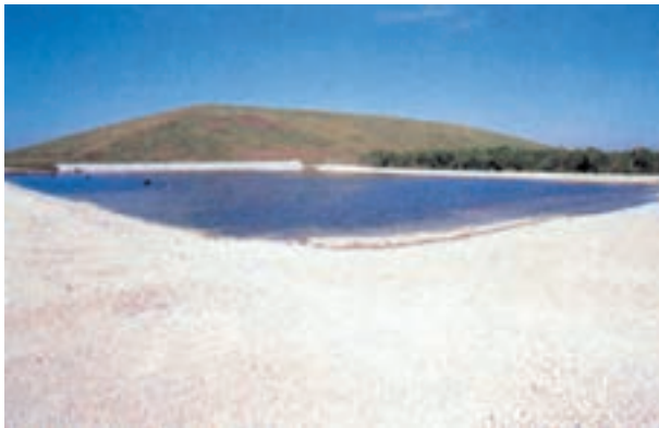
شکل ۱-۵- کوهی از مواد زاید جامد

متأسفانه در گذشته، به حفاظت محیط زیست کارخانه‌های تعمیراتی توجهی نمی‌شد، اما امروزه در برخی نقاط دنیا، مقررات سختی شامل آن‌ها شده است. قبلاً این کارخانه‌ها از تولیدکننده‌های عمده‌ی مواد زاید بودند و سهم زیادی در دفن ضایعات داشتند. در شکل ۱-۵ تصویر یک کوه مصنوعی که از انباشته شدن مواد زاید جامد به وجود آمده است نشان داده شده است. در برخی نقاط که سطح آب‌های زیرزمینی بالاست مواد زاید جامد به ناچار روی سطح زمین انباشته می‌شوند.