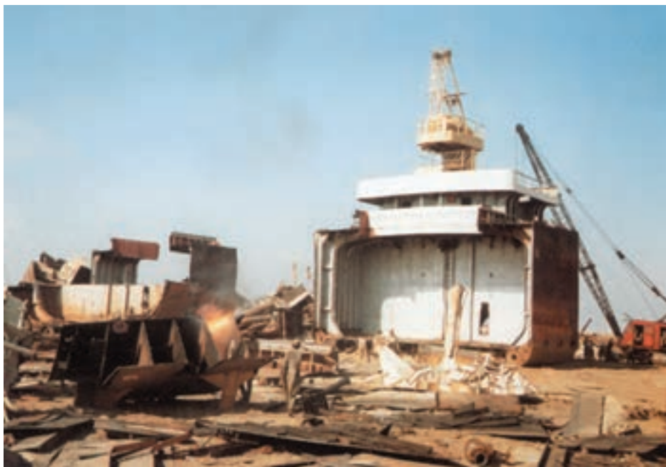
شکل ۴-۵- کارگاه اوراق کشتی

۳-۵- کارگاه‌های اوراق کشتی و آلودگی محیط زیست: برای اسقاط و اوراق کردن کشتی‌های قدیمی یا صدمه دیده‌ای که تعمیر و بازسازی آن‌ها به صرفه نیست معمولاً کشتی را در ساحل به گل می‌زنند. سواحل طولانی در کشورهای چین، هندوستان و بنگلادش بیش‌ترین تعداد کارگاه‌های اوراق کشتی را به خود اختصاص داده است.