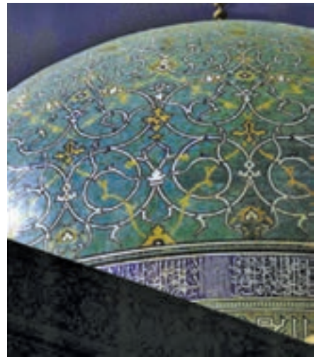
▲ شکل ۱۸-۱۲-الف - کاشی کاری هفت رنگ مسجد امام، اصفهان

هنر فلزکاری نیز دوران تحول و رشد خود را گذراند به طوری که در اواخر سده دهم ترصیع کاری با فلزات گرانبها و کتیبه‌هایی به خط نستعلیق، نوعی زیبایی چشمگیر را در این هنر پدید آورد. دوباره هنر فلزکاری احیا شد و تزیینات گل و گیاهی و اسلیمی و ختایی اهمیت ویژه‌ای در این هنر یافت (شکل ۱۹-۱۲).