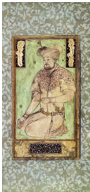
▲ شکل ۷-۱۱- تک چهره‌نگاری، بهزاد