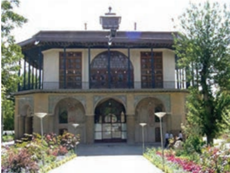
▲ شکل ۸-۱۲- عمارت چهلستون، قزوین