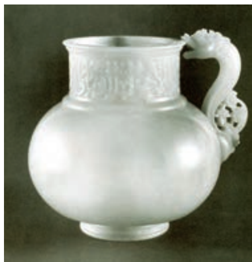
▲ شکل ۱۰-۱۱- ظرف سنگی