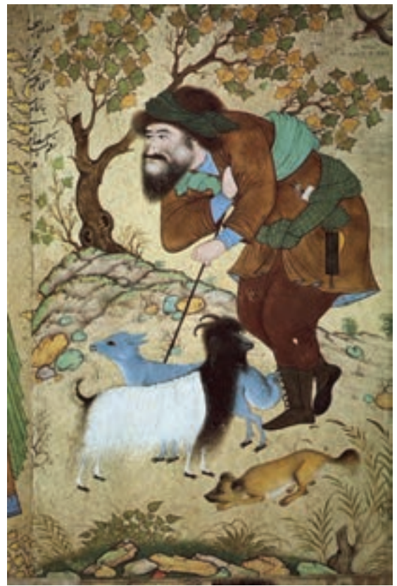
▲ شکل ۹-۱۲- نقاشی اثر رضا عباسی