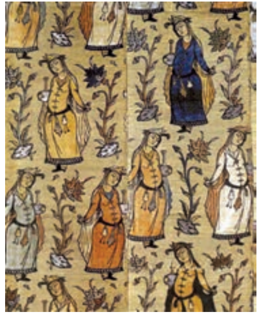
▲ شکل ۱۵-۱۲- پارچه بانقش نگارگری، دوره صفویه