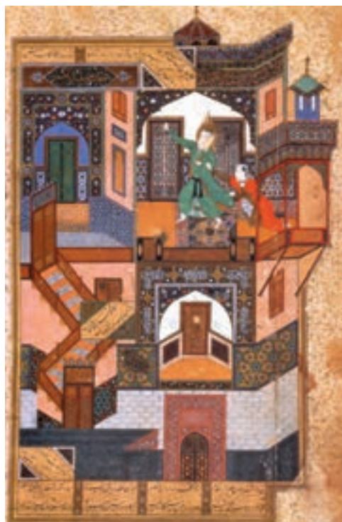
▲ شکل ۶-۱۱- برگی از کتاب بوستان سعدی، اثر بهزاد