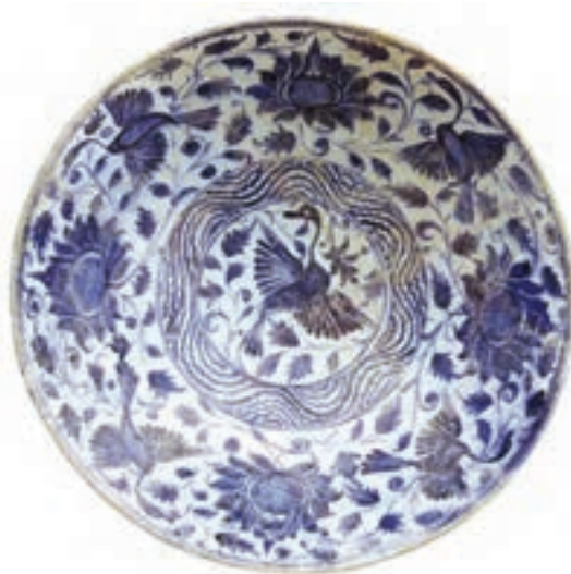
▲ شکل ۱۱-۱۲- ظرف آبی و سفید، سده ۹ هجری، شرق ایران