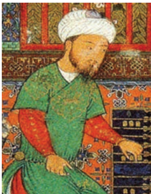
▲ شکل ۱۱-۱۳- طرح پارچه و لباس دوره تیموری (برگرفته از نگارگری)