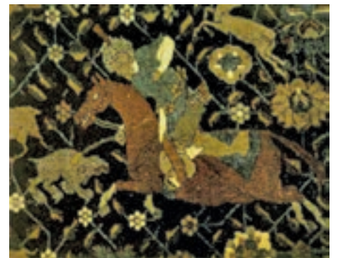
▲ شکل ۱۴-۱۲- نقش پارچه، دوره صفویه

زیرا ظروف چینی تولید شده در ایران دارای جداره‌ای نازک، ظریف و نیمه شفاف بود که تا پایان سده سیزدهم هجری نیز رواج داشت. در این دوره تمامی روش‌های شکل‌دهی و تزئین مانند روش‌های زیررنگی، رورنگی (ظروف مینایی)، زرین فام و روش تزئین هفت رنگ رایج بود (شکل ۱۷-۱۲).