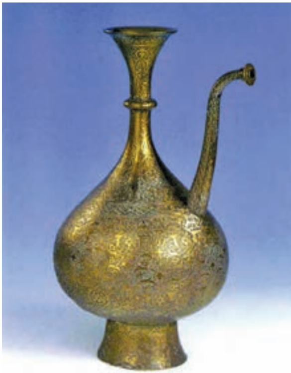
▲ شکل ۱۹-۱۲ - ظرف فلزی

هنر فلزکاری نیز دوران تحول و رشد خود را گذراند به طوری که در اواخر سده دهم ترصیع کاری با فلزات گرانبها و کتیبه‌هایی به خط نستعلیق، نوعی زیبایی چشمگیر را در این هنر پدید آورد. دوباره هنر فلزکاری احیا شد و تزیینات گل و گیاهی و اسلیمی و ختایی اهمیت ویژه‌ای در این هنر یافت (شکل ۱۹-۱۲).