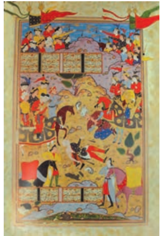
▲ شکل ۷-۱۲- برگی از شاهنامه قوام

در میانه سده یازدهم هجری با انتخاب اصفهان به عنوان پایتخت صفوی تحولی نیز در عرصه نگارگری ایجاد شد. شیوه مستقل رضاعباسی ۱ (مکتب اصفهان) با گرایش واقع‌نگاری و تأکید بر قلم‌گیری شکل‌گرفت. رویکرد تجارت جهانی و حضور هنرمندان هلندی و اروپایی، تأثیر به‌سزایی بر هنرهای بصری این دوره داشت. هرچند که هنر ایرانی در دوره صفویه توانست سهم بسزایی را در هنر گورکانی (مغولان هند)، کشمیر (هند) و عثمانی (ترکیه) بگذارد اما خود نیز تحت تأثیر هنر اروپایی قرار گرفت و نوعی هنر به‌عنوان فرنگی‌سازی در ایران رایج شد (شکل ۹-۱۲).