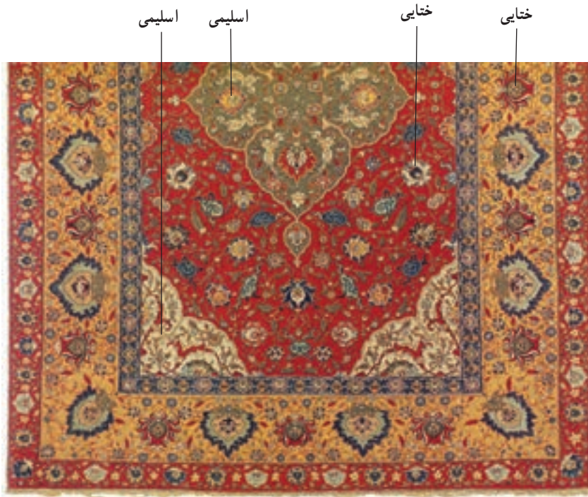
▲ شکل ۱۳-۱۲- بخشی از قالی با نقش‌های اسلیمی و ختایی