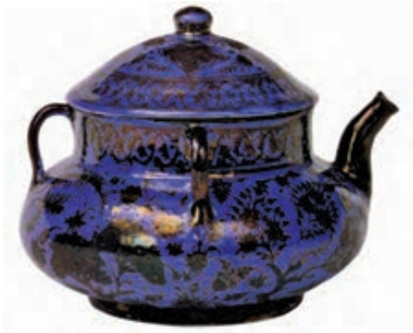
▲ شکل ۱۶-۱۲- ظرف کوباجه ای (بدل چینی)