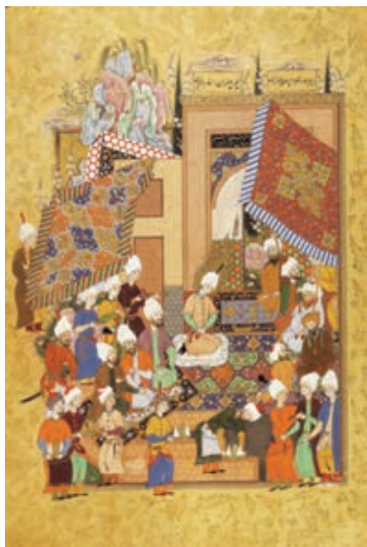
▲ شکل ۶-۱۲- برگه از کتاب هفت اورنگ جامی

نگارگری از نوعی ترکیب‌بندی حلزونی پیروی می‌کرد که شاخص آن را می‌توان در نسخه شاهنامه نفیس این دوران دید (شکل ۵-۱۲). پس از تبریز، برای مدت زمان کوتاهی، مکتبی هنری در مشهد (در نیمه دوم سده دهم هجری) ظهور کرد که در آن ویژگی‌های مکتب تبریز با عناصر محلی ادغام و روش جدیدی پدید آمد. در این مکتب بیشترین توجه به موضوعات عادی و ترسیم درخت کهنسال با تنه و شاخه گره‌دار و استفاده از رنگ سفید خودنمایی می‌کند. حاصل این تجربه هنری را می‌توان در کتاب هفت اورنگ جامی دید (شکل ۶-۱۲).