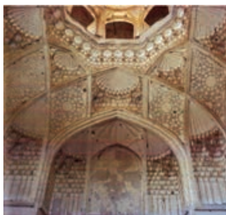
▲ شکل ۱۱-۳ الف - نمای داخلی مدرسه غیانیه