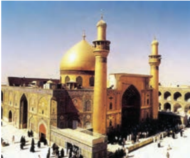
▲ شکل ۳-۱۲- بارگاه ملکوتی امام علی (ع) در نجف اشرف

ساخته شد (شکل ۲-۱۲). در این زمان به پاس بزرگداشت مذهب شیعه و بزرگان دین، تلاش بسیاری برای ساخت آرامگاه‌هایی در شأن بزرگان و ائمه به‌ویژه در کربلا، سامرا و نجف اشرف صورت گرفت. در این مکان‌ها گنبدهایی بی‌بازی شکل همراه با گلدسته‌های استوانه‌ای بلند بنا شد (شکل ۳-۱۲).