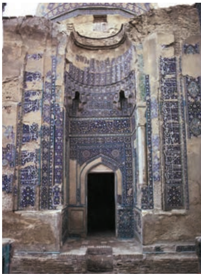
▲ شکل ۱۱-۱۱- کاشی‌کاری، مسجد کبود، تبریز

پارچه‌های ظریف و با کیفیت بسیار بالا را تنها می‌توان در دیگر آثار هنری از جمله نگارگری یافت. با این حال براساس این نمونه‌های غیر مستقیم از فن پارچه‌بافی دلیلی بر وجود کیفیت بالای پارچه در این دوره است. هر چند که ممکن است نقاش و نگارگر براساس سلیقه خود یا هماهنگی در تصویر در رنگ‌آمیزی آنها دخل و تصرف انجام داده باشد (شکل ۱۱-۱۳).