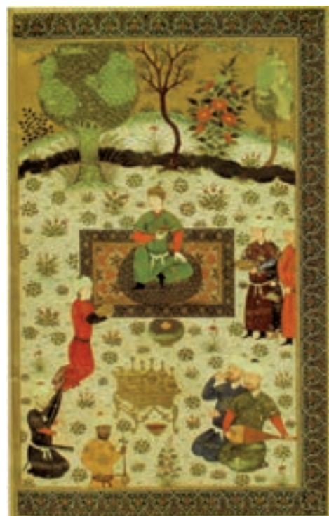
▲ شکل ۵-۱۱- برگی از شاهنامه بایسنقری