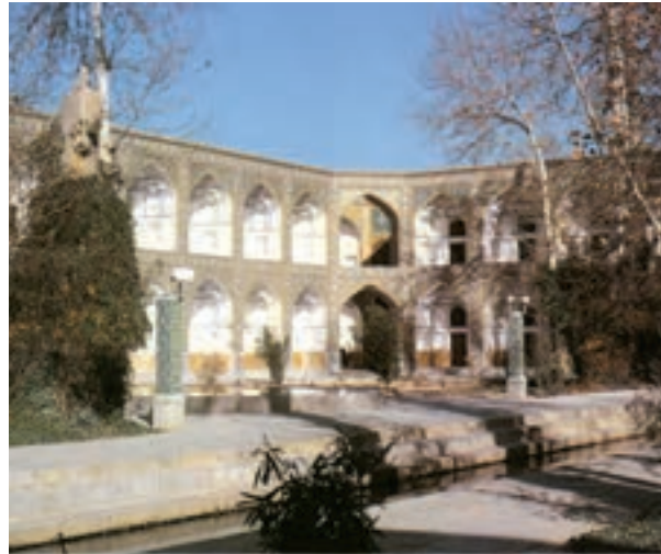
▲ شکل ۲-۱۲- مدرسه چهار باغ، اصفهان

بناهای دینی در این دوران با کاشی‌های زیبا و نقش گل و بوته به شکلی چشم‌نوازترین می‌شد که دلالت بر خوش ذوقی و عشق به هنر است. سبک معماری این دوره که بیشتر در اصفهان خودنمایی می‌کرد به شیوه‌های متفاوت در تجربیات هنری گوناگون از جمله کاخ‌سازی، راهسازی، شهرسازی و مکان‌های عمومی، توجه داشت. آثار منحصر به فردی از بناهای غیردینی نظیر کاخ چهل ستون، هشت بهشت (شکل ۴-۱۲)، بازارها و کاروانسراها در شهرهای بزرگ و راه‌های اصلی بازرگانی و تجارت، ایجاد شد.