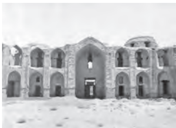
▲ شکل ۱۱-۳ ب - مدرسه غیانیه، خرگرد، خراسان