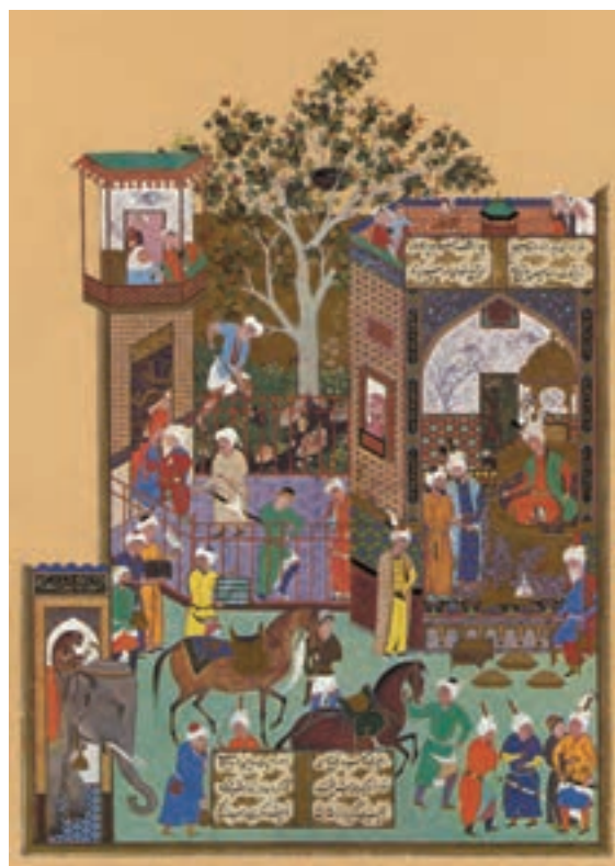
▲ شکل ۵-۱۲- برگه از شاهنامه شاه طهماسبی

در اواخر سده دهم (۹۴۷ هـ.) با حضور مکتب هنری قزوین، هنرمندان درباری، بیشتر به دیوارنگاری گماشته شدند. از این رو برخی از هنرمندان به دلیل رویکرد تجاری و سفارش‌دهندگان معمولی رو به تولید مرقعات آوردند. به همین دلیل سنت کتاب‌آرایی به میزان اندکی رو به ضعف گذاشت. در مکتب قزوین با تغییر و تحول سبک مشهد روبه‌رو هستیم. در این دوره هنری، کاهش تنوع رنگ و پیکره‌ها در نگارگری پدید می‌آید. با این وجود همچنان سنت شاهنامه‌نگاری (شکل ۷-۱۲) وجود دارد. دیوارنگاری در دیگر اماکن نیز تحولی در دوره‌های بعد پدید می‌آورد (شکل ۸-۱۲). تا این دوره معمولاً خوشنویسان آثار خود را رقم (امضا) می‌زدند اما به دلیل ارزش یافتن مقام نقاش تحولی در برابری میان صاحبان قلم (نویسندگان و خوشنویسان) و قلم‌مو (نقاشان) ایجاد شده و نگارگران نیز آثار خود را رقم می‌زدند. این سنت از جُنید در دوره جلایری به بعد مرسوم شده بود.