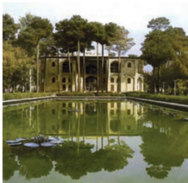
▲ شکل ۴-۱۲- کاخ هشت بهشت، اصفهان

دوره صفویه ابتدا با حضور کمال‌الدین بهزاد (از استادان برجسته مکتب هرات) که به سرپرستی کتابخانه سلطنتی در تبریز منسوب شده بود توانست موقعیت هنری خود را تثبیت کند. پس از بهزاد، شاگردان وی این مسئله مهم را پی‌گرفتند. این دوره هنری، تلفیق سنت‌های مکتب هرات و ویژگی محلی تبریز بود که توسط سلطان محمد انجام گرفت. رنگ طلایی در آن بیش از حد استفاده می‌شد و بیشتر موضوعات نقاشی را موضوعات درباری و گاهی موضوعات عادی دربر می‌گرفت.