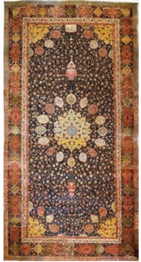
▲ شکل ۱۲-۱۲- فرش اردبیل

بافت پارچه، کاری بسیار دشوار بود ولی هنرمندان یزدی و کاشانی در این زمینه ابداعات و نوآوری‌های زیبایی پدید آوردند (شکل ۱۵-۱۲).