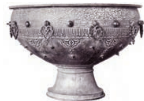
▲ شکل ۹-۱۱- ظرف فلزی