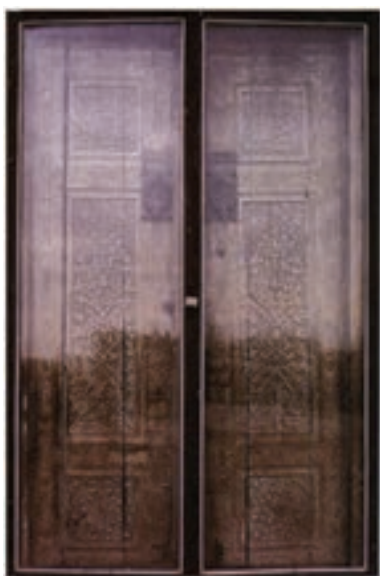
▲ شکل ۸-۱۱- در چوبی، بقعه احمد یَسوی

با گسترش روابط میان ایران و چین و نیاز روزافزون به آثار سفالین، ساخت محصولات از قبیل چینی‌های آبی و سفید و تک‌رنگ در برخی از کارگاه‌های سفالگری ایران آغاز می‌شود. آثار مورد توجه در این دوره بیشتر شامل نمونه‌هایی با قلم‌گیری تیره در زیر لعاب شفاف فیروزه‌ای و سبز یا به صورت نقاشی با رنگ‌های مختلف در زیر لعاب شفاف بی‌رنگ بود. برخی نیز به صورت نقاشی زرین فام ۱ بودند که در قالب اشیاء تزئینی و کاربردی، و کاشی به کار می‌رفتند (شکل ۱۰-۱۱).