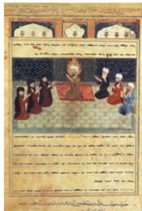
▲ شکل ۴-۱۱- برگی از کتاب معراج نامه

همانگونه که اشاره شد هنر کتابت و نگارگری در این دوره به اوج و شکوفایی می‌رسد و باعث پدید آمدن مکتب‌های کمال یافته شیراز و هرات می‌شود. مهم‌ترین تحول نگارگری در ادامه با تسلط رنگ قرمز در مکتب شیراز است. تداوم سنت هنری دوران جلایری نیز با تسلط رنگ آبی در مکتب هرات به کار می‌رود. آثار مهم تولید شده مکتب هرات در سه دوره شاه‌رخ، بایسنقر میرزا و کمال‌الدین بهزاد شامل معراج نامه (شکل ۴-۱۱) شاهنامه بایسنقری (شکل ۵-۱۱) و بوستان سعدی با نقاشی کمال‌الدین بهزاد (شکل ۶-۱۱) می‌شود. همچنین از مهم‌ترین تحولات نقاشی بعد از سده نهم هجری، رواج روزافزون تک چهره‌پردازی می‌باشد (شکل ۷-۱۱) که زمینه‌ساز نوعی مجلد به صورت مجموعه‌های نقاشی و خطاطی موسوم به مرقعات ۱ است. هنر کتاب‌آرایی با به‌کارگیری جلدهای سوخت و زرکوب در این زمان، مراحل تکامل خود را می‌پیماید که آثار به‌جامانده مایه افتخار و مباهات است. ویژگی بارز نقاشی و نگارگری در این دوره ایجاد کمال تعادل در اندازه‌ها، ترکیب‌بندی و رنگ‌آمیزی فاخر است. در این نقاشی پیکره انسان در برابر معماری با منظره طبیعی به درستی جای داده شده و به آن وحدت بخشیده است. در این جا نگارگر از توان خود برای تجسم جهانی تازه بهره برده که اوج آن را در شاهنامه بایسنقری می‌توان دید. تداوم نگرش هنری مکتب هرات را به گونه‌ای دیگر در مکتب ترکمانان و مکتب تبریز در دوره صفوی به دلیل حضور بهزاد و همچنین مکتب بخارا به دلیل حضور شاگردان بهزاد به خوبی می‌توان دید.