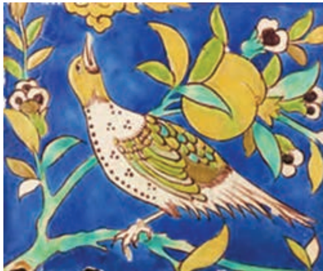
▲ شکل ۱۷-۱۲- نقش کاشی هفت رنگ، دوره صفویه

در دوره صفوی علاوه بر کاشی معرق، از نوعی کاشی هفت رنگ ۱ برای سرعت بخشیدن در تکمیل تزئین دیوار بناها استفاده می شد (شکل ۱۸-۱۲ الف و ب). نقوش به کار رفته در این کاشی ها غالباً نقوش اسلیمی و ختایی با رنگ های متنوع لاجوردی، آبی، سفید، زرد اُکر، سیاه، قهوه ای و سبز بودند.