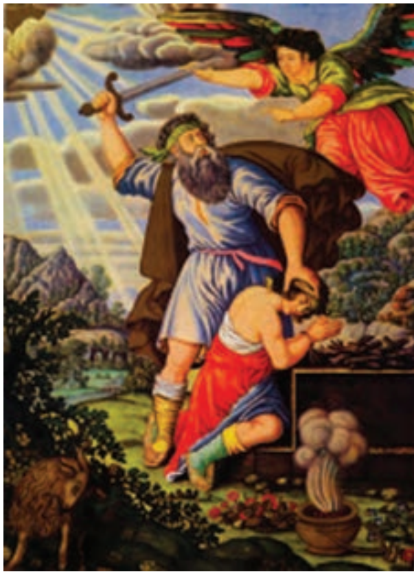
▲ شکل ۱۰-۱۲- نقاشی اثر محمد زمان