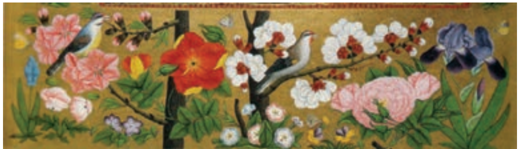
▲ شکل ۱۱-۱۲- گل و مرغ

منسوجات با وجود پیشینه بسیار غنی در این دوره به نیمه اول سده دهم هجری باز می‌گردد که زمینه‌ساز تولید فرش‌هایی مانند فرش‌های اردبیل (شکل ۱۲-۱۲) و فرش‌های اصفهان شد. غنای فرش‌های تولید شده به دلیل کاربرد طرح‌های اسلیمی، ختایی، شمشه‌ها و ... با الیاف ابریشم است (شکل ۱۲-۱۳). همچنین وجود ابریشم فراوان در این دوره، زمینه‌ساز تولید پارچه‌های نفیس از جمله زربفت بود (بسیار مورد توجه دربار بوده). این پارچه‌ها با زمینه رنگی و از تار و پود طلا بافته می‌شد. نقش گل‌ها از ابریشم براق با رنگی نزدیک به متن بود و در آن از طرح‌های نگارگری نیز بهره می‌بردند (شکل ۱۲-۱۴). فن بافت نیز با بافت پارچه‌های مخمل همراه با طرح گل و بوته برجسته و تافته براق با نخ‌های چند تایی (چند نخ تابیده در هم) تحول اساسی یافت. ایجاد طرح‌های نگارگری در