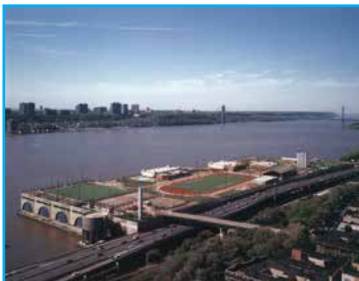
شکل ۱-۲- اماکن طبیعی سرزمینی (کوه‌ها و دریاچه‌ها) و اماکن روباز احداثی (زمین فوتبال) از نمای بالا به خوبی قابل تشخیص هستند.