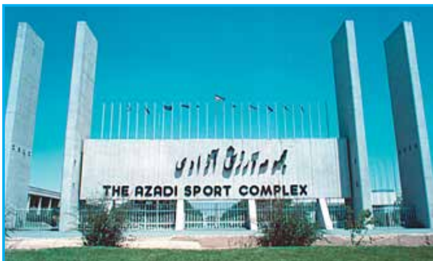
شکل ۵-۱- در ورودی - خروجی غربی مجموعه ورزشی آزادی تهران

مجموعه ورزشی آزادی تهران: این مجموعه که به منظور برگزاری مسابقات آسیایی ۱۳۵۳ ساخته شد، در غرب شهر تهران واقع شده است. عملیات جدی ساختمان های این مجموعه در محدوده دوساله ی ۱۳۵۱ تا ۱۳۵۳ اجرا شد. از بخش های مهم این مجموعه می توان استادیوم یکصد هزار نفری