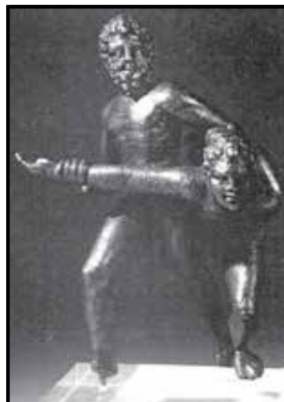
شکل ۱-۱- این تندیس به‌جا مانده از زمان بسیار دور، نشان‌دهنده‌ی نقش ورزش کشتی در فرهنگ آن دوران است.

«مدرسه‌ی نوجوانان» مکان ورزشی دیگری بود که در آتن جدید، برنامه‌ی دوساله‌ای برای تربیت بدنی تدارک دیده بود (شکل ۱-۲).