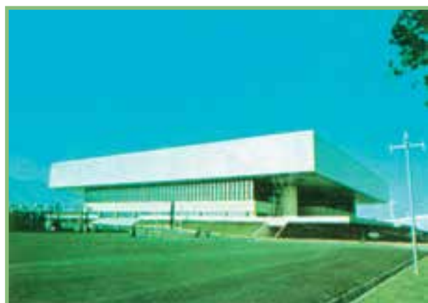
شکل ۲-۲- الف- سالن سربوشیده‌ی شنای مجموعه‌ی ورزشی آزادی با استانداردهای بین‌المللی در رشته‌های شنا، شیرجه و واترپلو.

هم‌چنین، سالن‌های چند منظوره با ابعاد و استانداردهای بین‌المللی برای مسابقات قاره‌ای و جهانی مورد استفاده قرار می‌گیرند (شکل ۲-۲- الف).