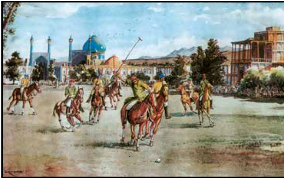
شکل ۳-۱- میدان بزرگ اصفهان (میدان امام) محل بازی چوگان و عالی قاپو، اولین عمارت برای تماشای چوگان.