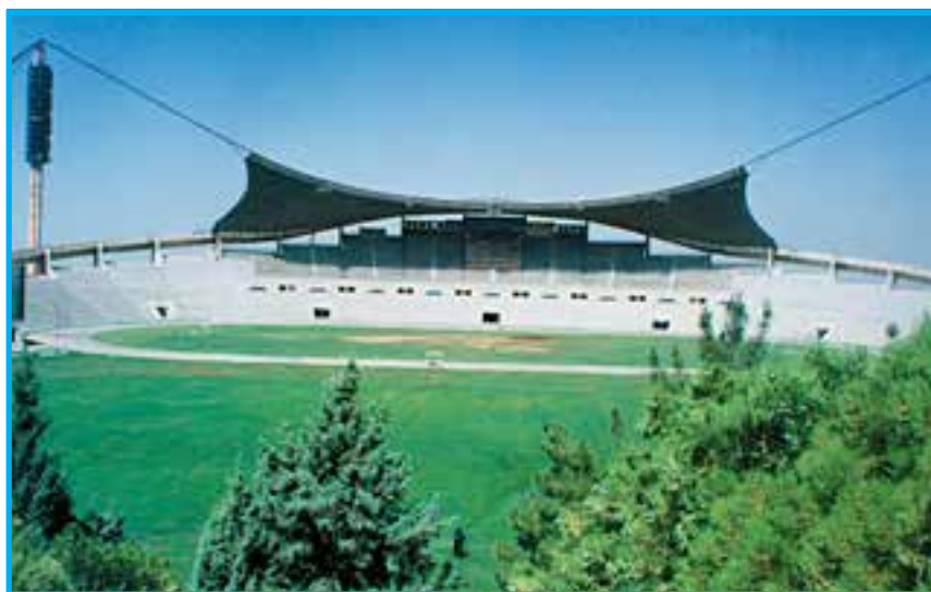
شکل ۶-۱- نمایی از زمین چمن، سکوها و جایگاه مجموعه‌ی ورزشی تختی تهران

مجموعه‌ی ورزشی تختی: این ورزشگاه در دامنه‌ی کوهستان‌های شرق تهران پی‌ریزی شده است. عملیات ساختمان‌های استادیوم، از اوایل سال ۱۳۴۸ آغاز شد. ورزشگاه بزرگ شرق تهران با طرح نعل اسبی، برای اولین بار در ایران پیاده شده است. در ساخت این استادیوم برای اولین بار در خاورمیانه از یک روش فنی خاص استفاده شده است که می‌توان برای برگزاری بازی‌ها و نمایش‌های ملی، از