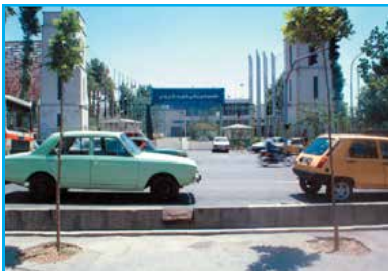
شکل ۴-۱- مجموعه ورزشی شهید شیرودی تهران

فوتبال ۱ ، سالن دوازده هزار نفری، دریاچه، پیست دوچرخه سواری (ولودروم)، استخر شنا، پنج سالن و ... را نام برد. ساخت این مجموعه همزمان با مجموعه ورزشی تختی تهران آغاز شد (شکل ۵-۱). ساخت و ساز ورزشگاه آزادی توسط فردی به نام فرمانفرمائیان طراحی شده است.