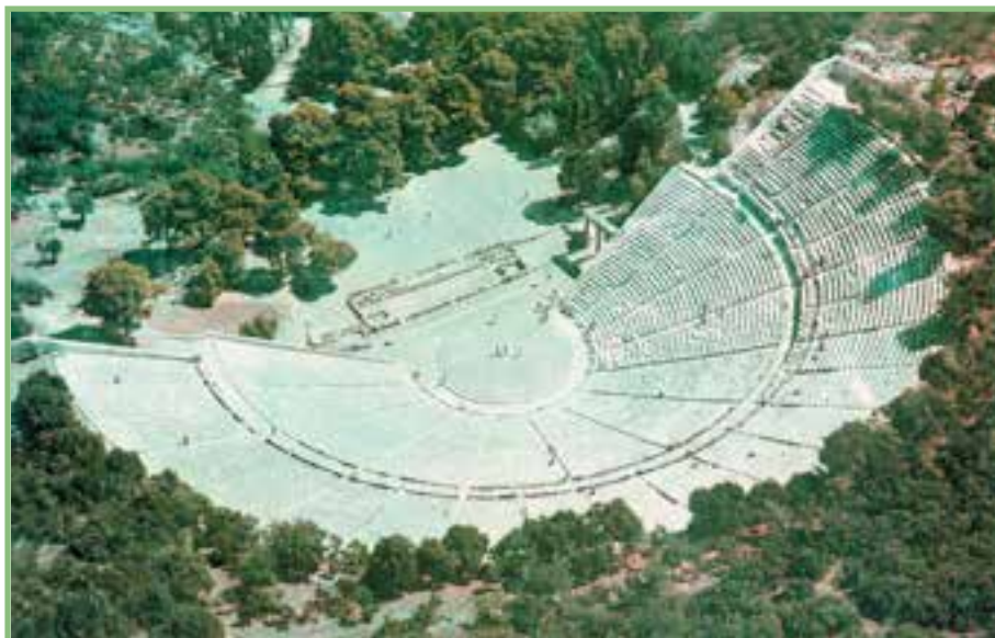
شکل ۱-۲- یکی از آمفی‌تئاترهایی که از دوران باستان به‌جا مانده است.

برنامه‌های تربیت بدنی اسپارتی‌ها در اوایل، در زمین‌های مسطحی به نام «ژیمنازیوم» اجرا می‌شد اما هرچه توجه اسپارتی‌ها به تربیت بدنی و برنامه‌های نظامی افزایش یافت، منابع و امکانات