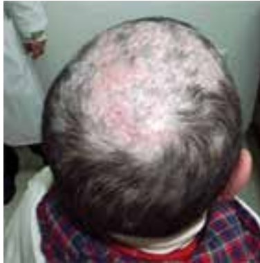
شکل ۱-۹- کچلی سر

این بیماری‌ها علت قارچی دارند و می‌توانند پوست، مو و ناخن را گرفتار سازند و بیشتر در سنین مدرسه شایع‌اند. از بین آن‌ها، کچلی سر از همه انواع دیگر شایع‌تر است. کچلی سر به صورت صفحات پوسته‌دار با قرمزی خفیف و موهای شکسته و شل و گاهی نقاط سیاه رنگ بر روی پوست ظاهر می‌شود. در مناطق روستایی کچلی سر به صورت التهابی و با ترشحات چرکی همراه است که ناشی از قارچ‌های حیوانی و یا خاکی است (شکل ۱-۹).