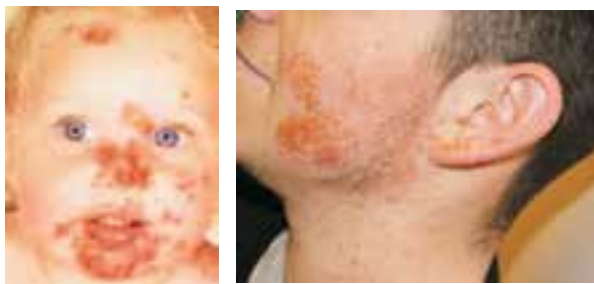
شکل ۴-۹- زردزخم صورت

نوعی بیماری پوستی عفونی با علت استرپتوکوک و یا استافیلوکوک است. این بیماری در سنین قبل از مدرسه و مدرسه شایع است. زردزخم در افرادی که بهداشت را رعایت نمی‌کنند بیشتر دیده می‌شود. علائم بیماری به صورت قرمزی پوست با ترشح و دلمه زرد عسلی بیشتر در صورت و اطراف دهان و بینی مشاهده می‌گردد (شکل ۴-۹).