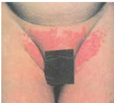
شکل ۱۳ - ۹ - اگزمای ناشی از قارچ کاندیدا

این بیماری در سنین شیرخوارگی به علت تحریک پوست بر اثر تماس طولانی با ادرار و یا مدفوع بوجود می آید. عدم تعویض بموقع کهنه و یا پوشک، سبب تشدید عارضه می گردد. این بیماری به صورت قرمزی ناحیه ی تناسلی بروز می کند و در صورت طولانی شدن ممکن است در چین های منطقه قارچ کاندیدا (برفک) اضافه شود که با بروز دانه های به ظاهر چرکی، در اطراف ضایعه اصلی و چین ها مشخص می گردد (شکل ۱۳ - ۹).