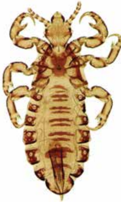
شکل ۵ - ۹ - شپش موی سر

بیماری است که به علت آلودگی پوست و موی سر با این حشره، در مناطق پر جمعیت که سطح بهداشت فردی و اجتماعی پایین است مشاهده می‌گردد. لذا این بیماری در مواقع جنگ و بی‌خانمانی شیوع بیشتری پیدا می‌کند (شکل ۵ - ۹).