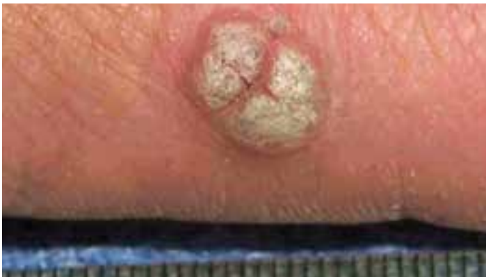
شکل ۸-۹- زگیل معمولی

بیماری ویروسی مزمنی است که در سنین خردسالی شایع است. بیماری به صورت دانه‌های برجسته به رنگ پوست با سطح خشن و یا صاف می‌باشد. این ضایعات در پشت دست‌ها و صورت، بیشتر از سایر نقاط بدن مشاهده می‌گردد (شکل ۸-۹).