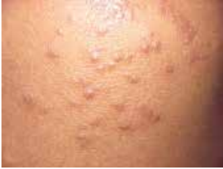
شکل ۷-۹- گال یا جَرَب

ناف و ناحیه‌ی تناسلی به وجود می‌آیند. حرکت انگل در پوست سبب انتشار بیماری می‌گردد (شکل ۷-۹). خارش بدن به هنگام شب بیشتر است.