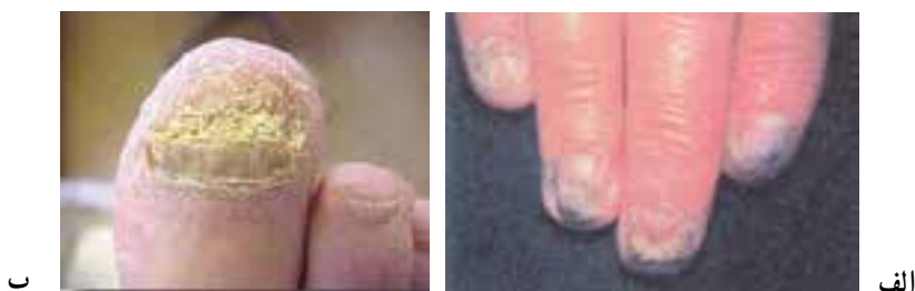
شکل ۳-۹- ضایعه قارچی ناخن (کچلی ناخن)

کچلی ناخن: با التهاب و قرمزی ناخن و تغییر شکل آن مشاهده می‌گردد (شکل ۳-۹).