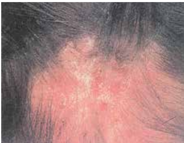
شکل ۶-۹- شپش سر

علامه بیماری: شامل خارش سر و وجود رشک به صورت دانه‌های سفید چسبیده به موی سر می‌باشد (شکل ۶-۹). پوست سر در اثر خاراندن زیاد قرمز و ملتهب می‌شود و لذا گاهی بیماران به علت زرد زخم پشت گردن مراجعه می‌نمایند. شپش تن به علت نداشتن مو در کودکان مشاهده نمی‌شود.