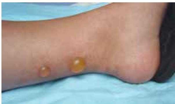
شکل ۹-۹- ضایعات ناشی از گزش حشرات

این بیماری در سنین خردسالی در فصول فعالیت حشرات یعنی بهار و تابستان دیده می‌شود. ضایعات به شکل دانه‌های قرمز خارش‌دار و برجسته بر روی قسمت‌های باز بدن به خصوص دست‌ها و پاها، شکم و کمر و صورت بروز می‌کند. گاهی ضایعات به شکل تاولی مشاهده می‌شود (شکل ۹-۹). درمان گزش شامل استفاده از داروهای ضد خارش موضعی است.