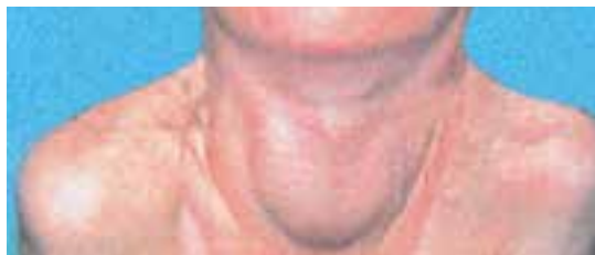
شکل ۶-۸- گواتر

ید یکی از عناصر کمیاب و مهم است. کمبود ید در بسیاری از نواحی، سبب ایجاد گواتر ۱ (بزرگی غده تیروئید) می‌شود. اگر بیش از ۱۰ درصد مردم یک ناحیه به گواتر مبتلا باشند به آن ناحیه «اندمیک» می‌گویند. در مناطقی که گواتر بیش از حد در زنان یافت می‌شود خطر اینکه نوزادان آن‌ها تا حدودی از لحاظ روانی غیرطبیعی باشند وجود دارد. کم کاری تیروئید مادرزادی ۲ ، کری، لالی، عقب افتادگی ذهنی از جمله بیماری‌های کودکانی است که مادرانشان دچار کمبود شدید ید هستند (شکل ۶-۸).