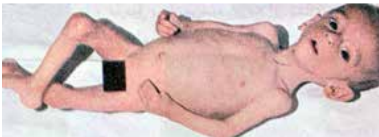
شکل ۳-۸- کودک مبتلا به ماراسموس

درمان سوء تغذیه: در کودکان مبتلا به سوء تغذیه‌ی خفیف، باید اقدامات زیر انجام گیرد: الف- افزایش مواد پروتئینی و کالری‌زا به رژیم غذایی کودک ب- افزایش تعداد وعده‌های غذا ج- کنترل مرتب وزن و سلامتی د- درمان عفونت و اسهال که موجب بروز سوء تغذیه هستند. کودکان مبتلا به سوء تغذیه‌ی شدید را باید هرچه زودتر در بیمارستان بستری نمود تا در صورت وجود کم آبی و عفونت، به درمان آن‌ها اقدام شود. مهمترین موضوع در درمان سوء تغذیه، برطرف کردن عوامل بوجود آورنده‌ی آن است مانند: از بین بردن فقر و مسکنت و بی‌سوادی و تهیه‌ی غذای کافی برای افراد جامعه و آموزش بهداشت در سطح فردی و اجتماعی.