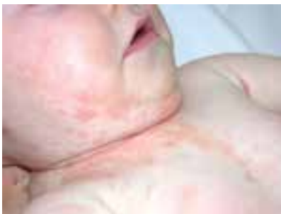
شکل ۱۲-۹- اگزمای شیرخوارگی در یک کودک