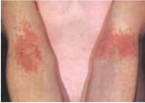
شکل ۱۱-۹- گرفتاری سطح قدامی آرنج در اگزمای سرشستی