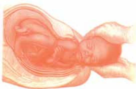
شکل ۴- ۵- بیرون آوردن سر و شانه‌ها