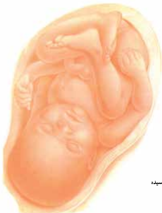
شکل ۳-۴- جنین رسیده