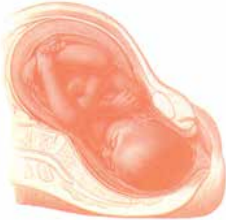
شکل ۲- ۵- آغاز مرحله دوم زایمان