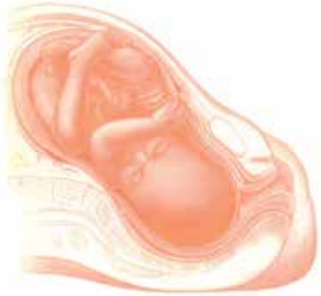
شکل ۱- ۵- نخستین مرحله زایمان