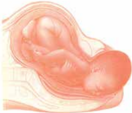
شکل ۳- ۵- مرحله دوم زایمان ادامه دارد