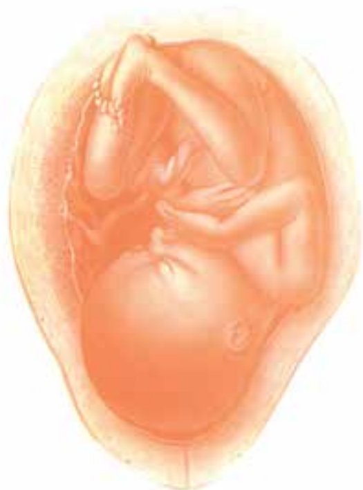
شکل ۲-۴- بیست و چهارمین هفته حاملگی