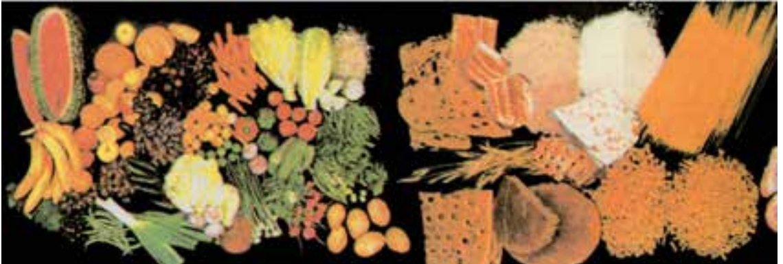
شکل ۴-۴- چهار گروه اصلی مواد غذایی

لازم به ذکر است که بدن زنان باردار، به غیر از گروه‌های ذکر شده در تأمین انرژی، به چربی و مواد قندی نیز نیاز دارد که به میزان کمتری مصرف می‌شود. از چربی‌ها می‌توان به انواع روغن‌های گیاهی، حیوانی و کره اشاره کرد که در تهیه غذاهای روزانه استفاده می‌شوند. مواد قندی شامل شکر، قند، عسل، مربا و نظایر آن می‌باشد.