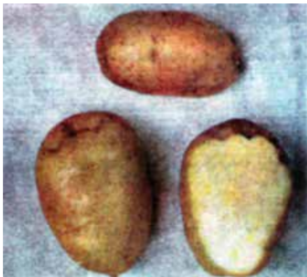
شکل ۱۱-۳- جوانه زنی غده‌ی سیب زمینی