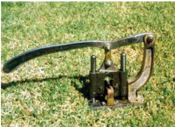
شکل ۱-۷- یک نوع دستگاه پیوندزنی