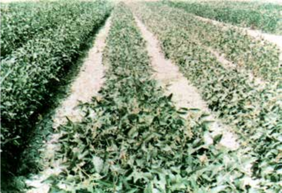
شکل ۸-۳- زراعت سویا به صورت ردیفی

سویا اغلب به صورت ردیفی کشت می‌شود؛ اگر چه در بعضی مناطق کاشت درهم و کرتی نیز معمول است. به هر حال کاشت ردیفی آن همانند اغلب محصولات، بهترین روش کاشت است (شکل ۸-۳).