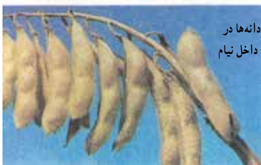
دانه‌ها در داخل نیام