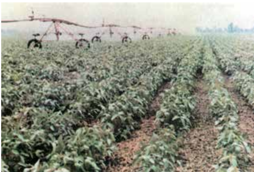
شکل ۹-۳- آبیاری به روش بارانی در سویا

تمام عملیات داشت را به روشی که هنرآموزان شما تأیید می‌کنند، انجام دهید.