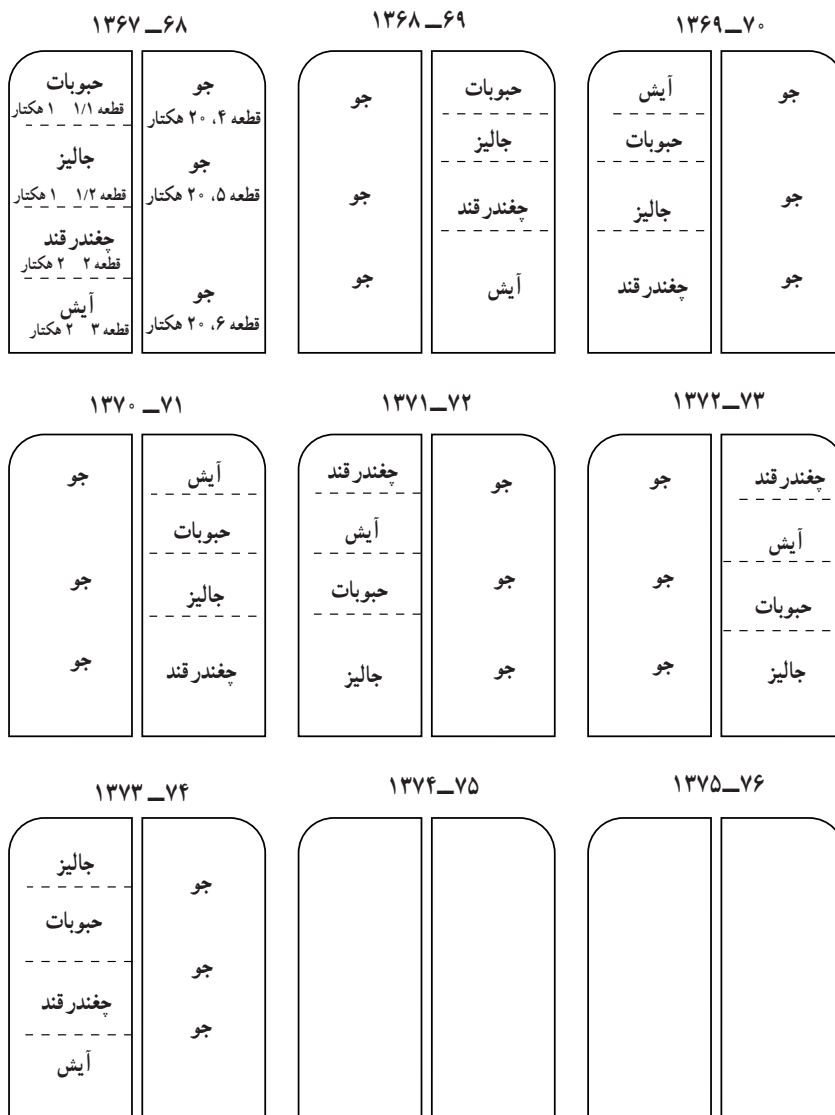
شکل ۳-۹- تناوب زراعی اراضی مزروعی یکی از هنرستان‌های کشاورزی کشور

چنانچه در خاطرتان باشد هم در تعریف آیش‌بندی و هم در تعریف تناوب زراعی، رعایت اصول علمی و فنی آمده بود. در این جا لازم است که شما را با این اصول آشنا سازیم.