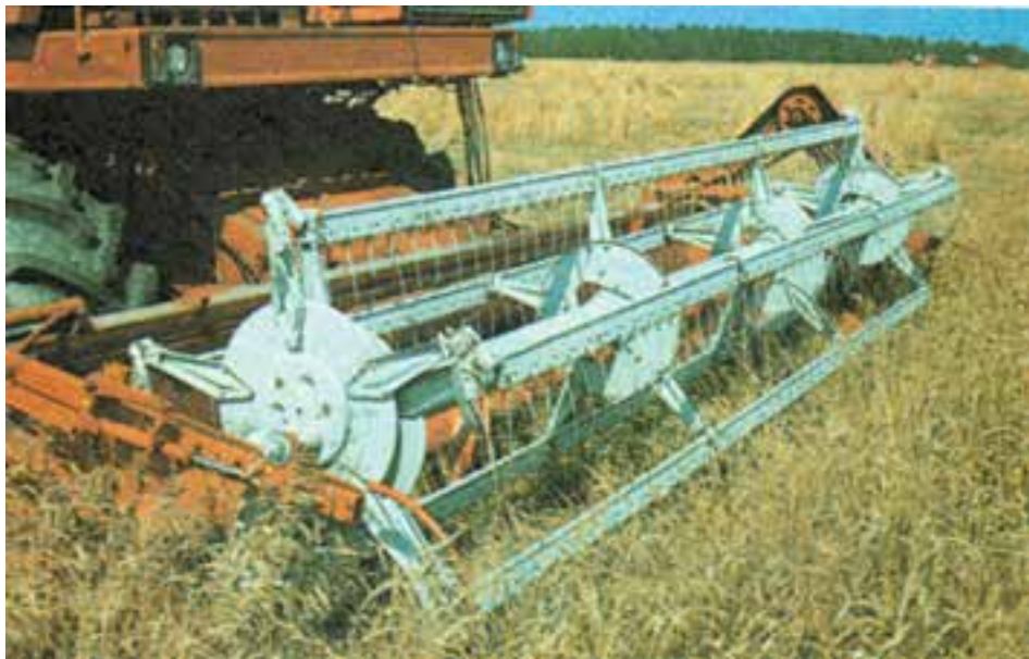
شکل ۲-۸- کمباین در حال برداشت

— ماشین کمباین : علاوه بر کوبیدن، جدا کردن دانه از کاه، تمیز کردن و انبار کردن دانه را هم انجام می‌دهد (شکل ۲-۸).