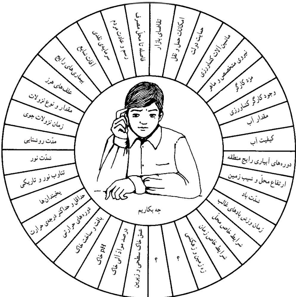
شکل ۹-۱- تعدادی از عوامل مؤثر در تعیین نوع محصول قابل کاشت در یک منطقه

شکل ۹-۱ تعدادی از عوامل مؤثر بر انتخاب نوع محصول جهت یک منطقه را نشان می‌دهد. آیا شما عامل یا عوامل دیگری را می‌توانید بر این عوامل بیافزایید؟ اگر از عوامل فوق، یکی یا تعدادی را مؤثر نمی‌دانید دلیل آورده، در کلاس بحث کنید.