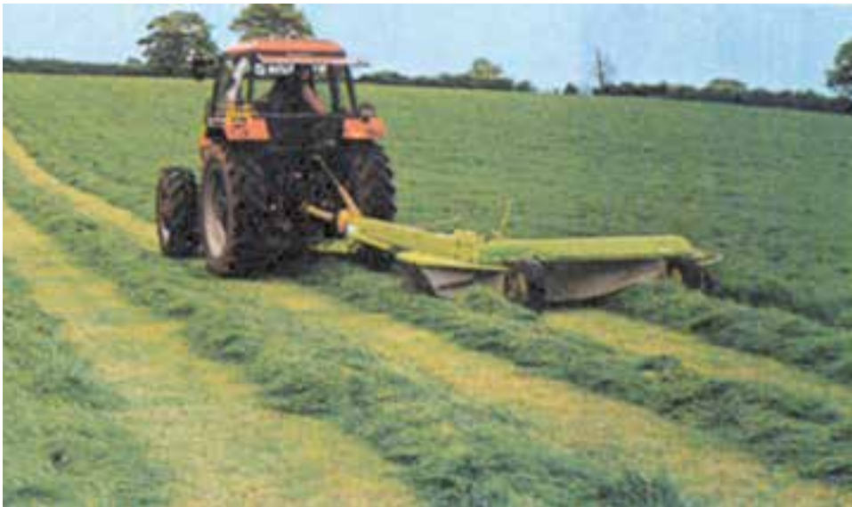
شکل ۸-۱- موور در حال برداشت علوفه

— ماشین علف‌بر (موور) : تنها ساقه را از نزدیک زمین قطع می‌کند و در یک مسیر قرار می‌دهد (شکل ۸-۱).