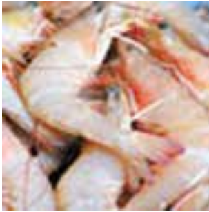
شکل ۱-۲- میگو

عصر حاضر صورت گرفته است. قدیمی‌ترین کتاب موجود درباره پرورش گیاهان آبی، کتابی است که در سال ۱۹۵۲ در ژاپن چاپ گردیده است.