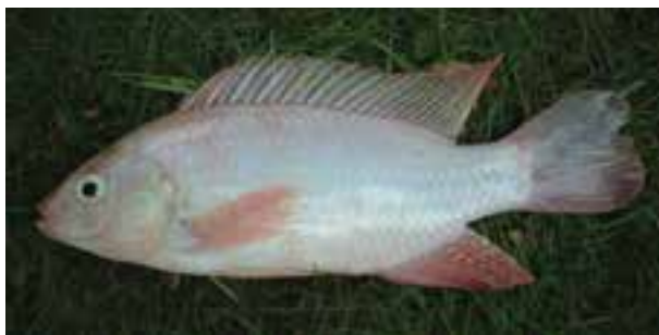
شکل ۱-۱- ماهی تیلاپیا

آبی پروری با پرورش مصنوعی ماهی در کشور چین آغاز شد. ولی در مصر قدیم و اروپای مرکزی نیز تاریخچه‌ای طولانی دارد. سابقه پرورش ماهی در کشور چین به بیش از ۳۰۰۰ سال قبل در منطقه (ین دیناستی) مربوط می‌شود (۱۱۳۷ تا ۱۴۰۰ سال قبل از میلاد). و در حدود ۴۶۰ سال قبل از میلاد در منطقه (وارینگ کینگ دام) پرورش ماهی تا حد خوبی توسعه یافته بود. فانلی ۱ از چین اولین فردی بود که کتاب اصول پرورش ماهیان آب شیرین را تدوین کرد. بعضی از مورخین براین باورند که پرورش ماهی تیلاپیا ۲ در مصر زودتر از پرورش ماهی کپور در چین آغاز شده است. به عبارت دیگر مصری‌ها حدود ۲۵۰۰ سال قبل از میلاد حضرت مسیح (ع) ماهی تیلاپیا که بومی آفریقا و خاورمیانه است و امروزه در همه قاره‌های گرمسیری یافت شده و به یکی از مشهورترین ماهیان برای پرورش در سراسر دنیا تبدیل شده است را در استخرهای خاکی پرورش می‌داده‌اند.