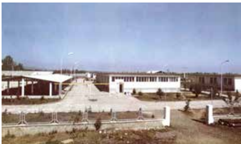
شکل ۳-۱- شمای کلی کارگاه تکثیر تاسماهیان شهید بهشتی (سد سنگر)

گرفته است، با وجود این احداث یک مزرعه مستقل تکثیر و پرورش ماهی، به سال ۱۳۴۱ برمی گردد. در این سال اولین مزرعه تکثیر و پرورش ماهی ایران در کرج احداث شد. این مزرعه در حال حاضر ماهی سرای کرج نام دارد و از همان ابتدا به کار پرورش ماهی قزل آلائی رنگین کمان پرداخت. اولین مزرعه تکثیر و پرورش ماهیان گرم آبی در سال ۱۳۵۱ در جنوب رشت تأسیس شد که متعلق به شرکت سهامی دامپروری سفیدرود است. اولین مزرعه تکثیر و پرورش ماهی وابسته به شیلات که به منظور افزایش ذخایر ماهیان خاویاری دریای خزر احداث شد، کارگاه شهید بهشتی (سد سنگر سابق) است که در سال ۱۳۵۰ به بهره برداری رسید.