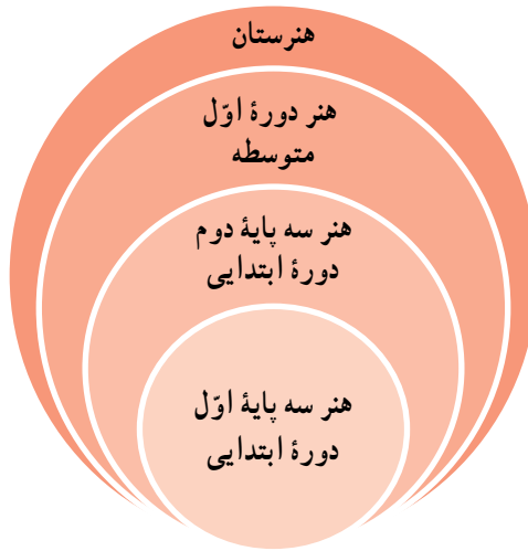
نمودار ۱- مراحل آموزش هنر در مقاطع تحصیلی نظام جدید آموزش و پرورش

توجه نوجوانان به هنر و زیبایی از طریق مشاهده پدیده‌های طبیعت و آثار ارزشمند هنری و پرورش خلاقیت آنها از طریق انجام دادن فعالیت‌های خلاق است. همچنین، با آگاهی از اهمیت شناخت نوجوانان از حوزه فرهنگ و هنر و ارزش میراث فرهنگی و هنری، در برنامه هنر این مقطع تحصیلی بر آثار هنر ایران، به خصوص میراث ارزشمند دوران اسلامی تأکید شده است.