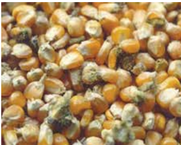
شکل ۴-۷- دانه های ذرت آلوده

۲-۴-۵- درجه بندی مواد اولیه : مواد اولیه ای که در دان طیور استفاده می کنید باید از مواد خوراکی درجه یک باشد و هیچ گونه آلودگی قارچی نداشته باشد. هم چنین این مواد باید سالم و بدون شکستگی باشد، زیرا شکسته بودن این مواد زمینه آلوده شدن به قارچ ها را فراهم می کند. مواد اولیه شکسته ایجاد خاک می کند و جزء مواد درجه پایین است.