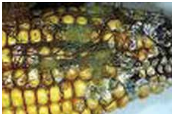
شکل ۴-۶- بلال کپک زده

۱-۴-۶- قارچ کش ها و روش های استفاده از آنها : جداسازی و تمیز کردن، اولین اقدام برای کنترل مواد آلوده به شمار می رود. در مرحله بعد و در صورت وجود آلودگی از قارچ کش ها استفاده نمایید.