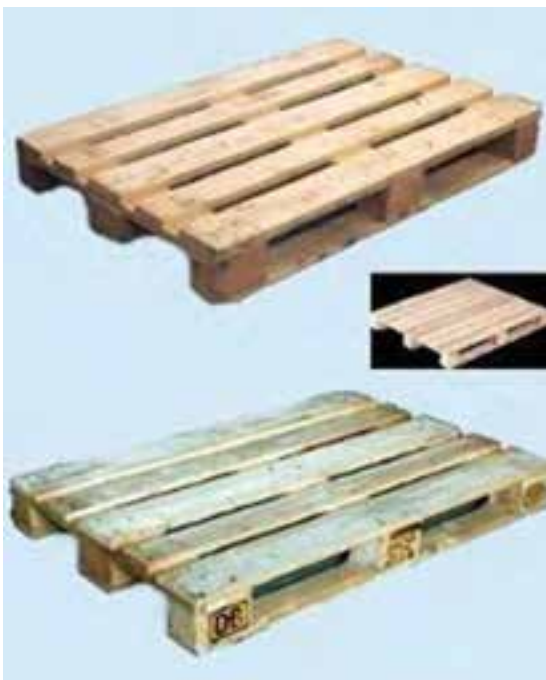
شکل ۱-۴- پالت چوبی