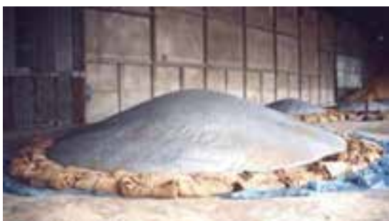
شکل ۲-۴- نحوه نگه‌داری مواد در انبار