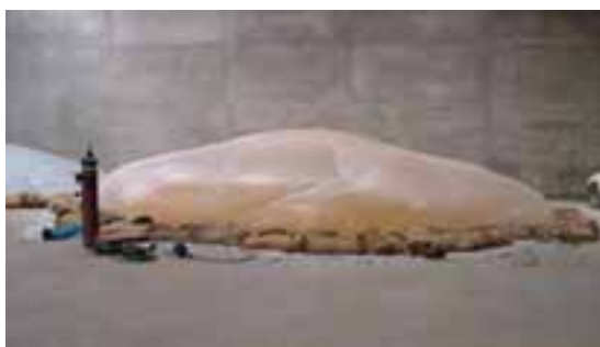
شکل ۳-۴- هوادهی مواد خوراکی

تا آلوده نبودن آن به حشرات، کنه‌ها و آفات محرز گردد. علاوه بر این حداقل هر هفته یک بار محتوی انبار را از نظر وجود احتمالی آفات و امراض بازرسی کنید و در صورت لزوم نمونه‌هایی از آن را برای آزمایش به آزمایشگاه بفرستید.