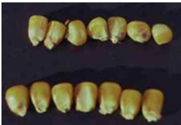
شکل ۴-۴- شناسایی ظاهری مواد خوراکی