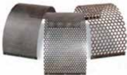
شکل ۳-۳ انواع غربال (توری)