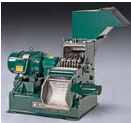
شکل ۲-۳ آسیاب چکشی