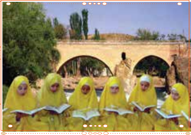
انس با قرآن کریم در استان چهارمحال و بختیاری

با راهنمایی آموزگار خود پس از آوردن قرآن کریم از دفتر مدرسه، آن را به صورت تصادفی باز کنید و از روی آن بخوانید.