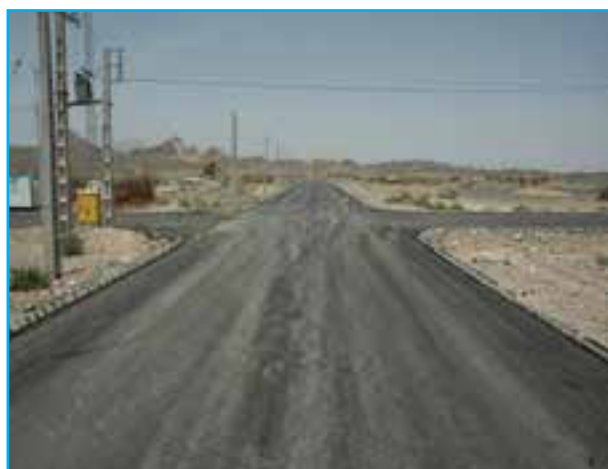
شکل ۹-۱۴- اجرای طرح‌های روستای چگرد خاش

۱- عمران روستایی : روستاهای استان از نظر عمران در سال‌های قبل از انقلاب اسلامی وضعیت مناسبی نداشته‌اند. بعد از انقلاب اسلامی اقدامات مهمی مانند ایجاد شبکه‌های برق‌رسانی، آبرسانی، فاضلاب روستایی، آسفالت خیابان‌ها، ایجاد مراکز