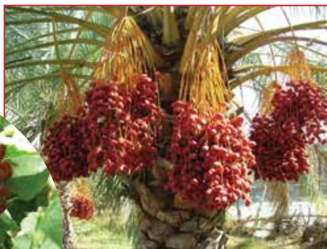
شکل ۵-۱۵- خرمای بلوچستان