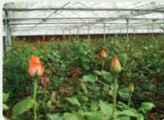
شکل ۸-۱۵- گلخانه