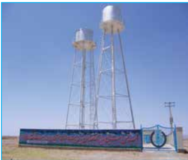
شکل ۱۰-۱۴- اجرای طرح آبرسانی بهداشتی روستایی