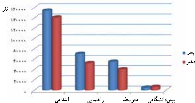
شکل ۱۶-۱۴- تعداد دانش‌آموزان استان به تفکیک مقاطع تحصیلی در سال تحصیلی ۸۸-۱۳۸۷

افزایش پوشش تحصیلی دوره ابتدایی، راهنمایی و متوسطه در بیشتر روستاهای استان که اغلب پراکنده و دور افتاده بودند و نیز ایجاد مدارس شبانه‌روزی، و خدمات دهی به دانش‌آموزان مناطق دور افتاده، در صدر برنامه‌های آموزش و پرورش استان بوده و می‌باشد.