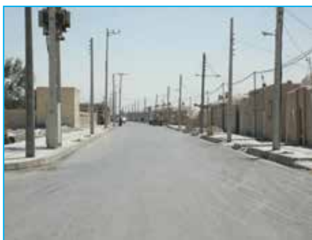
شکل ۸-۱۴- اجرای طرح هادی روستای قایم آباد زابل