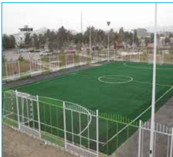
شکل ۱۲-۱۴- بعضی از دستاوردها (عمران شهری)