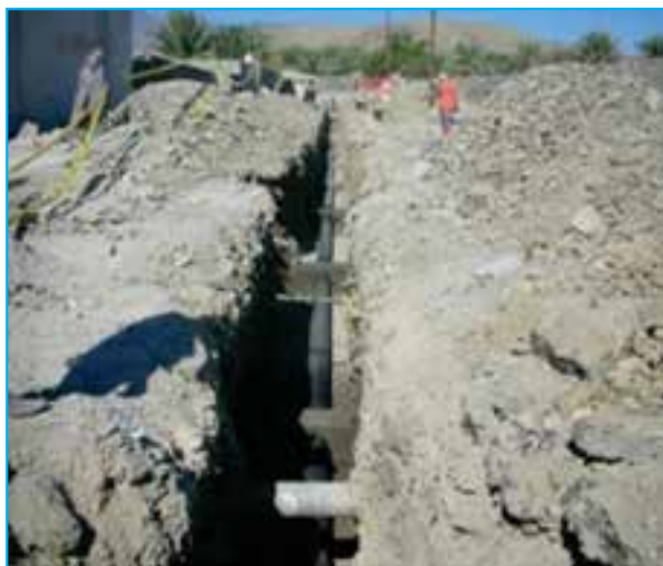
شکل ۱۱-۱۴- اجرای طرح فاضلاب روستایی در بلوچستان