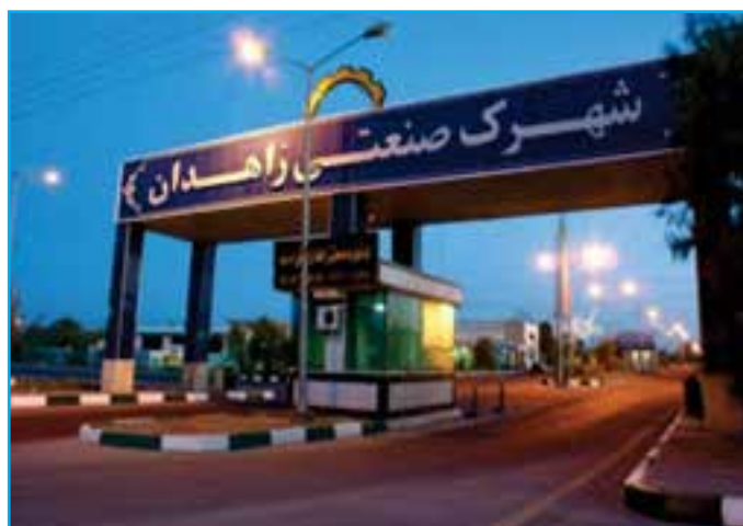
شکل ۴-۱۴- شهرک صنعتی زاهدان

تعداد کل پروانه‌های بهره‌برداری صنعتی در استان تا سال ۱۳۹۰، ۱۱۷۲ واحد است که از این میزان تعداد ۷۷۵ واحد به عبارتی ۶۶ درصد واحدهای فعال در شهرک‌ها و نواحی صنعتی و مابقی آن خارج از این محدوده قرار دارند.