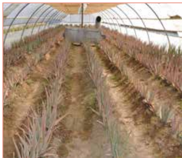
شکل ۷-۱۴- کشت گلخانه‌ای آلوئه‌ورا