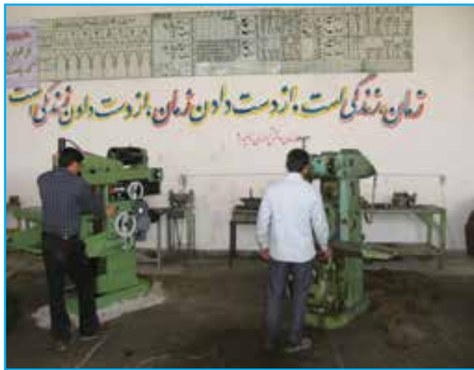
شکل ۱۵-۱۴- کارگاه‌های رایانه و ساخت و تولید (در هنرستان‌ها)