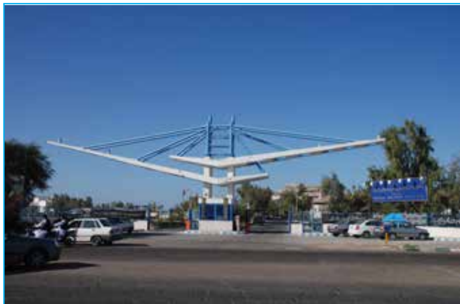
شکل ۲-۱۵- دانشگاه دریانوردی چابهار