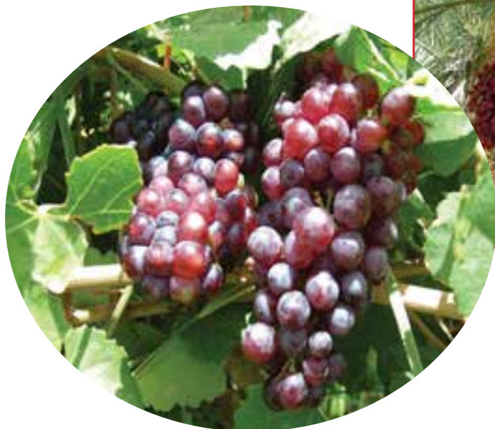
شکل ۶-۱۵- انگور سیستان