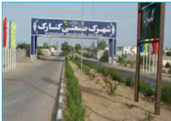
شکل ۳-۱۴- شهرک صنعتی کنارک

شرکت شهرک‌های صنعتی استان در دهم اسفندماه ۱۳۶۸ تأسیس شد و از اواخر نیمه نخست سال ۱۳۶۹ با پرسنل و امکانات محدودی تلاش گسترده‌ای را برای تحقق بخشیدن به یکی از هدف‌های استوار نظام اسلامی که همانا رشد و توسعه اقتصادی در جامعه است، آغاز کرد.