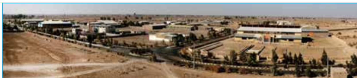
شکل ۵-۱۴- شهرک صنعتی محمدآباد زابل