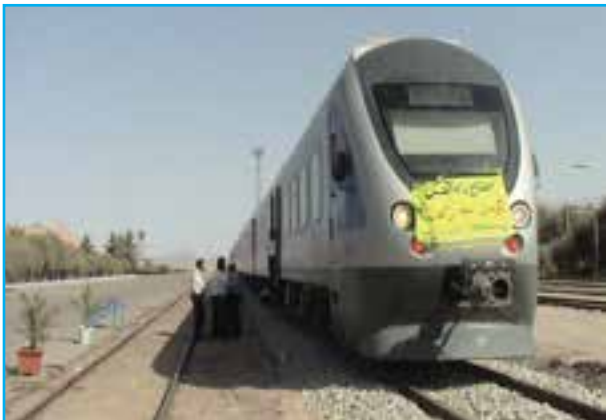
شکل ۱۳-۱۴- توسعه راه آهن و راه‌های استان