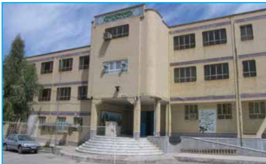
شکل ۱۴-۱۴- فضای آموزشی (هنرستان)

به تصاویر زیر نگاه کنید و بگویید انقلاب اسلامی در زمینه علمی – آموزشی چه دستاوردهایی برای استان سیستان و بلوچستان داشته است؟ همان‌طور که می‌دانید انقلاب اسلامی در زمینه‌های مختلف، جهت پیشرفت استان فعالیت‌های زیادی انجام داده که این اقدامات در زمینه علمی – آموزشی نیز چشمگیر است.