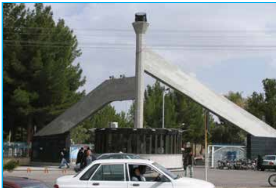
شکل ۳-۱۵- دانشگاه شهید نیکبخت