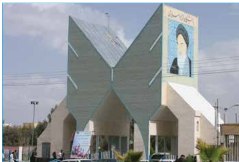
شکل ۴-۱۵- دانشگاه آزاد واحد زاهدان