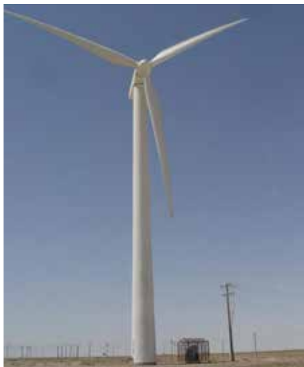
شکل ۷-۱۵- بهره‌گیری از انرژی‌های باد و خورشید