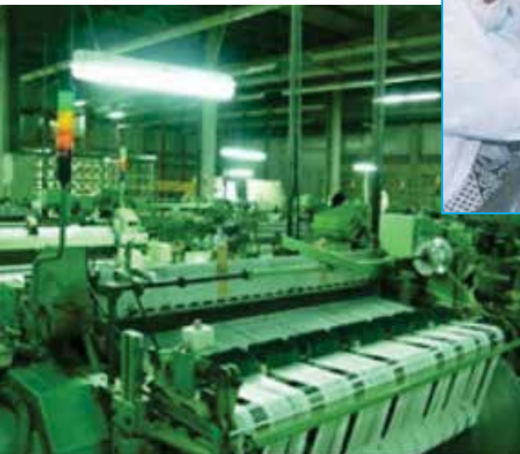
شکل ۶-۱۴- برخی از صنایع استان