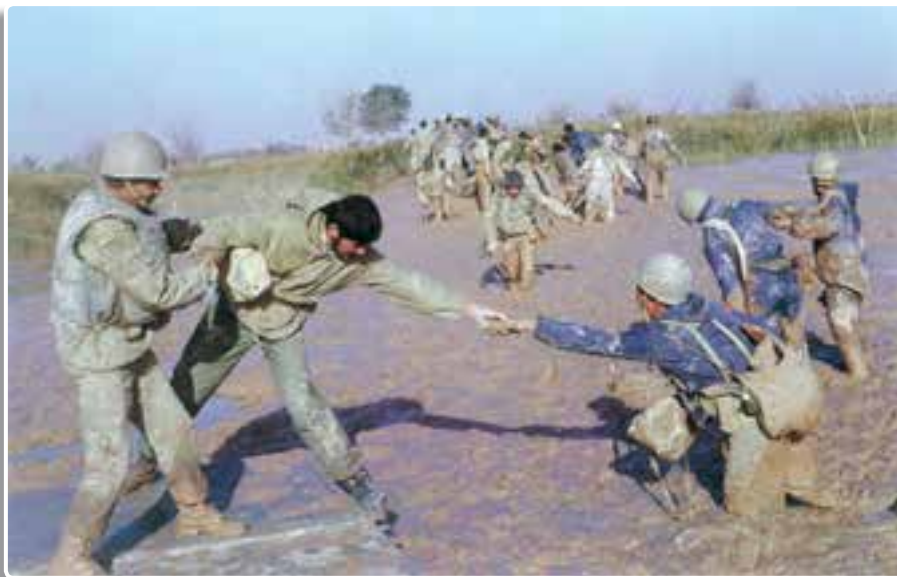
تصویر ۳-۳- رزمندگان میهن در منطقه عملیاتی والفجر ۸

موج عظیم مردمی در قالب «بسیج» برای دفاع از حقانیت اسلام و ایران به دفاع مقدس طعم غیرت و شرف دادند. سربازان ما در جبهه‌های نبرد حق علیه باطل به سرباز بودن خود می‌بالیدند. نیروهای مسلح شامل نیروی زمینی، هوایی، دریایی، ارتش جمهوری اسلامی ایران، سپاه پاسداران انقلاب اسلامی، نیروی انتظامی، هوانپروز و نیروهای جان بر کف جهاد سازندگی با انگیزه‌های الهی، شانه به شانه بسیج که پشتوانه مردمی و بازوی توانایشان بود، با وجود کمبود سلاح و مهمات و مشکلات اولیه، جانانه و قهرمانانه می‌جنگیدند. عشایر غیور ایران زمین و اقوام مختلف شامل آذری، لر، عرب، کرد، ترکمن، بلوچ و سایر قومیت‌ها و همچنین پیروان کلیه ادیان الهی در میهن ما متحد و منسجم تحت لوای پرچم مقدس جمهوری اسلامی و با هدایت و رهبری امام خمینی، سلحشوری و ایثارگری را معنا بخشیدند.