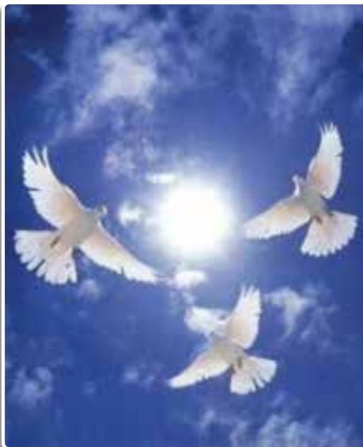
تصویر ۴-۱- پیام دین اسلام به جهانیان، صلح و دوستی است

واژه صلح به معنای آشتی، دوستی، سازش و ... به کار می‌رود. صلح از قدیمی‌ترین آرمان‌ها و آرزوهای بشر بوده است. به دلیل این‌که زندگی انسان‌ها از ناحیه جنگ و درگیری همواره در معرض تهدید و خطر بوده است، در طول تاریخ افراد زیادی تلاش کرده‌اند تا از جنگ و خونریزی جلوگیری کنند و بین انسان‌ها صلح و دوستی برقرار نمایند.