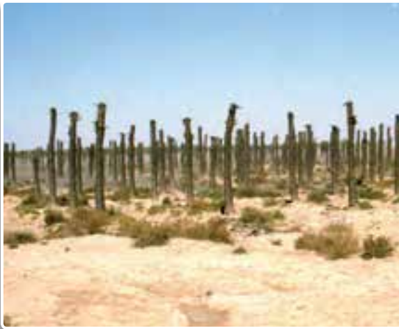
تصویر ۱-۳- نخل‌های سوخته