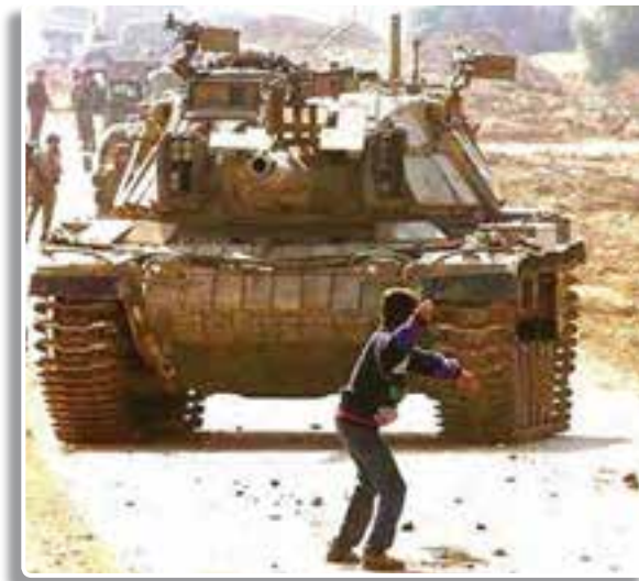
تصویر ۱-۱- تهاجم تانک‌های رژیم اشغالگر سرزمین فلسطین به مردم در غزه