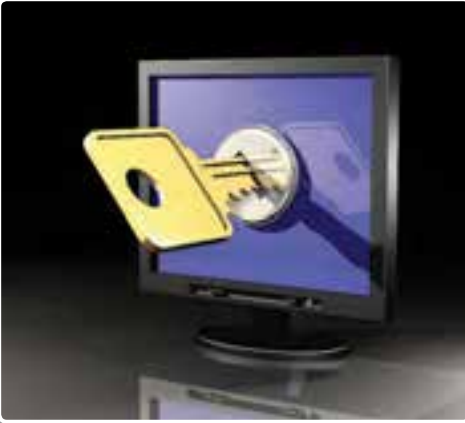
تصویر ۳-۱- پیشگیری و مقابله با تهدید نرم