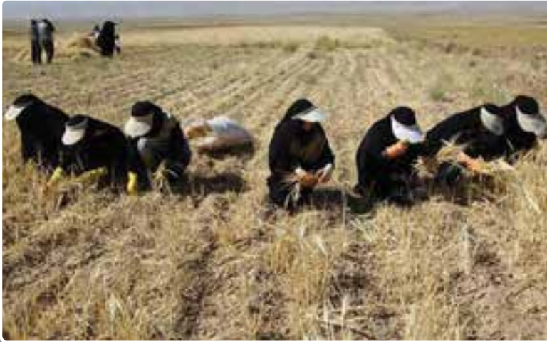
تصویر ۵-۲- حضور دانش‌آموزان بسیجی در عرصه سازندگی کشور