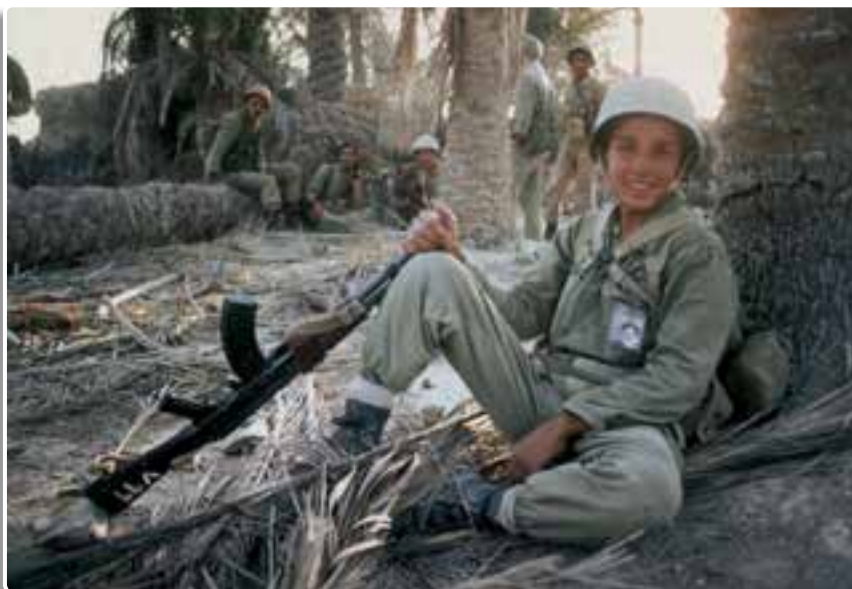
تصویر ۲-۳- رزمنده نوجوان بسیجی در مناطق عملیاتی جنوب

ایمان به خدا، رهبری حکیمانه امام خمینی (ره)، یکپارچگی و مشارکت مردم نه تنها موجب پیروزی انقلاب اسلامی ایران شد، بلکه بالاترین سلاح و مهمات ما در هشت سال دفاع مقدس بود. امام خمینی (ره) فرمودند: «جنگ، جنگ است و عزت و شرف ما در گرو همین مبارزه است». فرزندان غیور ملت شریف ایران با اعتقاد به خدای بزرگ و نصرت الهی در صفوف متحد به سوی جبهه‌ها روانه شدند و این نوای شیرین را سر می‌دادند: «هرکه دارد هوس کرب و بلا بسما...».