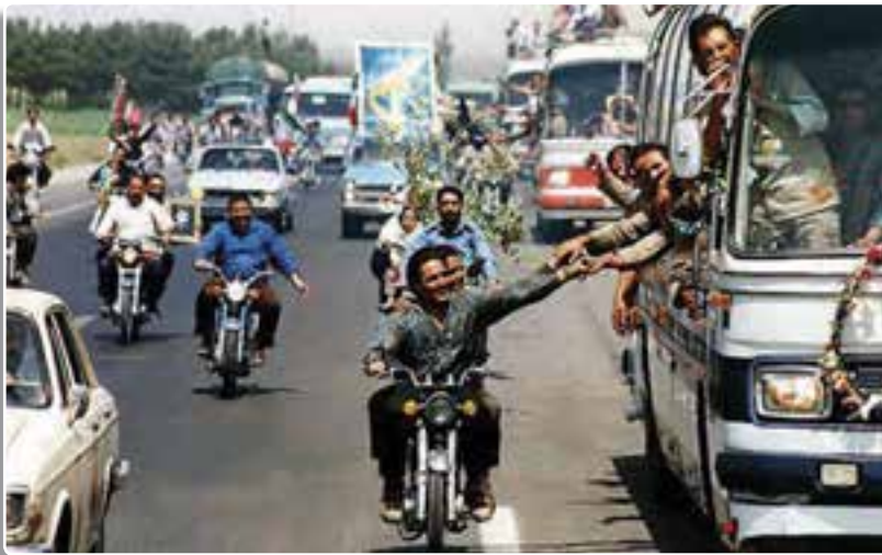
تصویر ۵-۳- بازگشت رزمندگان به میهن اسلامی

تهاجم دشمن پس از پذیرش قطعنامه نشان داد که اگر ما قدرت و توان لازم برای دفاع از کشورمان را نداشته باشیم، نمی‌توانیم صرفاً با امید به قطعنامه‌های بین‌المللی به صلح برسیم. در تاریخ ۲۶ مرداد ۱۳۶۹ (حدود دو سال پس از پذیرش قطعنامه) سرانجام با شکست مجدد صدام، نیروهای دو کشور به مرزهای بین‌المللی برگشتند. بازسازی شهرها و روستاهای مناطق جنگی آغاز شد و از تاریخ ۲۶ مرداد ۱۳۶۹ (حدود دو سال پس از پذیرش قطعنامه) آزادگان سرافراز میهن اسلامی پس از تحمل سال‌ها درد، رنج و شکنجه به آغوش وطن بازگشتند و موجی از شادمانی و سرور سراسر کشور را فراگرفت.