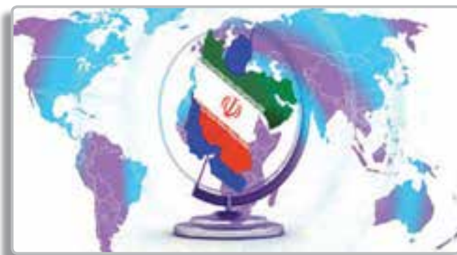
تصویر ۱-۲- جمهوری اسلامی ایران در بین کشورهای منطقه از امنیت ملی بالایی برخوردار است