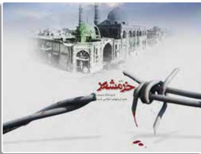
تصویر ۳-۴- خرمشهر را خدا آزاد کرد. «امام خمینی»

برخی معتقد بودند که با عقب راندن صدام در بسیاری از نقاط مرزی کشور، دیگر نیاز به ادامه جنگ نیست، اما مسئولان سیاسی و نظامی کشور و عموم مردم معتقد بودند که در چنین شرایطی نمی‌توان به صداقت دشمن و اراده سازمان‌های بین‌المللی اطمینان کرد و آتش‌بس را پذیرفت.