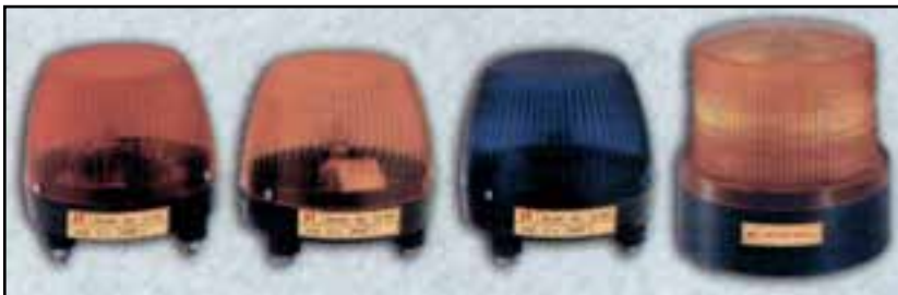
شکل ۵-۵- اژیر اعلام حریق

ب - با خبر کردن دیگران : ضروری است که در این مواقع فوراً سایر همکاران و همچنین مدیریت چاپخانه از وقوع حادثه مطلع شوند، خصوصاً در چاپخانه های بزرگ و وسیع لازم است وسایل اعلام حریق وجود داشته باشد. وسایل اعلام حریق ممکن است دستی یا خودکار باشد. شکل ۵-۵ و ۵-۶ برخی از تجهیزات اعلام حریق را نشان می دهد.