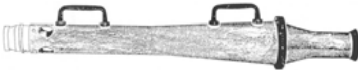
شکل ۴-۵- سر لوله آب آتش‌نشانی