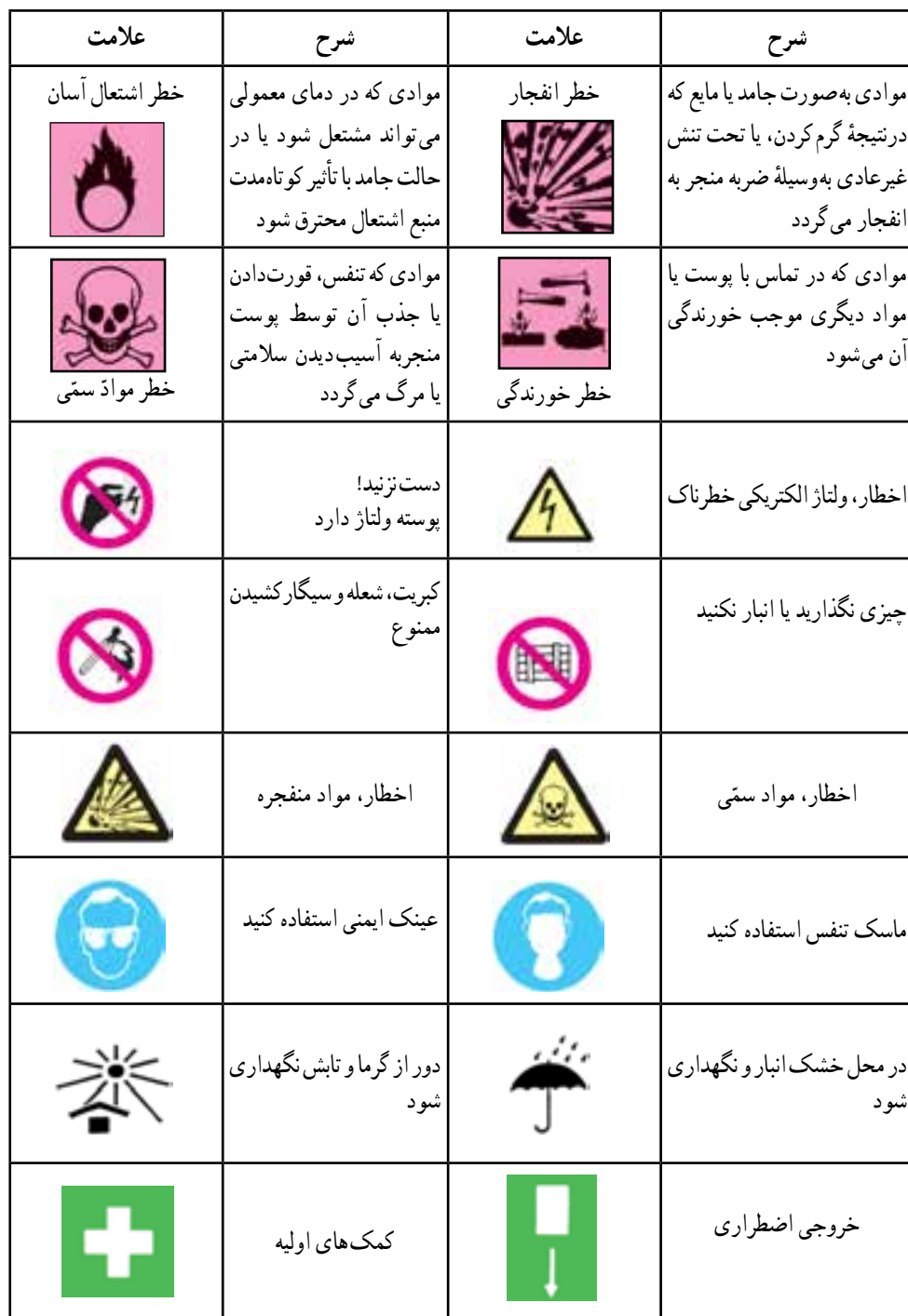
جدول ۱-۵- علائم ایمنی و هشدار دهنده