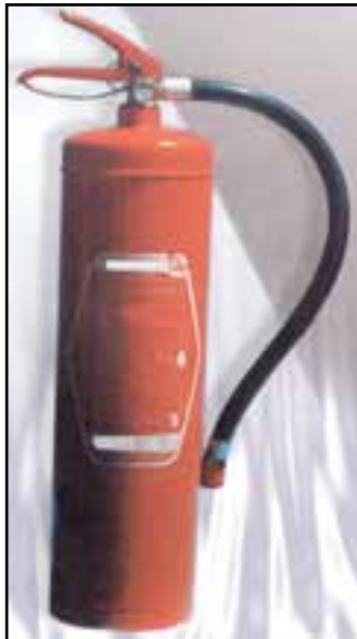
شکل ۱-۵- کپسول دستی خاموش کننده گاز CO 2

تجهیزات آتش نشانی به طور کلی به دو دسته، تجهیزات اطفای حریق و تجهیزات اعلام حریق طبقه بندی می شوند. از تجهیزات اطفای حریق می توان از کپسول های دستی و چرخدار آتش نشانی، لوله ها و شیلنگ های آب آتش نشانی با سر لوله مخصوص نام برد که باید حتماً در چاپخانه به تعداد کافی وجود داشته باشد. همیشه باید از آماده به کار بودن (شارژ بودن) این وسایل مطمئن بود. شکل های ۱-۵ الی ۴-۵ تعدادی از تجهیزات اطفای حریق را نشان می دهد. تمام کارگران شاغل در چاپخانه باید به طور عملی طرز صحیح کار با این وسایل را آموخته و تمرین کرده باشند. همچنین یک نکته حائز اهمیت این است که تمام کارگران و کارکنان شاغل در چاپخانه باید به وظایف خویش هنگام وقوع آتش سوزی های احتمالی آشنا باشند.