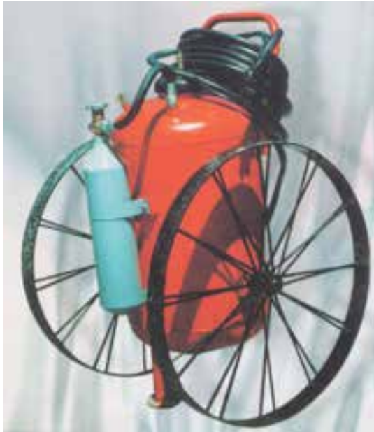
شکل ۳-۵- کپسول خاموش‌کننده چرخ دار