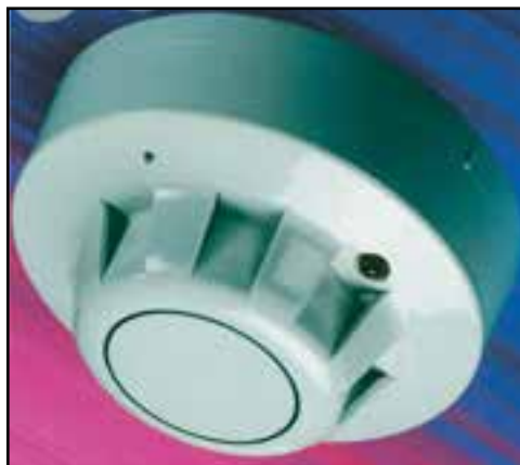
شکل ۵-۶- دستگاه حساس به حرارت

پ - اطلاع دادن به آتش نشانی : بایستی بلادرنگ سازمان آتش نشانی باخبر شده و از آن ها کمک خواسته شود. از این نظر لازم است یکی از کارکنان چاپخانه منحصراً مأمور این کار شده فوراً