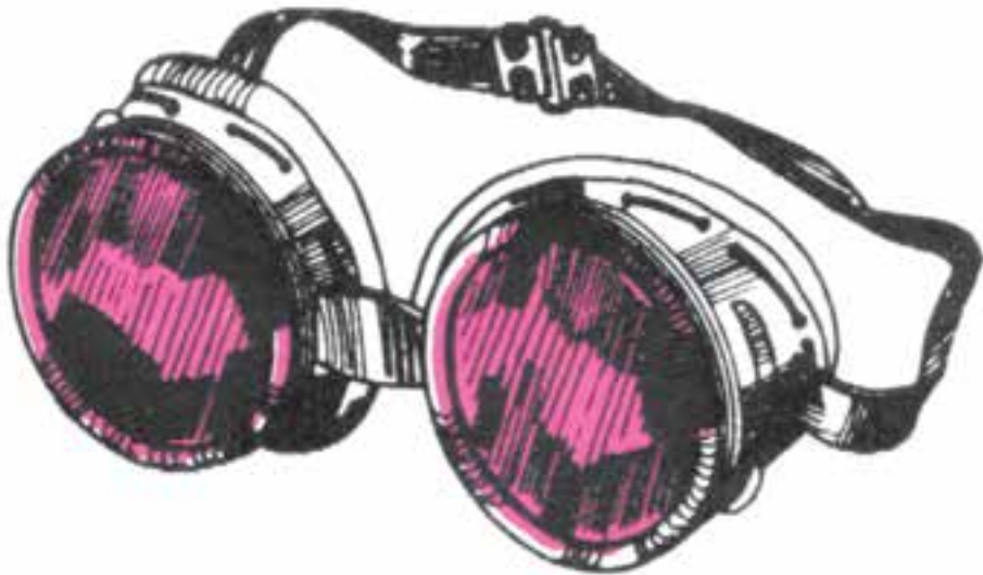
شکل ۲-۴- عینک حفاظتی

اگر اسیدهای مختلف با شتاب با آب مخلوط شوند، مخصوصاً اسید سولفوریک غلیظ، تولید حرارت زیادی می کنند و به جوش می آیند که قطرات آن ها، به ویژه اگر اسید سولفوریک باشد، به اطراف پاشیده می شود و در اثر آن ممکن است قسمت هایی از بدن مثل صورت و دست ها یا نقاط دیگر بدن مجروح گردد. اگر برحسب اتفاق اسید سولفوریک غلیظ بر روی بدن ریخته شود باید فوری آن را با آب فراوان شست و شو داد. توصیه می شود، برای جلوگیری از پاشیده شدن اسید و سایر محلول های خطرناک در هنگام کار از عینک های محافظ پلاستیکی استفاده کنید (شکل ۲-۴).