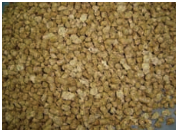
شکل ۸-۹ - کنجاله سویا

به دلیل وجود تعدادی مواد ضد تغذیه‌ای ۱ محدودیت مصرف دارد. هر چند عمل‌آوری با حرارت در حین تولید کنجاله سویا تا حدی از محدودیت مصرف کنجاله سویا می‌کاهد.