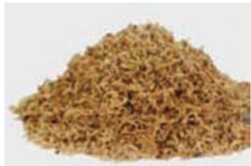
شکل ۴-۸ - تفاله چغندر قند

غذاهای حیوانی : از انواع این غذاها که منشأ حیوانی دارند، می‌توان از شیر و مشتقات آن نام