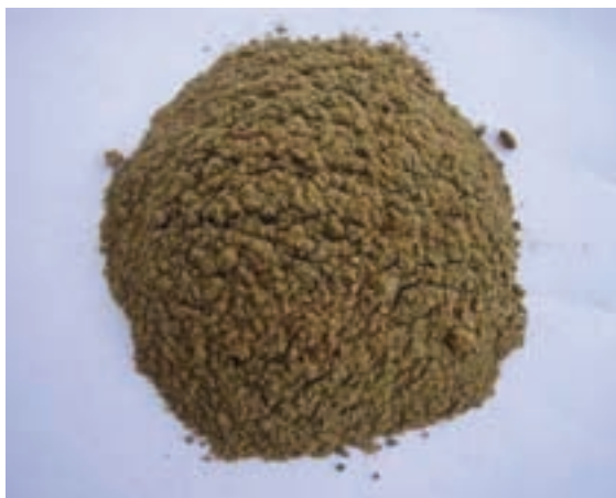
شکل ۱۲-۸ - پودر ماهی

میزان پروتئین پودر ماهی بسته به نوع ماهی از ۶۰ تا ۷۰ درصد متغیر است و از نظر اسید آمینه لیزین و متیونین غنی است. چنانچه از پودر ماهی به میزان زیاد در جیره گاوهای شیری استفاده شود، احتمال اینکه شیر آنها طعم و بوی ماهی بگیرد وجود دارد. همچنین استفاده زیاد آن در طیور باعث ایجاد طعم ماهی در تخم مرغ و گوشت طیور می شود.