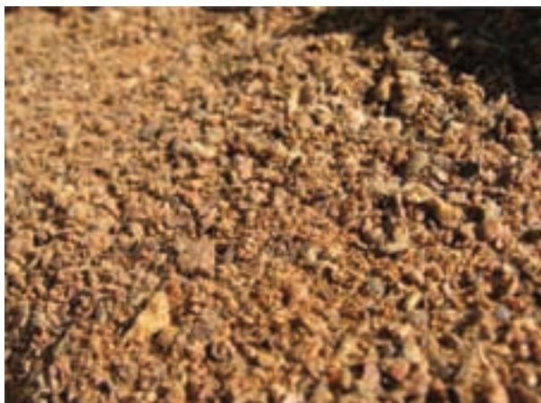
شکل ۱۰-۸ - کنجاله تخم پنبه

کنجاله تخم پنبه حاوی ماده سمی به نام گوسیپول است که مقدار آن به شرایط آب و هوایی، کیفیت خاک و روش روغن‌گیری از تخم پنبه بستگی دارد. گوسیپول می‌تواند در طیور باعث بروز مشکلات هضمی، کاهش خوش‌خوراکی، تغییر رنگ زرده تخم مرغ به سبز زیتونی و کاهش تولید مثل و مسمومیت شود. از این‌رو مصرف کنجاله تخم پنبه محدودیت دارد. استفاده از سولفات آهن و سایر ترکیبات آن، به دلیل ترکیب شدن آهن با گوسیپول، می‌تواند از اثرات سمی کنجاله تخم پنبه بکاهد. حرارت دادن به کنجاله تخم پنبه نیز می‌تواند از میزان گوسیپول آن بکاهد.