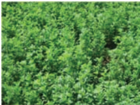
شکل ۸-۱ - یونجه

شبدر : همانند یونجه از خانواده لگومینوز بوده و سه برگی است. شبدر از نظر ترکیب شیمیایی درصد پروتئین بالایی دارد و نیز کربوهیدرات‌های محلول آن زیاد است.