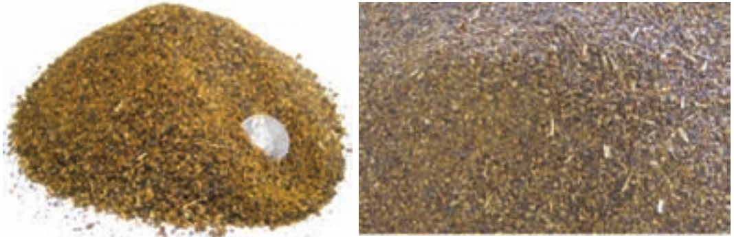
شکل ۱۱-۸- کنجاله کلزا

کنجاله کلزا، می‌تواند باعث ایجاد طعم ماهی و مزه‌های نامطلوب دیگر در تخم مرغ شود. تانن هم به دلیل مقاومت در مقابل آنزیم‌ها، قابلیت هضم آن را کاهش می‌دهد.