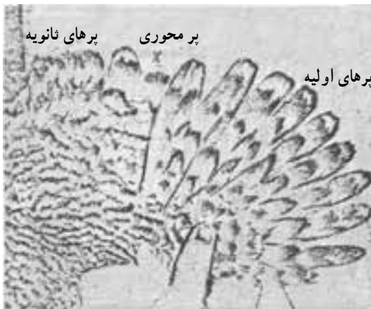
شکل ۳-۴- نمایش انواع پر در بال طیور

— رنگ مرکب : در بعضی نژادها، روی پر، دو یا چند رنگ ساده وجود دارد که به اشکال مختلف پهلوئی یکدیگر قرار گرفته‌اند و رنگ مشخصی را در طیور نشان می‌دهند ؛ مانند : رنگ راه‌راه، نقطه‌ای، موازی و ... (شکل ۳-۳).