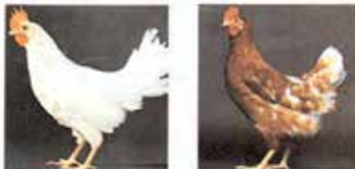
شکل ۷-۲- مرغان تیپ تخمگذار

۲- تیپ تخمگذار: مرغ های تیپ تخمگذار عموماً دارای جثه ای کوچک و ریز و سبک تر از نژادهای گوشتی هستند. بلوغ جنسی در آن ها زودتر بروز می کند. قابلیت و استعداد بیشتر برای تولید تخم مرغ دارند به طوری که برخی از نژادها تا ۳۰۰ عدد تخم در سال می گذارند. از دیگر خصوصیات مرغان این تیپ، این است که دیر کرج می شوند و دوره ی پرریزی (تولک رفتن) آن ها کوتاه است و به علت داشتن جثه ای ریز مصرف غذای آن ها کم است که خود از نظر اقتصادی برای تولید تخم مرغ مورد توجه است. نژادهای لگهورن، مینورکا، آنکونا و هودان، بهترین نژادهای این تیپ هستند (شکل ۷-۲).