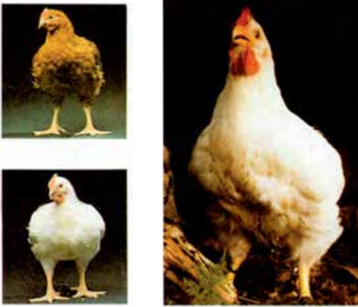
شکل ۶-۲- مرغان تیپ گوشتی

کیفیت گوشت نیز بهتر از نژادهای دیگر است، از نظر تولید تخم مرغ ضعیف هستند. از مهم ترین نژادهای این تیپ می توان نژاد کورنیش، وایت روک، ساسکس و براهما را نام برد (شکل ۶-۲).