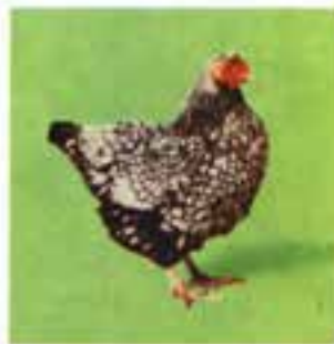
ویندوت خط نقره ای

۳- دسته مرغان آمریکایی ۱ : این دسته از تلاقی مرغان آسیایی و مدیترانه ای به وجود آمده اند. اولین بار در آمریکا پرورش و بعد به سایر نقاط انتقال یافتند. از نظر اقتصادی بسیار مهم و صفات ظاهری آنها تیپ دو منظوره این دسته را نشان می دهد. از این رو برای تولید گوشت از آنها استفاده می شود. علاوه بر این تولید تخم مرغ در آنها نیز نسبتاً بالاست. نژاد پلیموت روک، ویندوت و ردآیلندرد را جزء این دسته می توان نام برد (شکل ۲-۴).