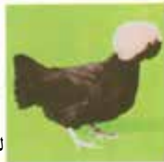
لهستانی سیاه تاج سفید

— گروه زینتی: این گروه دارای رنگ‌های مختلف و زیبایی خاصی هستند معروف‌ترین آن‌ها، مرغ‌های سیاه، کاکل سفید لهستانی — نژاد بارون ولدر که در آلمان و هلند دیده می‌شوند و نژاد فریزل ۱ که دارای پر فرفری هستند و مرغ‌های سیلکی که پر آن‌ها ظریف و ابریشمی است (شکل ۹-۲).