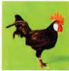
مینورکای سیاه (خروس)