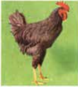
پلیموت روک خطدار

۳- تیپ دو منظوره : نژادهای دو منظوره هم از لحاظ تولید گوشت و هم از نظر تولید تخم مرغ قابل توجه هستند. در نژادهای دو منظوره پس از بلوغ جنسی تولید تخم مرغ آن‌ها خوب و در پایان دوره تخمگذاری وزن آن‌ها نیز مناسب است که می‌توان گوشت آن‌ها را در بازار به فروش رساند. مهم‌ترین آن‌ها نیوهمشایر، پلیموت روک و ردآیلندرد هستند.