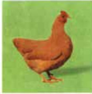
پلیموت روک نخودی