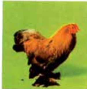
براهمای نقره ای