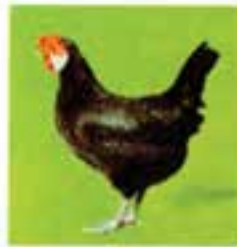
مینورکای سیاه (مرغ)