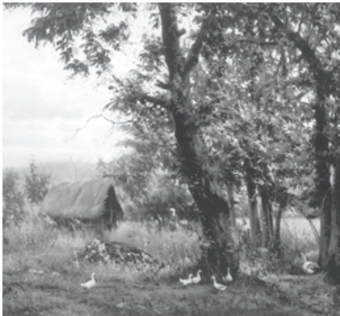
نقاشی آبرنگ اثر: رحیم نوه‌سی