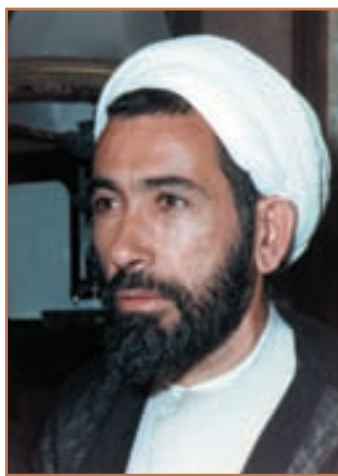
شهید دکتر محمد جواد باهنر