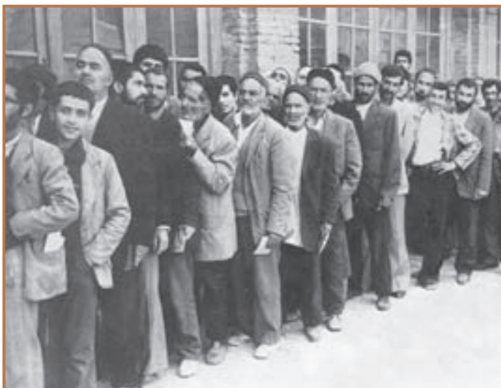
استقبال مردم از همه‌پرسی جمهوری اسلامی ایران

در تاریخ ۱۳ آبان ۱۳۵۸ سفارت آمریکا توسط دانشجویان پیرو خط امام تسخیر شد اما مهندس بازرگان که از این اقدام ناخشنود بود، استعفا کرد و امام (ره) نیز استعفای وی را پذیرفت. دانشجویان تداوم دشمنی دولت آمریکا با انقلاب اسلامی، ورود محمدرضا شاه به آمریکا و افزایش دخالت سفیر و سایر مأموران سفارت آمریکا در امور داخلی ایران را از دلایل تسخیر سفارت آن کشور اعلام کردند و پس از آن سفارت آمریکا در تهران، لانه جاسوسی نامیده شد. امام خمینی (ره) این حرکت دانشجویان