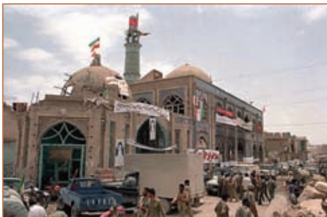
خرمشهر پس از آزادی از اسارت دشمن

آنها فتح‌المبین ۱ و بیت‌المقدس ۲ بودند، صدها کیلومتر مربع از خاک ایران را از اشغال ارتش بعثی آزاد کردند. اوج حماسه شجاعت و رشادت ملت ایران در دوران دفاع مقدس، روز سوم خرداد ۱۳۶۱ در عملیات بیت‌المقدس تجلی یافت. روزی که رزمندگان ایران با درایت و شجاعت خود خرمشهر عزیز را از اشغال دشمنی که بر روی دیوار خرابه‌های آن نوشته بود «ما آمده‌ایم تا بمانیم»، آزاد کردند.