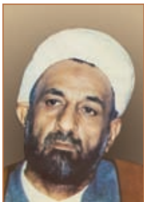
شهید آیت الله قدوسی

چهار تن از وزیران کابینه و بیست و هفت نماینده مجلس شورای اسلامی در میان آنها بودند، به شهادت رسیدند. در ادامه آیت الله قدوسی دادستان کل کشور و امامان جمعه چندین شهر؛ آیت الله مدنی، آیت الله دستغیب، آیت الله صدوقی و آیت الله اشرفی اصفهانی توسط مجاهدین خلق به شهادت رسیدند. افزون بر مسئولان نظام، هزاران نفر از مردم عادی نیز به دست افراد آن سازمان ترور و به شهادت رسیدند.