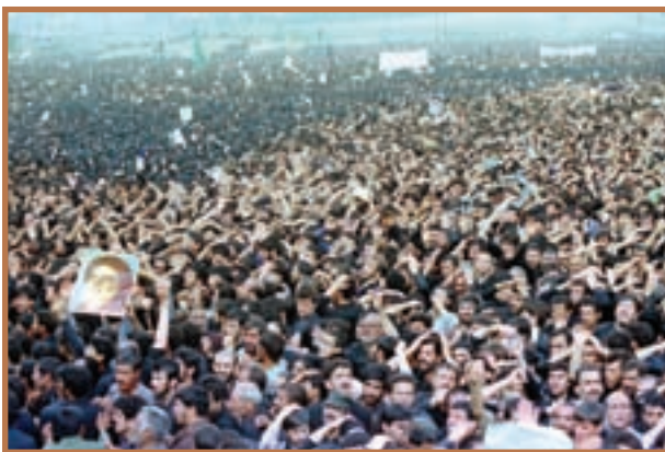
وداع باشکوه ملت با امام و رهبر خویش

امام خمینی (ره) در شامگاه ۱۳ خرداد ۱۳۶۸ بعد از یک دوره بیماری در ۸۷ سالگی دارفانی را وداع کرد و به دیدار حق شتافت. خبر ارتحال امام صبح روز بعد توسط حجت‌الاسلام والمسلمین سید احمد خمینی فرزند انقلابی ایشان به اطلاع مردم ایران و مسلمانان جهان رسید.