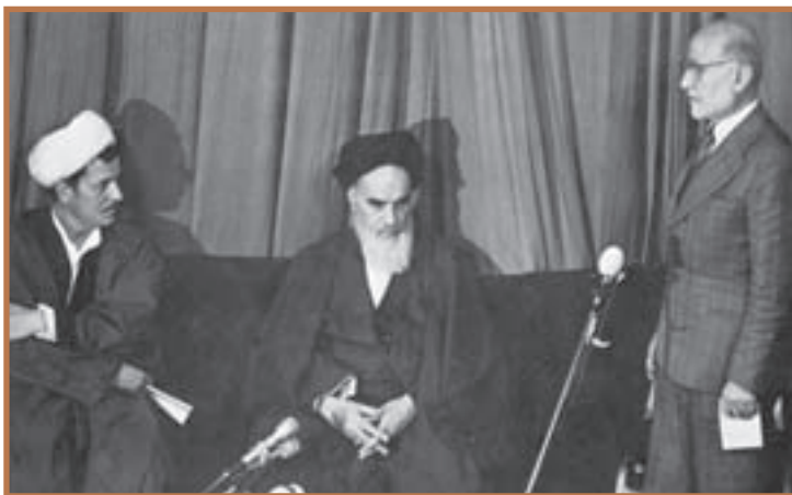
مراسم تنفیذ حکم بازرگان