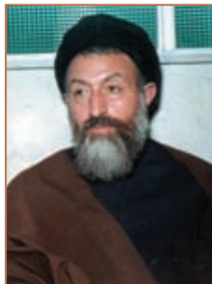
شهید آیت الله بهشتی

۳- حمله نظامی آمریکا به ایران : تسخیر سفارت آمریکا در تهران و دستگیری و بازداشت مأموران آمریکایی در ایران، دولت آمریکا را در شرایط نامناسبی قرار داد. از این رو در اردیبهشت ۱۳۵۹، آمریکا با طراحی یک عملیات پیچیده نظامی، اقدام به پیاده کردن نیروی نظامی در صحرای طبرستان کرد. مأموریت این گروه زبده نظامی تسخیر چند مرکز در تهران و بیرون بردن آمریکاییان بازداشتی از ایران بود. اما با عنایت خداوند، طوفان شن و کاهش دید خلبانان آمریکایی باعث سقوط چند فروند بالگرد نظامی و کشته شدن تعدادی از نیروهای مهاجم شد. بقیه نیز با به جای گذاشتن اسناد و مدارک مجبور به فرار شدند. ۱