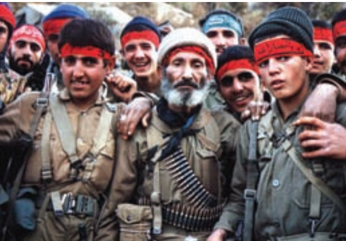
بیر و جوان بسیجی مصمم در دفاع از ایران زمین

بیشترین حضور مردمی در صحنه‌های نبرد در قالب نیروهای بسیجی و جهاد سازندگی انجام می‌گرفت. نیروهای مردمی در کنار دیگر نیروهای نظامی کمک فراوانی در پیشبرد جنگ و کسب پیروزی در نبردهای زمینی داشتند.