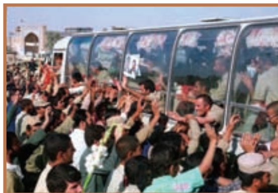
بازگشت آزادگان به میهن اسلامی

در سال ۱۳۷۰ ش. نیز سازمان ملل متحد رسماً، صدام رئیس رژیم بعثی عراق را به عنوان متجاوز و آغازکننده جنگ معرفی کرد. به این ترتیب جنگ هشت ساله‌ای که صدام به منظور سرنگونی جمهوری اسلامی آغاز کرده بود، با شکست مفتضحانه خود او به پایان رسید.