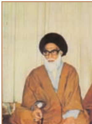
شهید آیت الله دستغیب