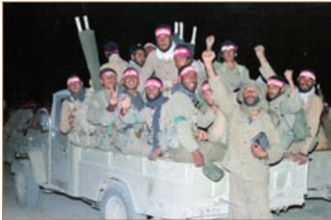
شور و صلابت در دفاع از میهن اسلامی