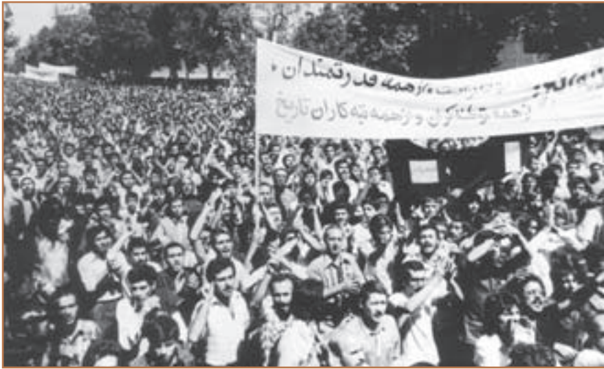
تظاهرات مردم تهران در شهریور ۱۳۵۷