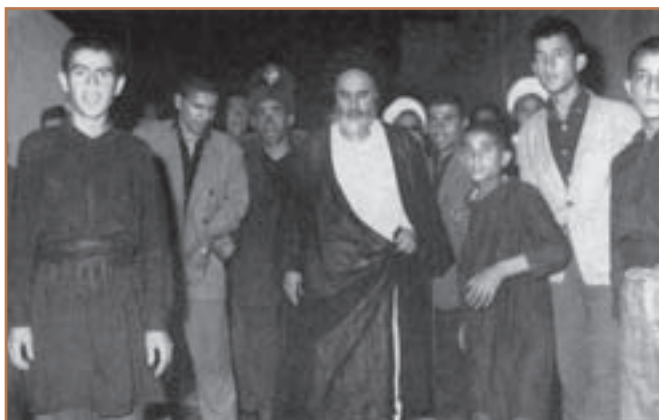
شرکت امام خمینی در هیئت‌های عزاداری قم (محرم ۱۳۸۳ ق. / ۱۳۴۲ ش)

در آستانه ماه محرم ۱۳۴۲ ش. امام خمینی (ره) در رهنمودهای خود به سخنرانان مذهبی سفارش کردند که خطر اسرائیل را به مردم تذکر دهید و در مراسم نوحه‌خوانی و سینه‌زنی از مصیبت‌های وارد شده به اسلام و مراکز دینی یاد کنید.