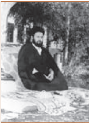
حاج آقا مصطفی خمینی

درگذشت ناگهانی حاج آقا مصطفی پسر بزرگ امام خمینی در نجف در آبان ۱۳۵۶ نیز موج تازه‌ای از اعتراض و تنفر را نسبت به رژیم پهلوی در اذهان عمومی ایجاد کرد. حاج مصطفی روحانی دانشمند و مبارزی بود که از آغاز مبارزه امام خمینی در کنار پدر بود. با مرگ مشکوک وی، مجالس ترحیم در بسیاری از شهرهای ایران برگزار شد و بار دیگر یاد و خاطره امام خمینی جان تازه‌ای به جریان مبارزه علیه طاغوت زمان داد. رهبر انقلاب نیز به مناسبت درگذشت فرزند خویش سخنرانی کردند و مرگ او را از الطاف خفیه الهی دانستند و دو قشر روحانی و دانشگاهی را به وحدت دعوت نمودند.