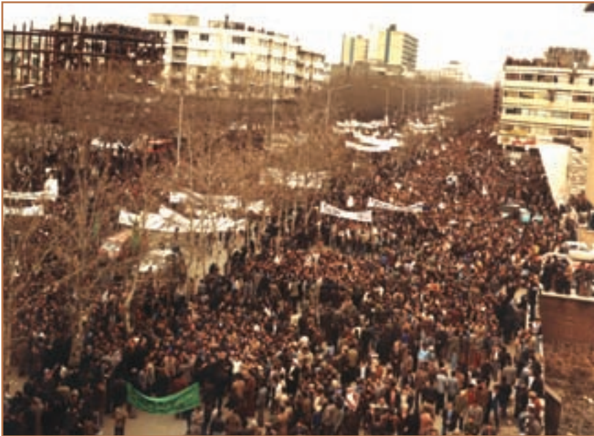
راهپیمایی میلیونی مردم تهران در تاسوعای ۱۳۵۷