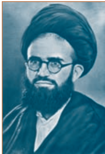
شهید آیت‌الله سعیدی

اقدامات سرکوبگرانه ساواک تنها محدود به گروه‌ها و افرادی که مبارزه مسلحانه می‌کردند، نبود. بلکه بسیاری از مبارزان دیگر نیز حبس و شکنجه شدند و تعدادی از آنها مانند آیت‌الله سعیدی و آیت‌الله غفاری در زندان و تحت شکنجه به شهادت رسیدند و بسیاری نیز تا پیروزی انقلاب اسلامی در زندان بودند.