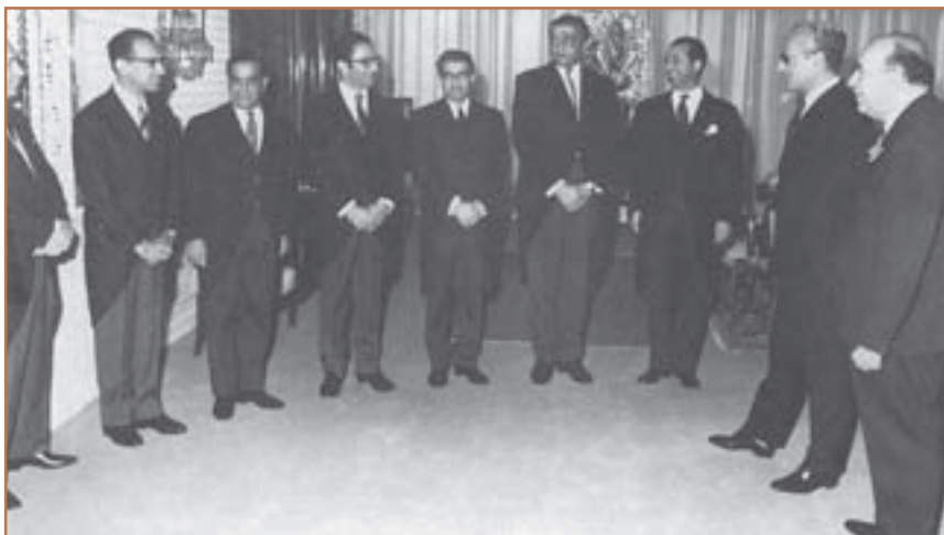
امیرعباس هویدا در حال معرفی اعضای کابینه به شاه

ب) مبارزه فرهنگی: مبارزه فرهنگی با اتکا بر آگاهی دادن به مردم و تبلیغ و ترویج باورهای دینی به همراه روشنگری علیه اقدامات رژیم پهلوی، صورت می‌گرفت. امام خمینی به عنوان مرجع دینی و رهبر مبارزات اسلامی، الگوی عینی همه مبارزانی بودند که برای سرنگونی حکومت مبارزه می‌کردند. روحانیون، معلمان، استادان دانشگاه، دانشجویان و دانش‌آموزان در عرصه مبارزه فرهنگی با رژیم مشارکت فعال داشتند. اینان در مراکزی مانند مساجد، حسینیه‌ها و مدارس و دانشگاه‌ها به تبلیغ و ترویج فرهنگ دینی می‌پرداختند.