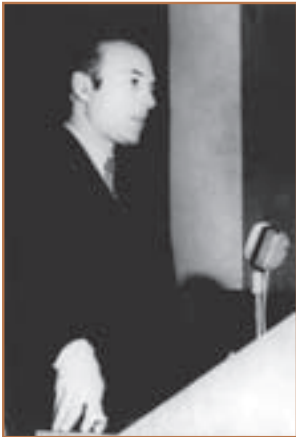
دکتر علی شریعتی

در خرداد ۱۳۵۶ دکتر علی شریعتی به‌طور ناگهانی و غیرمنتظره در لندن درگذشت. مرگ او بر اوضاع ایران در سال ۱۳۵۶ تأثیر گذاشت. دکتر شریعتی با انجام سخنرانی و نگارش کتاب‌های متعدد، نقش فراوانی در طرد افکار مارکسیستی و بیداری نسل جوان و گرایش آنان به سوی اسلام و ارزش‌های اسلامی داشت. مردم مرگ او را به عمال ساواک نسبت دادند و با گرامی داشت نام و یاد او، تنفر بیشتری به عمال رژیم پهلوی پیدا کردند.