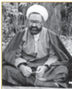
استاد شهید مرتضی مطهری