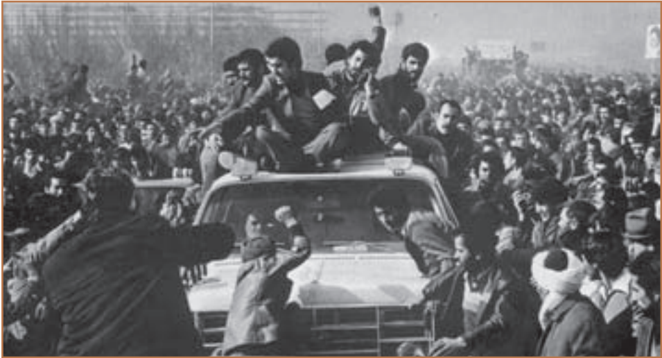
استقبال باشکوه از امام خمینی به هنگام ورود به میهن اسلامی

می‌زنم.» سپس در ۱۵ بهمن ۱۳۵۷ به پیشنهاد شورای انقلاب، آقای مهندس مهدی بازرگان را به عنوان اولین نخست‌وزیر دولت موقت انقلاب معرفی کرد و از همه تقاضا کرد تا از وی حمایت کنند. مردم نیز با برپایی راهپیمایی اقدام رهبر خویش را با جان و دل پذیرفتند. ۱