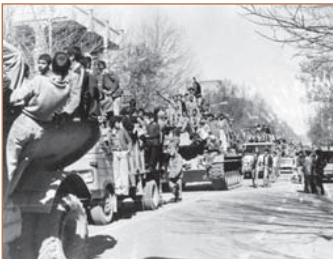
شادی مردم در روز پیروزی انقلاب