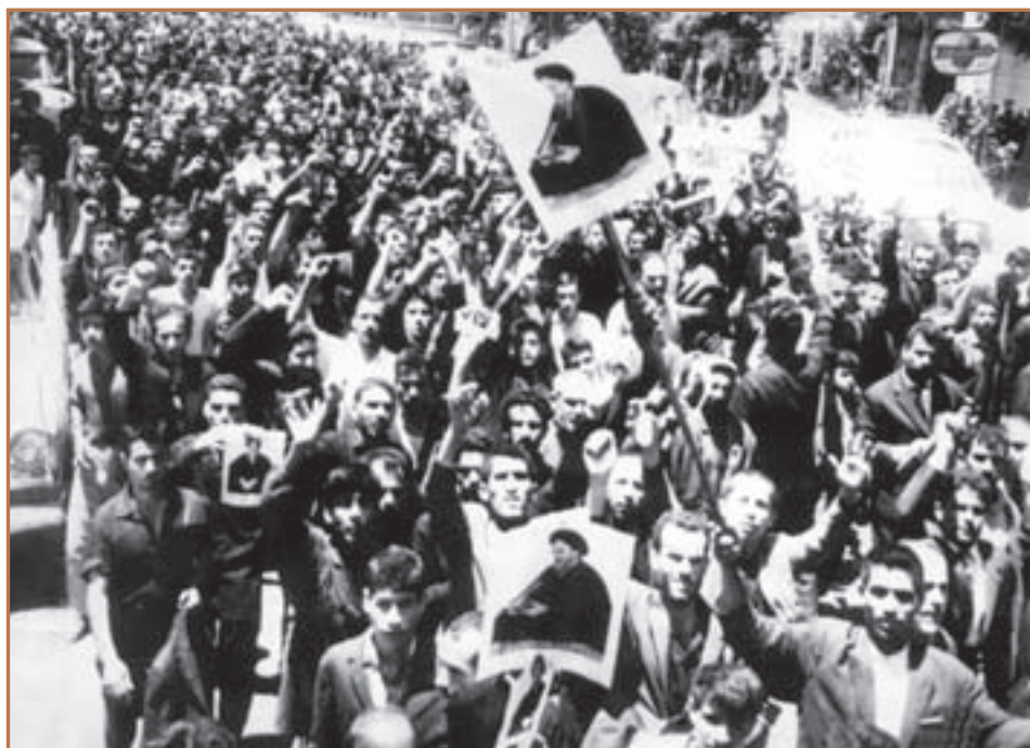
قیام مردم تهران در ۱۵ خرداد ۱۳۴۲

در تهران نیز مردم با شنیدن خبر دستگیری امام، آماده قیام و حرکت شدند و اقشار مختلف اجتماعی با فریاد «یا مرگ یا خمینی» و «مرگ بر شاه» اعتراض خود را نسبت به این موضوع ابراز داشتند. در اثر هجوم نیروهای نظامی و امنیتی رژیم به تظاهرکنندگان تعدادی از مردم انقلابی تهران به خاک و خون کشیده شدند. مردم مسلمان و رامن نیز با شنیدن خبر دستگیری امام کفن پوشیدند و به سوی تهران حرکت کردند اما با یورش مأموران حکومتی تعدادی از آنها شهید و مجروح شدند. در دیگر شهرها از جمله شیراز، اصفهان و مشهد نیز تظاهراتی در اعتراض به دستگیری امام برپا شد. در نتیجه قیام پانزده خرداد، علاوه بر آنکه جمع زیادی شهید و مجروح شدند، تعداد زیادی از مبارزان دستگیر و اعدام، زندان و یا تبعید محکوم گردیدند.