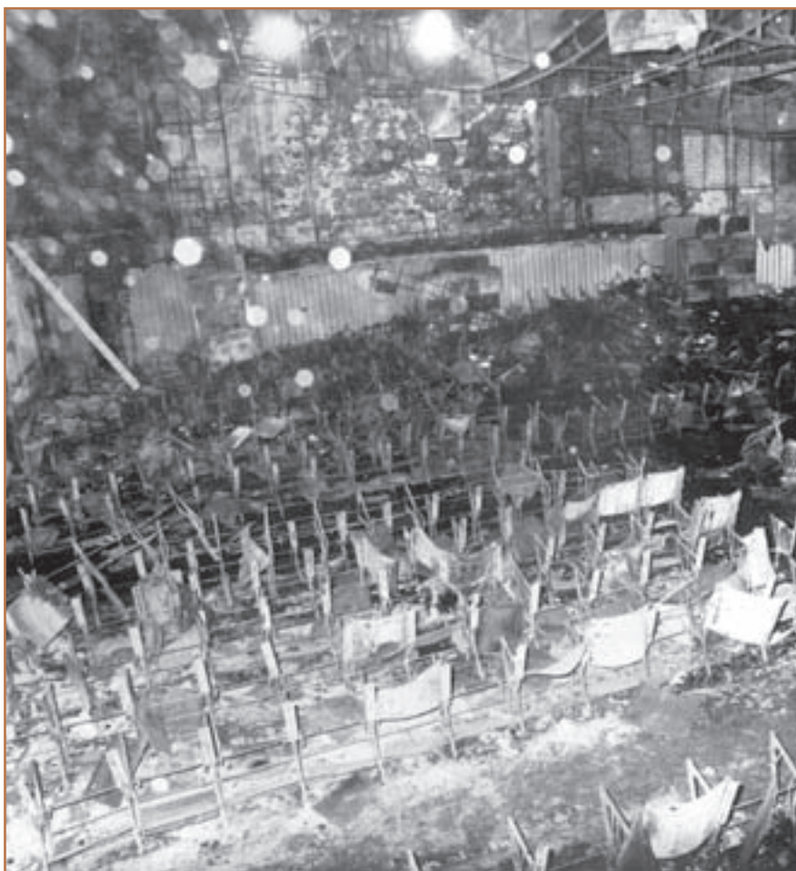
آثار بازمانده از جنایت سینما رکس