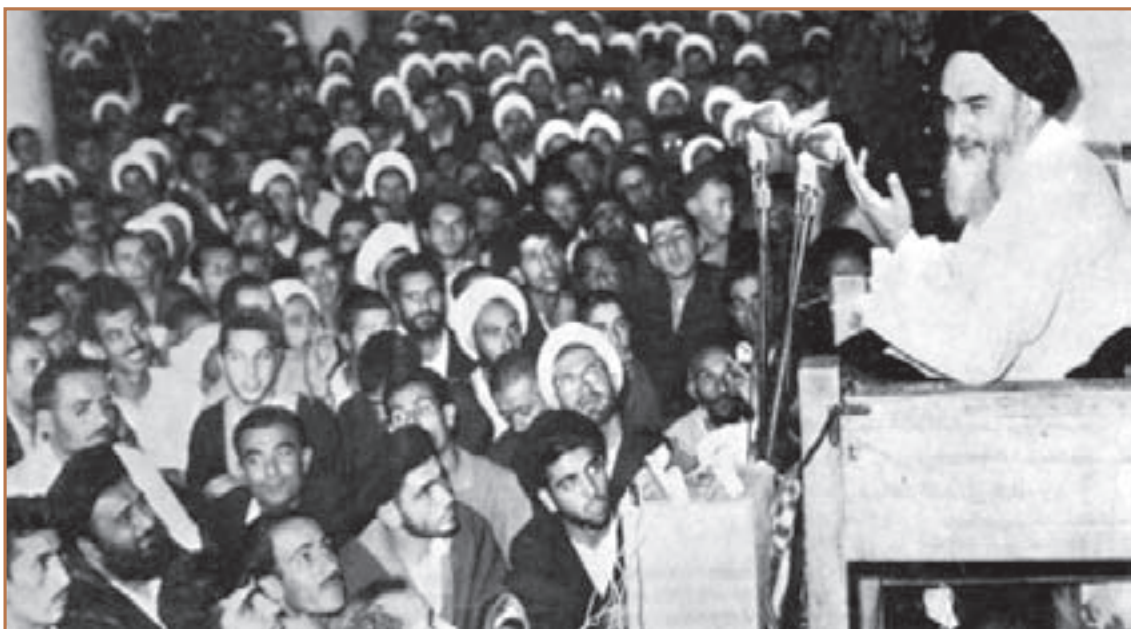
امام خمینی (ره) در حال سخنرانی در مدرسه فیضیه قم

امام خمینی نیز علی‌رغم محدودیت‌های عمل پهلوی برای ایشان، در عصر روز عاشورا در قم به منبر رفت و در نطق تاریخی خود مستقیماً شاه را مورد خطاب قرار داد و با شجاعت تمام به افشاگری علیه خاندان پهلوی و سیطره آمریکا و اسرائیل بر ایران پرداخت. این سخنان عاشورایی چنان محمدرضا شاه و عمالش را خشمگین کرد که دستور دستگیری امام و انتقال ایشان را به تهران صادر کرد.