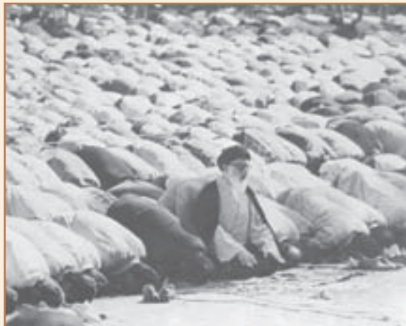
نخستین نماز جمعه تهران پس از پیروزی انقلاب اسلامی

آیت‌الله طالقانی در سال ۱۲۸۹ ش. در روستای گَیِرِدِ ن طالقان متولد شد. ابتدا او را به مکتب‌خانه روستا فرستادند. در سال ۱۲۹۸ ش. همراه پدر به تهران رفت. دو سال بعد برای ادامه تحصیل به قم رفت. در ۱۳۱۰ ش. به نجف اشرف رفت و پس از کسب علوم دینی از علمای بزرگ نجف از سوی آیت‌الله اصفهانی به‌عنوان مجتهد علوم دینی معرفی شد. سپس به ایران بازگشت. در قم از آیت‌الله شیخ عبدالکریم حائری درجه اجتهاد گرفت. در سال ۱۳۱۸ ش. به دلیل مبارزه علیه حکومت رضاشاه دستگیر شد و مدتی را در زندان گذراند. در ۱۳۲۷ ش. فعالیت‌های خود را در مسجد هدایت تهران آغاز کرد. خیلی زود مسجد هدایت کانون توجه جوانان مسلمان و مبارزان شد. در ۱۳۳۴ ش. به نهضت مقاومت ملی که از سوی جمعی از استادان دانشگاه برای مبارزه با رژیم پهلوی به وجود آمده بود، پیوست. در سال‌های پس از کودتا که فدائیان اسلام به شدت مورد تعقیب مأموران رژیم بودند، آیت‌الله طالقانی با وجود خطرات این کار به نواب صفوی و یارانش پناه داد و آنان را پنهان کرد تا به دست مأموران رژیم نیفتند. در ۱۳۳۸ ش. از طرف آیت‌الله بروجردی مرجع شیعیان، برای شرکت در کنگره اسلامی عازم مصر شد. در آنجا با شیخ شلتوت رئیس دانشگاه الازهر و جمال عبدالناصر، رئیس‌جمهور مصر، ملاقات کرد. در بازگشت به منظور تبادل نظر و تحلیل