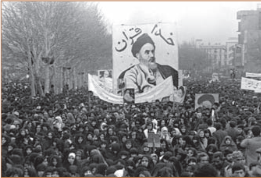
حضور گسترده زنان ایرانی در تظاهرات

لیکن امام خمینی با ارسال پیام و افشای نیرنگ تازه رژیم پهلوی، خواهان ادامه مبارزه تا سرنگونی نظام پادشاهی در ایران شد. به همین جهت تظاهرات مردمی در شهرهای ایران ادامه پیدا کرد؛ اوج این راهپیمایی‌ها در تهران بعد از برگزاری عید فطر (۱۳ شهریور) و تکرار آن در سه روز بعد با حضور گسترده و یکپارچه زنان مسلمان بود.