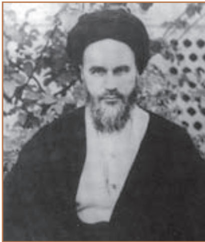
امام خمینی رهبر نهضت اسلامی ایران

۱- مخالفت با تصویب‌نامه انجمن‌های ایالتی و ولایتی: اولین فعالیت سیاسی