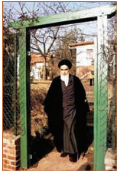
حضرت امام خمینی در نوفل‌لوشاتو

۲- امکان ملاقات مبارزان با رهبری انقلاب فراهم و پیام‌ها و بیانات امام با شتاب بیشتری در ایران منتشر شد.