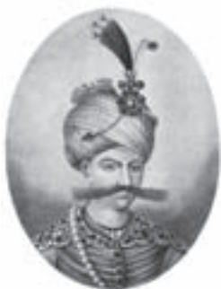
شاه عباس اول صفوی