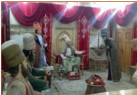
دربار کریم خان زند

کریم خان یکی از افراد ایل زند بود که بعد از یک دوره بیست ساله جنگ و گریز بر دیگر مدعیان