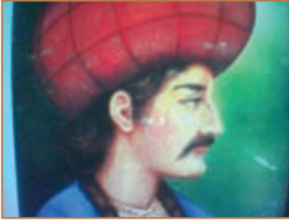
شاه اسماعیل اول صفوی

اگرچه نخستین کوشش‌های سیاسی و نظامی صفویان به بهای قتل شیخ جنید، شیخ حیدر و شماری از مریدان آنان در صحنه جنگ انجامید، اما تجربه خوبی برای نهضت صفوی در راه کسب قدرت سیاسی بود. اندکی بعد، قزلباشان، به دور اسماعیل فرزند شیخ حیدر گرد آمدند. آنان پس از پیروزی در چند جنگ مهم، تبریز پایتخت آق‌قویونلو را تصرف کردند و اسماعیل در آنجا به تخت نشست و به‌طور رسمی سلسله صفوی را تأسیس کرد.