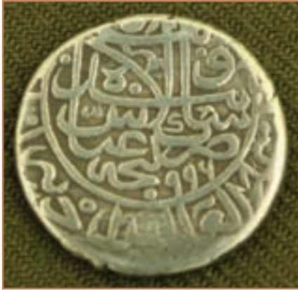
سکه دوره شاه عباس

۴- بهبود اوضاع اجتماعی، اقتصادی و فرهنگی از طریق ایجاد امنیت، آرامش و ثبات سیاسی؛