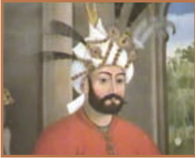
شاه تهماسب اول صفوی

شاه تهماسب به تدریج زمام قدرت را به دست گرفت و به خودسری سران قزلباش پایان داد. او همچنین از بکان را شکست داد و با اتخاذ تدابیر مناسب، مانع موفقیت سپاه عثمانی در هجوم‌های مکرر به قلمرو ایران شد. ۱ در نتیجه چنین تدابیری بود که امپراتور عثمانی دست از جنگ برداشت و با انعقاد قرارداد آماسیه، برای مدتی میان دو کشور صلح برقرار شد. بدین‌گونه شاه تهماسب توانست با اتخاذ تدابیر