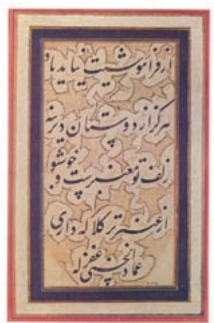
نمونه‌ای از خط میرعماد خوشنویس دورهٔ صفوی

در عصر صفوی، هنر ایرانی نیز رونق و شکوفایی یافت. معماری از جلوه‌های اصلی هنر آن دوره بود. ساخت کاخ‌ها، پل‌ها، کاروانسراها، مدارس، مساجد، مقبره‌ها، کلیساها و باغ‌ها نه تنها به عمران و آبادانی کشور کمک کرد، بلکه سبک و شیوهٔ جدیدی در هنر معماری پدید آورد. اوج شکوفایی معماری صفوی در اصفهان، پایتخت صفویان متجلی شد و خاطره و شکوه شهرهایی چون تخت جمشید، تیسفون و سمرقند را زنده کرد. هنر نقاشی نیز مورد حمایت جدی دربار صفوی بود. در آن دوره، هنرمندان برجسته‌ای نظیر کمال‌الدین بهزاد، رضا عباسی و میرعماد پرورش یافتند و آثار ارزنده‌ای در رشته‌های مختلف هنری خلق کردند. هنرهای کتاب‌سازی، جلدسازی، تذهیب، خطاطی، خوشنویسی، سفال‌سازی، فلزکاری، فرش‌بافی نیز از دیگر هنرهای بودند که در عصر صفوی رونق بسزایی داشتند.