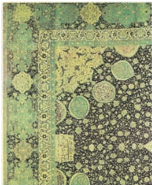
قالی اردبیل مربوط به دورهٔ صفوی