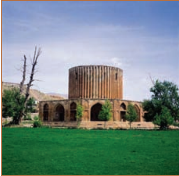
کاخ نادر در کلات مشهد