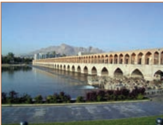
سی و سه پل اصفهان

صفویان وراث میراث غنی فکری و فرهنگی گذشته ایران بودند. وجود امنیت و ثبات سیاسی، بهبود اوضاع اقتصادی به ویژه در عصر شاه عباس اول، و نیز حمایت مادی و معنوی شاهان و حاکمان از عالمان، دانشمندان و هنرمندان، زمینه و شرایط لازم را برای شکوفایی علم و هنر در آن دوره فراهم آورد.