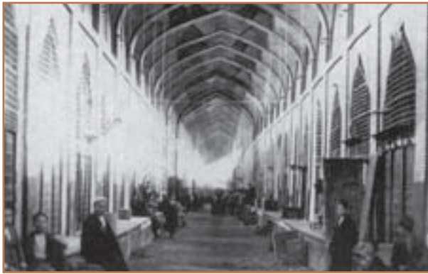
بازار وکیل - شیراز

بی مهری نادرشاه نسبت به عالمان شیعه و هنرمندان، باعث مهاجرت گسترده آنان به عتبات عالیات و هند، و در نتیجه رکود فعالیت‌های علمی و فرهنگی شد. مرگ نادر و ستیز افراد و گروه‌های مختلف برای رسیدن به قدرت، نیز اوضاع سیاسی و اجتماعی و اقتصادی ایران را آشفته‌تر کرد. آرامش، امنیت و ثبات نسبی که در دوران کریم‌خان زند بر بخش‌هایی از ایران حکمفرما گردید، موجب شد که اوضاع اجتماعی، اقتصادی و فرهنگی کمی بهتر شود. بر اثر حمایت و تشویق کریم‌خان، فعالیت‌های عمرانی، کشاورزی و بازرگانی تا حدودی رونق یافت. گروهی از عالمان و هنرمندان مهاجر، به ایران بازگشتند و شهرهای شیراز و اصفهان بار دیگر کانون علم و ادب و هنر شدند.