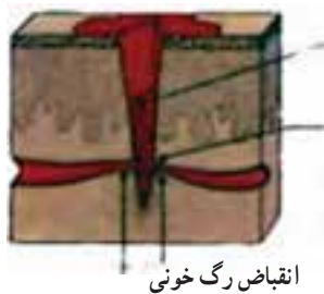
انقباض رگ خونی

این که بدن شما می‌تواند به‌طور خودکار باعث کنترل خونریزی شود یا نه بستگی به مکان و شدت جراحات دارد. به‌طور کلی بدن از دو طریق سعی در کنترل خونریزی دارد.