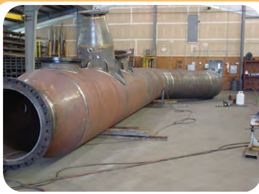
ج) کارگاه ساخت تجهیزات صنعتی