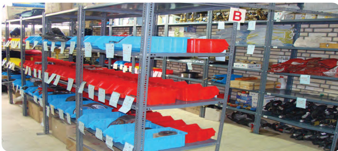
انبار ابزار و لوازم یدکی