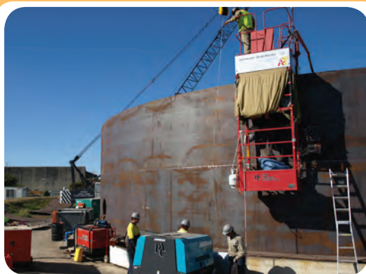
م) کارگاه ساخت مخازن ذخیره

نمونه ای از کارگاه‌های جوشکاری تجهیز شده برای ساخت سازه‌های صنعتی