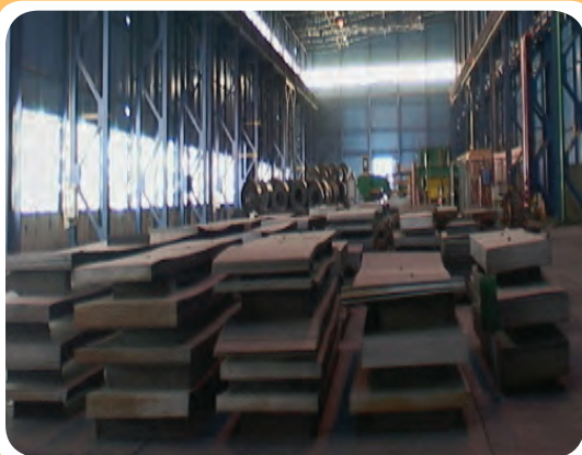
ج) انبار نگه‌داری انواع ورق فولادی