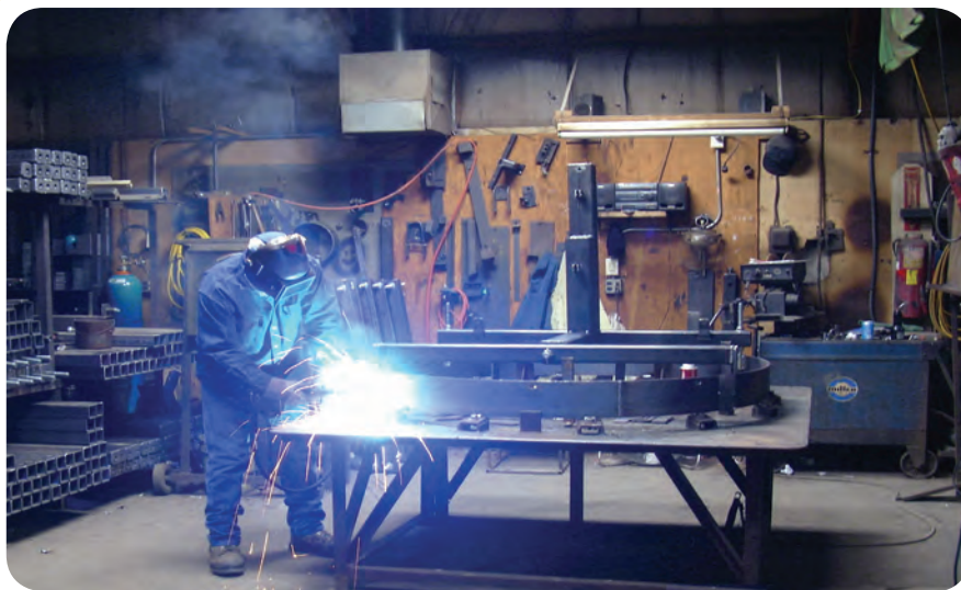
بخشی از فضای داخل کارگاه جوشکاری ساخت

فضای کارگاه جوشکاری به طور معمول سرپوشیده است ولی گاهی به دلیل شرایط اجرایی مثل: مشکل حمل و نقل سازه‌های بزرگ صنعتی بخشی از فعالیت‌های جوشکاری و یا تمام آن در محل نصب سازه‌ها (سایت) صورت می‌پذیرد.