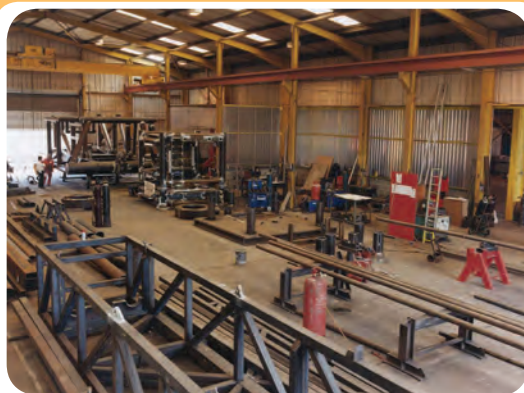
الف) کارگاه ساخت سازه‌های ساختمانی