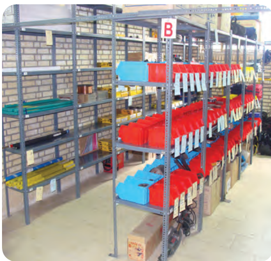
انبار مواد مصرفی جوشکاری