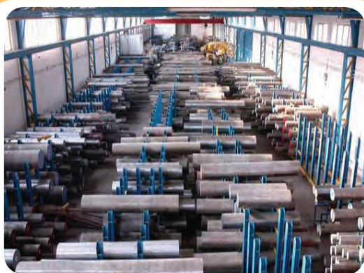
الف) انبار ذخیره لوله و پروفیل های گرد فولادی