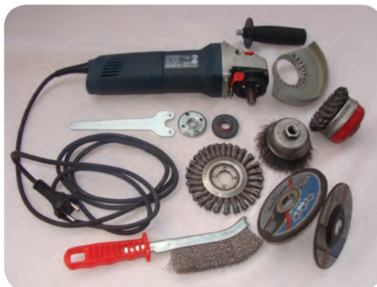
ب) دستگاه‌های آماده سازی و ماشین کاری نظیر: تراش، فرز، دریل، سنگ زنی، پرس کاری و پخ کاری