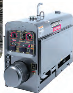
ج) دستگاه‌های جوشکاری نظیر: رکتیفایر، ترانس، دینام و موتور جوش ادامه- برخی از دستگاه‌های موجود در کارگاه‌های جوشکاری