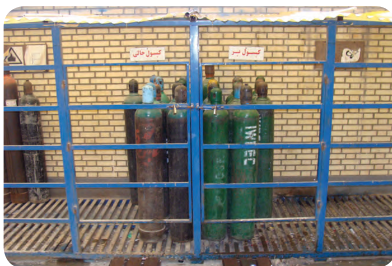
محل نگهداری کپسول‌های گاز محافظ