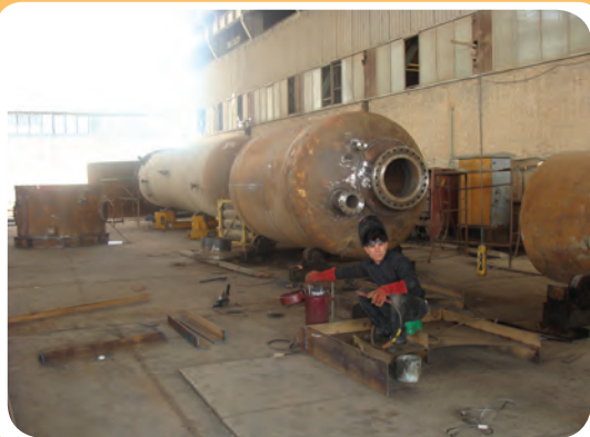
ب) کارگاه ساخت مخازن تحت فشار