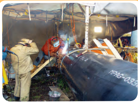
ن) کارگاه ساخت خط لوله