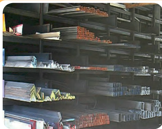
ب) انبار ذخیره انواع پروفیل فولادی