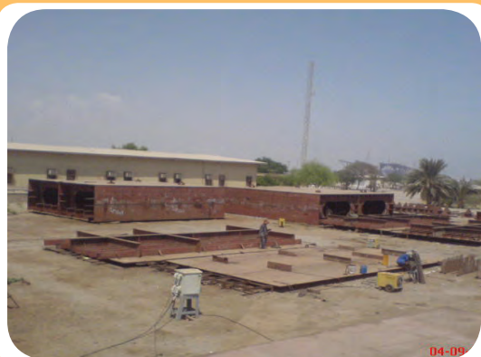
د) کارگاه ساخت اسکلت فلزی ساختمان