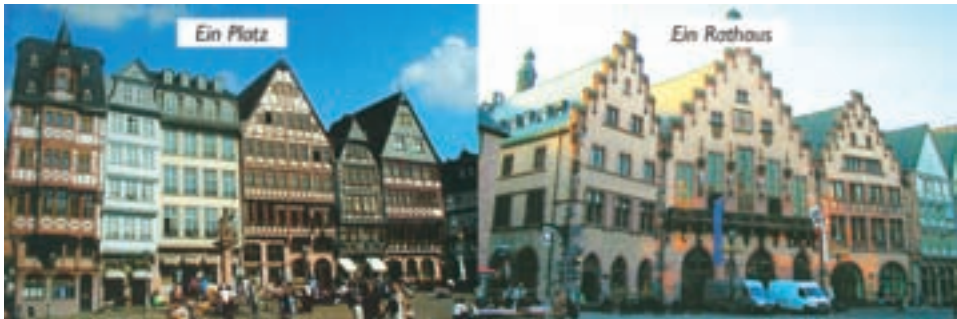
Einige Bilder aus Deutschland