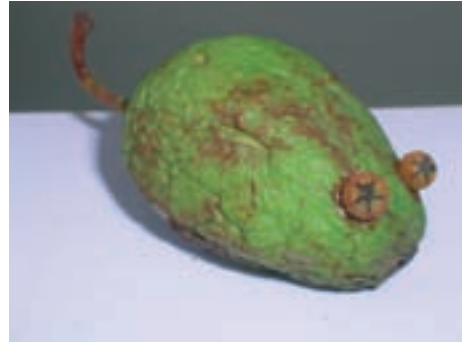
نمونه‌هایی از شکل‌سازی با مواد موجود در طبیعت