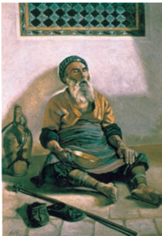
تصویر ۶۷-۲- سقای خسته، اثر رسام ارژنگی، رنگ روغن روی بوم، ۱۳۰۱ ه.ش.