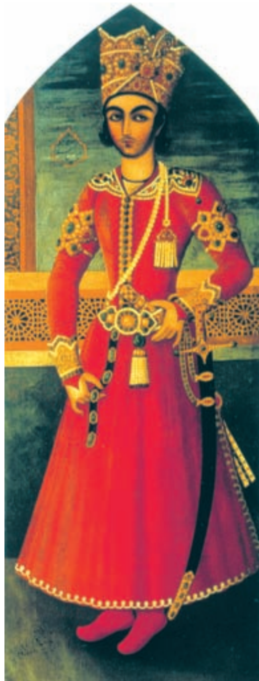
تصویر ۵۶-۲- چهره‌ی عباس میرزا، اثر عبدالله خان، رنگ روغن روی بوم، حدود ۱۲۴۰ هـ.ق