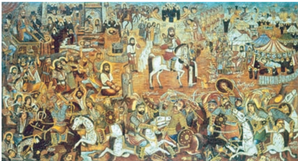
تصویر ۲-۷۱- مصیبت کربلا، اثر حسین قولر آقاسی، رنگ روغن روی بوم، حدود ۱۳۳۰ ه.ش.