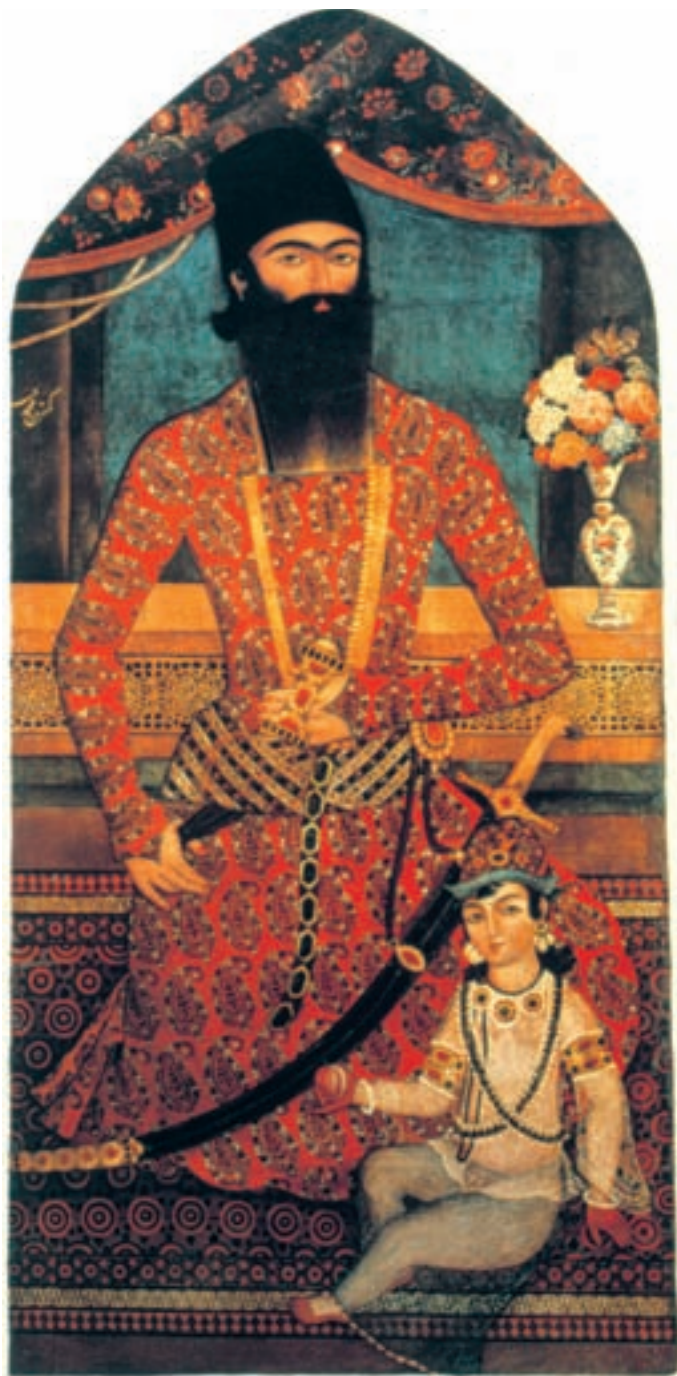
تصویر ۵۷-۲- شاهزاده‌ی قاجار، اثر محمد حسن افشار، رنگ روغن روی بوم، حدود ۱۲۴۰ هـ.ق