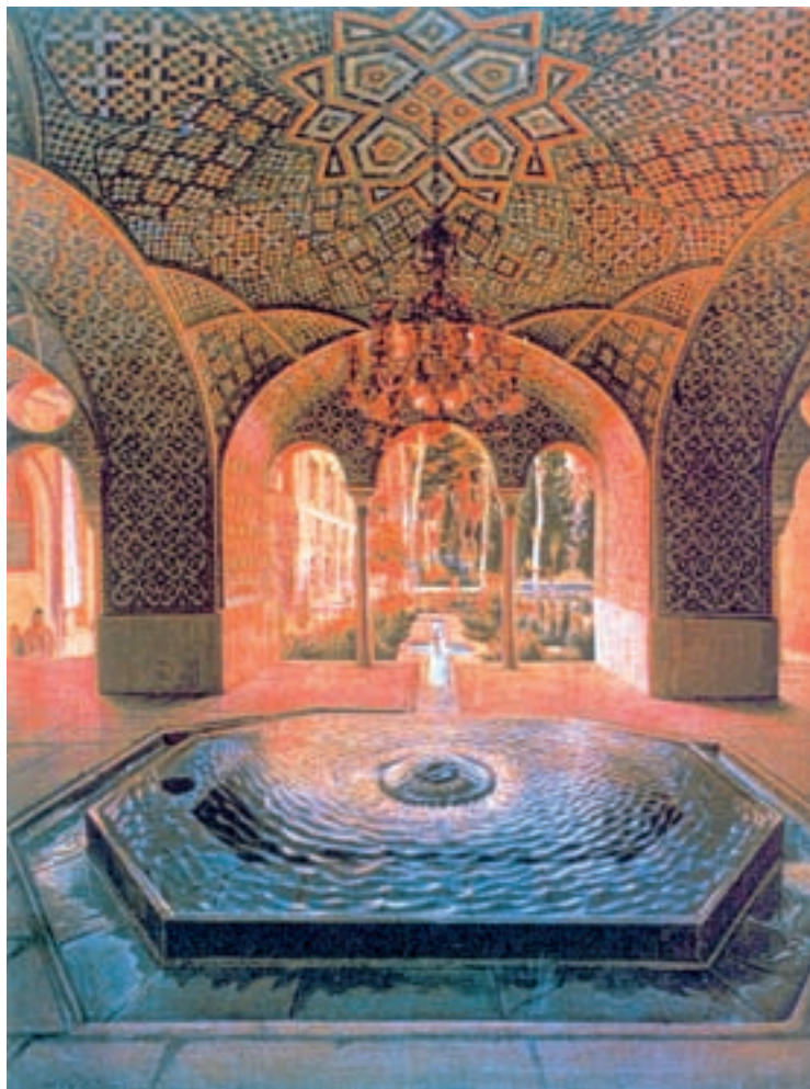
تصویر ۶۴-۲- حوض‌خانه‌ی کاخ گلستان، اثر کمال‌الملک، رنگ روغن روی بوم