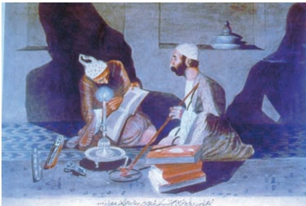
تصویر ۲-۶۲- استنساخ، اثر محمودخان صبا، رنگ روغن روی بوم، ۱۲۷۵ ه.ق

شخصی و تمایلات اجتماعی کم‌رنگ نیز در برخی از آثار وی به چشم می‌خورد. کمال‌الملک سال‌هایی از عمر خود را در ایتالیا و فرانسه گذراند و در دوره‌ی انقلاب مشروطیت هم چند سالی در عراق بود تا آن که به ایران بازگشت و مدرسه‌ی صنایع مستظرفه را در تهران بنیاد نهاد و ریاست آن را به عهده گرفت. وی در این مدرسه به پرورش شاگردانی همت گماشت که بعداً خود در مکتب او استاد شدند. در گسترش طبیعت‌گرایی در نقاشی ایران، هنرمندان دیگری چون موسی ممیزی، محمودخان صبا و مهدی مصورالملکی نیز مؤثر بودند، اما تأثیر‌گذاری هیچ‌کدام به اندازه‌ی کمال‌الملک نبود (تصاویر ۲-۶۲، ۲-۶۳، ۲-۶۴، ۲-۶۵ و ۲-۶۶).