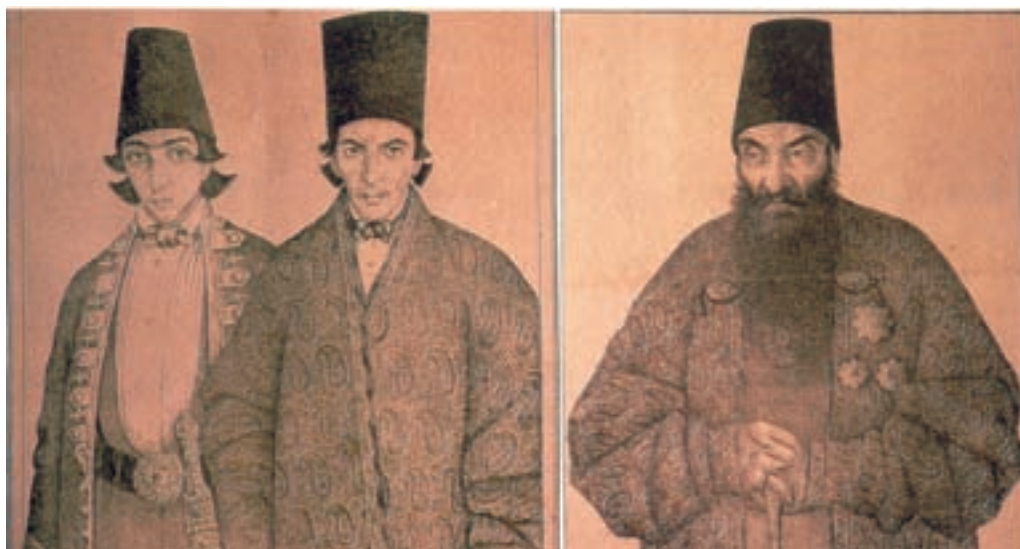
تصویر ۵۹-۲- طراحی از چهره برای چاپ در روزنامه، اثر صنیع الملک.