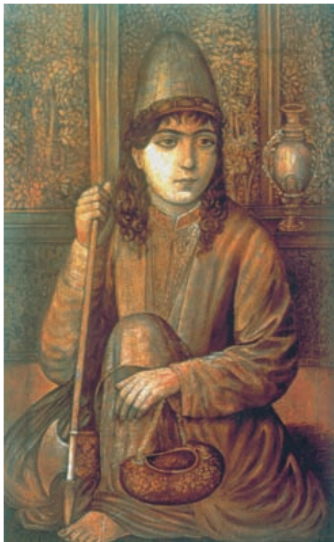
تصویر ۶۱-۲- چهره‌ی نورعلی‌شاه، اثر اسماعیل جلایر، رنگ روغن روی بوم، ۱۳۸۲ ه.ق.

علاوه بر مجمع الصنایع که به سرپرستی صنیع‌الملک، هنر طبیعت‌گرای غربی را در میان هنر دوستان رواج می‌داد مدرسه‌ی دارالفنون نیز، که به همت امیرکبیر دایر شده بود، در کنار فعالیت علمی، آموزش‌های هنری را هم آغاز کرده بود و هنرمندانی نظیر ابوتراب غفاری، محمد غفاری (کمال‌الملک) و اسماعیل جلایر از جمله نقاشانی بودند که در این مدرسه آموزش دیدند. (تصویر ۶۱-۲)