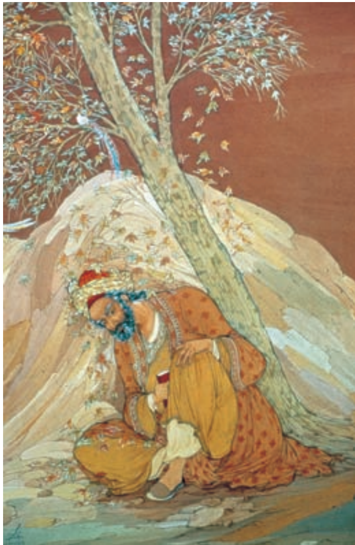
تصویر ۷۳-۲- افسوس که نامه‌ی جوانی طی شد. اثر حسین بهزاد، ۱۳۲۸ ه.ش.