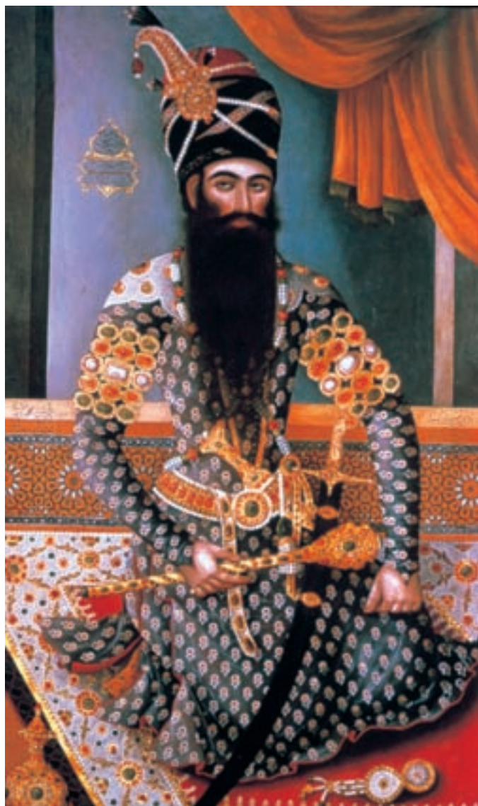
تصویر ۲-۵۴- فتحعلی شاه در لباس رسمی، اثر مهر علی اصفهانی، رنگ روغن روی بوم، ۱۲۲۸ هـ.ق

در این پیکرنگاری‌ها ترکیب خوشایندی میان سنت‌های خاص نقاشی دو بعد نمای ایرانی و شیوه‌ی سه بعد نما و واقع‌پرداز اروپایی پدید می‌آید. نقاشانی هم‌چون آقاصادق و آقابقر این شیوه را در شیراز آغاز کردند ولی اوج انسجام ساختاری این آثار در نقاشی استادانی نظیر میرزا بابا و مهرعلی اصفهانی در عهد فتحعلی شاه قاجار دیده می‌شود. دستاوردهای تصویری این دو استاد به مدت پنجاه سال برای نقاشان نسل بعدی یعنی عبدالله‌خان، سیدمیرزا و ابوالقاسم سرمشقی مطمئن می‌شود (تصاویر ۲-۵۴، ۲-۵۵، ۲-۵۶ و ۲-۵۷).