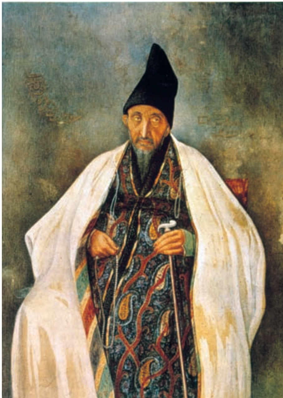
تصویر ۵۸-۲- چهره‌ی حاج‌میرزا آغاسی، اثر صنیع الملک، رنگ روغن روی بوم، حدود ۱۲۷۰ ه.ق

۱۳۱۳-۱۲۶۴ ه.ق) به ایران بازگشت و با لقب صنیع الملک به مقام نقاش‌باشی دربار منصوب شد. غفاری اگرچه اصول و قواعد علمی طبیعت‌نگاری را درک کرده بود ولی سنت‌های هنر ایرانی را نیز از نظر دور نمی‌داشت. برخی از اولین روزنامه‌های ایران، از جمله روزنامه‌ی دولت علیّه‌ی ایران، به همت وی و به دستور ناصرالدین‌شاه انتشار یافت، به همین مناسبت وی را می‌توان پدر هنر گرافیک ایران نامید. غفاری چهره‌پرداز توانایی بود و چهره‌ی رجال را برای چاپ در روزنامه‌ها طراحی می‌کرد. از طرفی دیگر، وی اولین مدرسه‌ی آموزش هنر نقاشی را باعنوان مجمع‌الصنایع در تهران راه‌اندازی کرد و در این مجموعه‌ی هنری شیوه‌های هنر واقع‌گرای نقاشی غربی را آموزش داد. هم‌چنین توسط ناصرالدین‌شاه مصورسازی کتاب هزارویک شب به او سپرده شد که توانست با کمک همکاران و شاگردانش بیش از هزار تصویر برای این کتاب ۶جلدی بسازد (تصاویر ۵۸- ۲، ۵۹- ۲ و ۶۰- ۲).