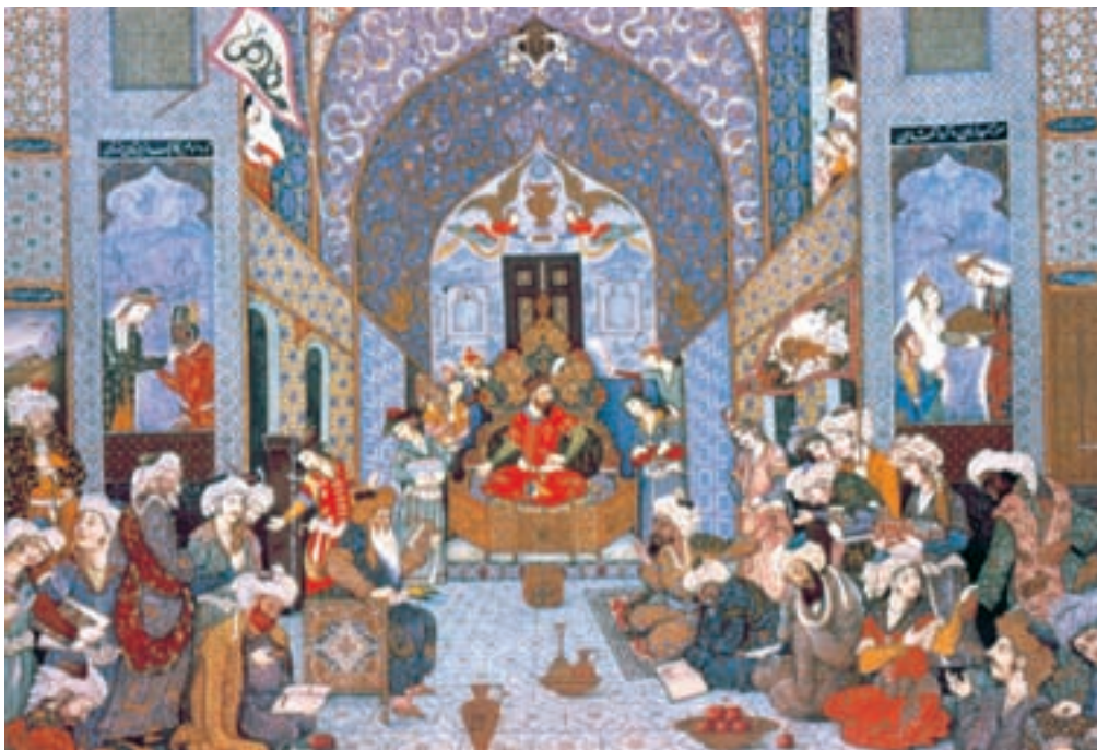
تصویر ۷۴-۲- فردوسی در بارگاه سلطان محمود غزنوی، اثر هادی تجویدی ۱۳۱۵ ه.ش.