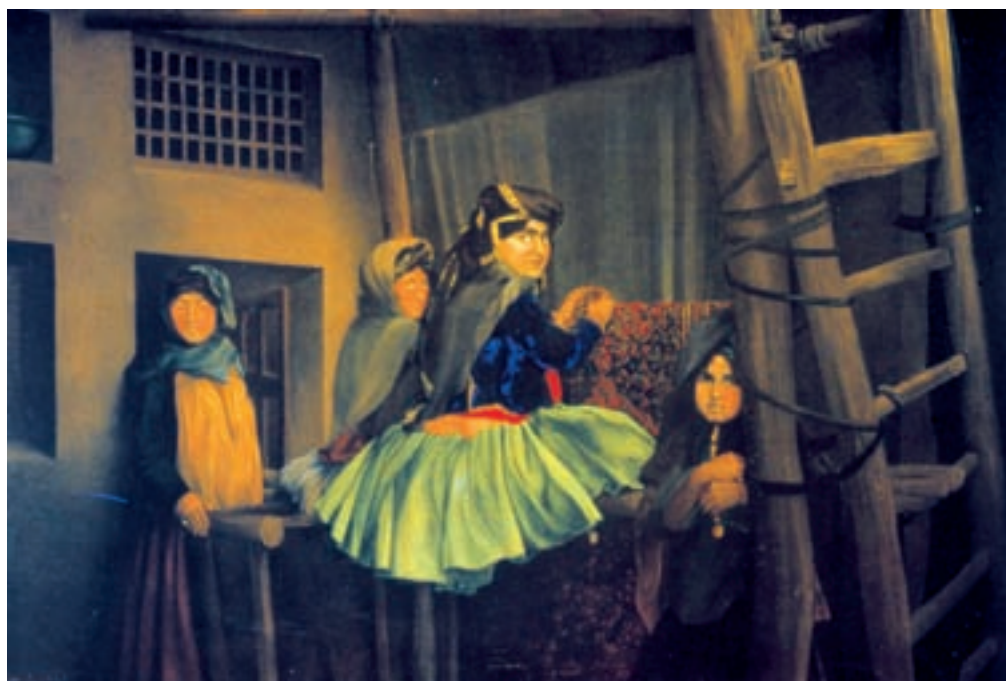
تصویر ۲-۶۳- کارگاه قالی‌بافی، اثر موسی ممیزی، رنگ روغن روی بوم، ۱۲۹۳ ه.ق