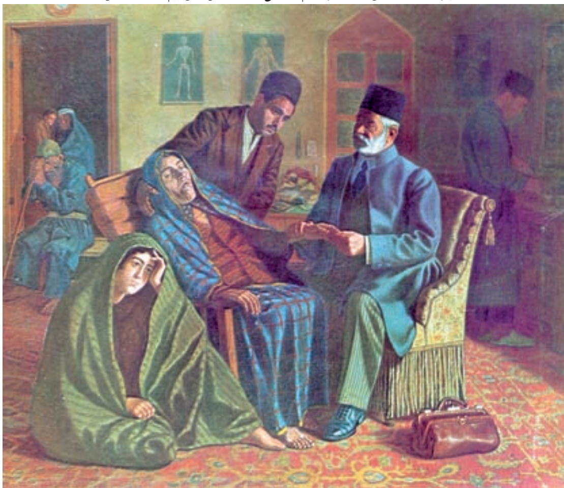
تصویر ۶۸-۲- طبیب و بیمار، اثر حسین شیخ، رنگ روغن روی بوم، ۱۳۱۵ ه.ش.