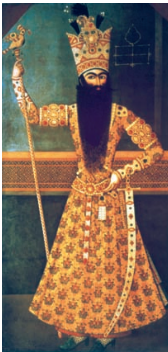
تصویر ۲-۵۵- فتحعلی شاه، اثر میرزا بابا، رنگ روغن روی بوم، ۱۲۱۳ هـ.ق

آویختن این قبیل تابلوها بر دیوار کاخ‌ها و تالارهای اشرافی نشانگر نوعی پیوند میان هنر نقاشی و معماری است در حالی که نگارگری پیوندی تنگاتنگ با ادبیات دارد.