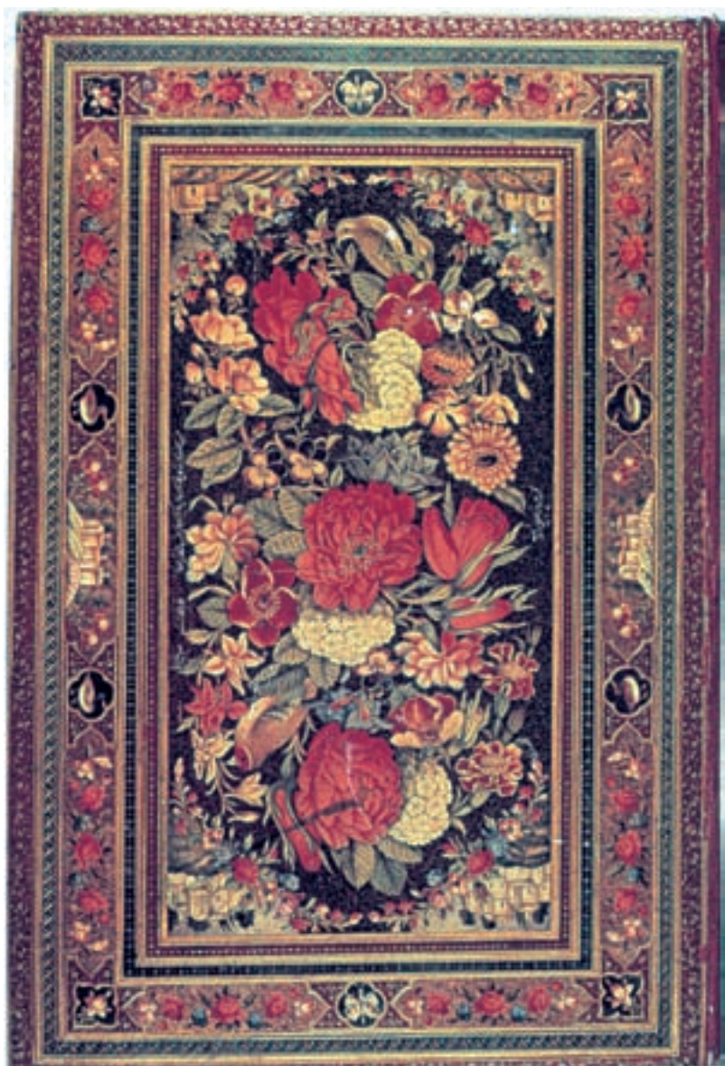
تصویر ۵۲-۲- گل و مرغ، نقاشی زیرلاکی، اثر لطفعلی صورتگر، سده‌ی ۱۳ ه.ق

در این روزگار روش غالب، استفاده از رنگ روغنی و بوم‌های پارچه‌ای بزرگ است این وسیله‌ی جدید که از اواسط حکومت صفویه و در مکتب اصفهان، در میان نقاشان رواج یافته بود به تدریج اصلی‌ترین ابزار در تولید تابلوهای نقاشی می‌شود. نقاشی زیرلاکی نیز که با آبرنگ اجرا می‌شد در این دوره رونق می‌یابد و از استادان آن می‌توان علی‌اشرف و لطفعلی‌صورتگر را نام برد (تصویر ۵۲-۲).