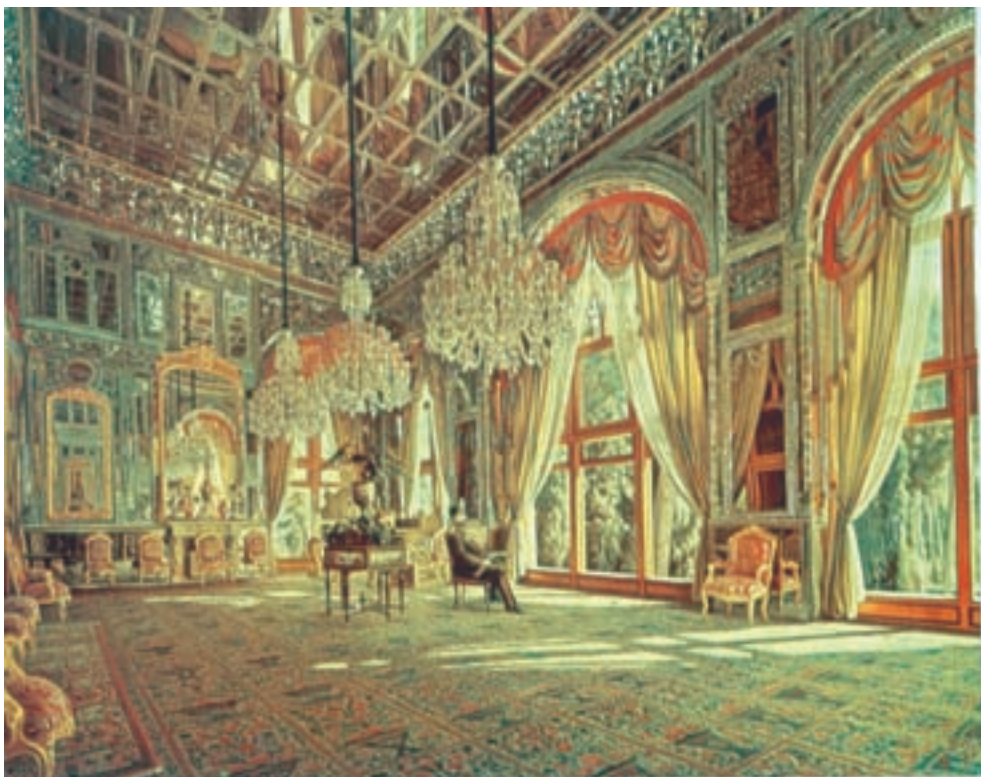
تصویر ۶۵-۲- تالار آینه، اثر کمال‌الملک، رنگ روغن روی بوم، ۱۳۰۳ ه.ق