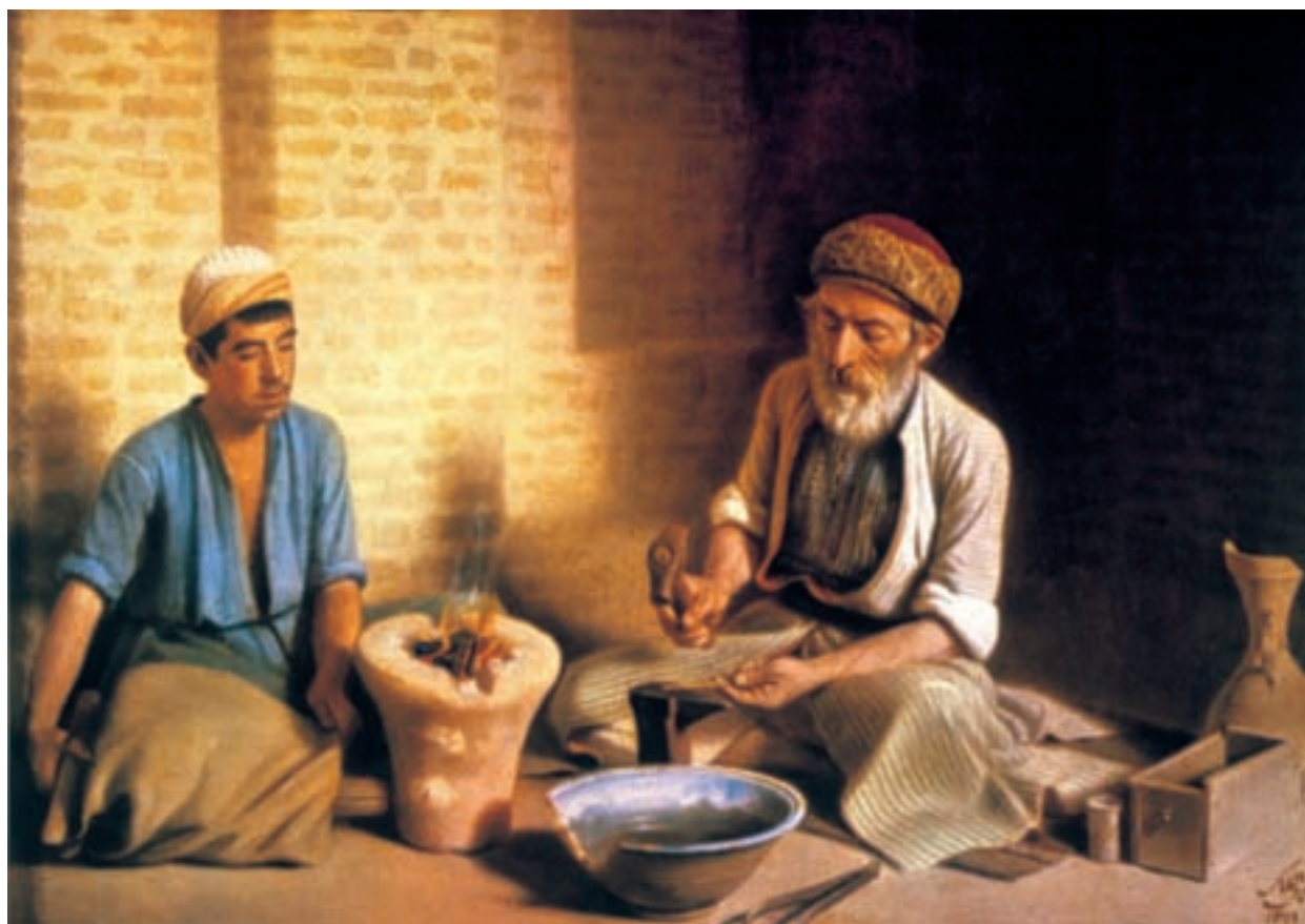
تصویر ۶۶-۲- زرگر بغدادی، اثر کمال الملک، رنگ روغن روی بوم، ۱۳۱۹ هـ.ق.