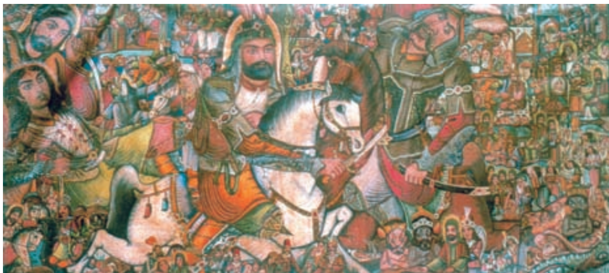
تصویر ۷۲-۲- جنگ حضرت ابوالفضل(ع)، اثر حسین همدانی، رنگ روغن روی بوم، ۱۳۳۰ ه.ش.

ج) نگارگری جدید: در دوره‌ی قاجار نگارگران و تذهیب کارانی در اصفهان یا تهران بودند که اغلب به تقلید از آثار مکتب اصفهان می‌پرداختند. اینان در واقع در حاشیه‌ی عرصه‌ی هنر قرار داشتند تا آن که در اوایل حکومت رضاشاه تلاش‌هایی برای احیای هنرهای سنتی و صنایع دستی صورت گرفت. از جمله حرکتی تازه در زمینه‌ی نگارگری آغاز شد و مراکزی برای توسعه‌ی این هنر تأسیس گردید.