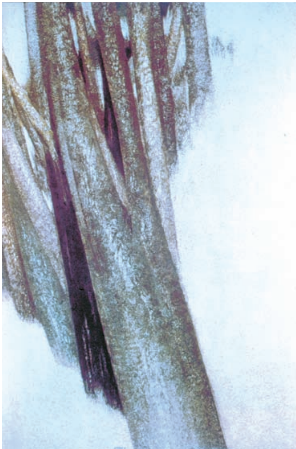
تصویر ۲-۷۶- درخت‌ها، اثر سهراب سپهری

نقش‌های چسبانندی (کولاژ) و یا از مواد و مصالحی متنوع شکل گرفته‌اند. از هنرمندان گرایش‌های مدرن در نقاشی ایران می‌توان به جلیل ضیاپور، جواد حمیدی، منصور قندریز، فرامرز پیلارام، حسین زنده‌رودی و سهراب سپهری و ... اشاره کرد (تصاویر ۲-۷۶ و ۲-۷۷).