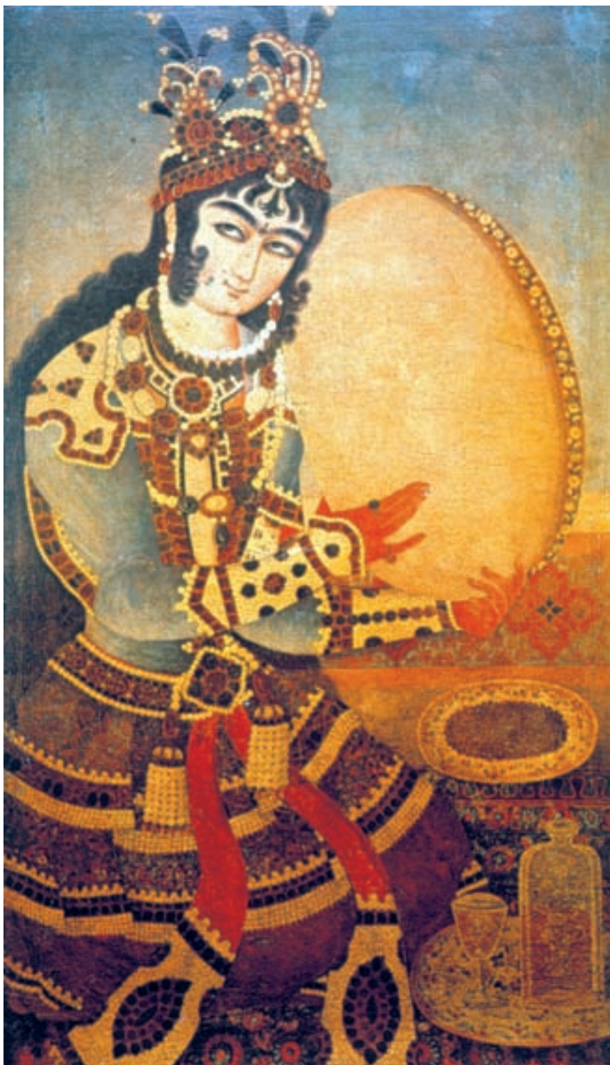
تصویر ۵۳-۲- نوازنده‌ی دف، اثر ابوالقاسم، رنگ روغن روی بوم، ۱۲۳۰ هـ.ق

موضوع اصلی نقاشی‌های عصر زند و قاجار انسان است ولی انسانی نمایشی که حالتی تصنعی دارد و به روشی تزینی تصویر می‌شود. در این تصاویر نقاش چندان در پی شبیه‌سازی نیست و بیش‌تر به شکوه و جلال ظاهری اهمیت می‌دهد. مردها غالباً افراد مهم جامعه، از جمله شاه و درباریان هستند ولی زن‌ها رامشگران و مطربان‌اند. اگرچه جایگاه اجتماعی زنان و مردان در نقاشی‌های زند و قاجار متفاوت است ولی هر دو در حالتی متظاهرانه و غرق در جواهرات، در کنار پنجره، پرده و یا زرده‌ای مشبک، در حالت روبه‌رو، که نگاهی باوقار و آرام به دور دست‌ها دارند، به تصویر درمی‌آیند. قراردادهای مشترکی در چهره و اندام آن‌ها رعایت می‌شود از جمله چشم‌های خماری، ابروان پیوسته، کمر باریک، دست‌های حنا بسته، و پوشاکی اشرافی که در آن روزگار متداول بود. در این نقاشی‌ها ترکیب‌بندی‌ها متقارن، ایستا و ساده است و اغلب کادرهای عمودی تصویر را یک یا دو پیکر در اندازه‌های بزرگ اشغال می‌کند. اندازه و شکل پرده‌های نقاشی بیش‌تر تابعی از شکل طاقچه‌ها یا فضایی است که تابلو در داخل آن نصب می‌گردد. ابزارها و لوازم موجود در