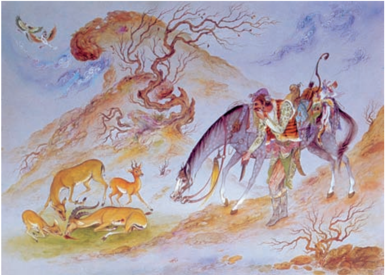
تصویر ۷۵-۲- شکار، اثر محمود فرشچیان، حدود ۱۳۴۰ ه.ش

د- نقاشی نوگرا (مدرن): نفوذ گسترده‌ی گرایش‌های نقاشی مدرن به داخل ایران، همزمان با جنگ جهانی دوم و به موازات رفتن رضاشاه از ایران و برقراری مختصر آزادی‌های اجتماعی و سیاسی، اتفاق افتاد. تشکیل دانشکده‌ی هنرهای زیبا، اعزام گسترده‌ی دانشجویان برای فراگیری هنر به اروپا و تدریس استادان اروپایی در مراکز هنری ایران و توسعه‌ی ارتباطات جهانی، عواملی بود که گروه‌های تحصیل کرده و نوجوی هنر را به سوی هنر مدرن اروپایی کشاند. البته این درحالی بود که حدود ۷۰ سال از پیدایش مکتب‌های مدرن در اروپا می‌گذشت.