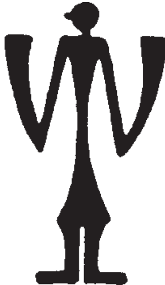
تصویر ۱-۵- نقش روی سفال از تلِ باکون (بکیون) فارس، هزاره‌ی سوم ق.م

قراردادهای تصویری با مضمون‌های معینی از دوره‌ای به دوره‌ای دیگر و از سرزمینی به سرزمین دیگر انتقال می‌یافت. از همین رو شباهت‌های چشم‌گیری، میان آثاری که از نقاط مختلف باستانی به‌دست آمده است، وجود دارد. (تصویر ۱-۵).