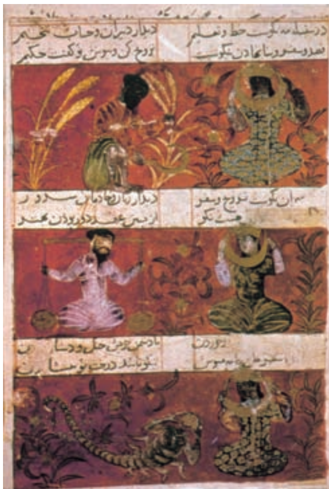
تصویر ۱۸-۲- برگ‌ی از مونس الأحرار، صور فلکی، ۷۴۱ ه.ق. شیراز