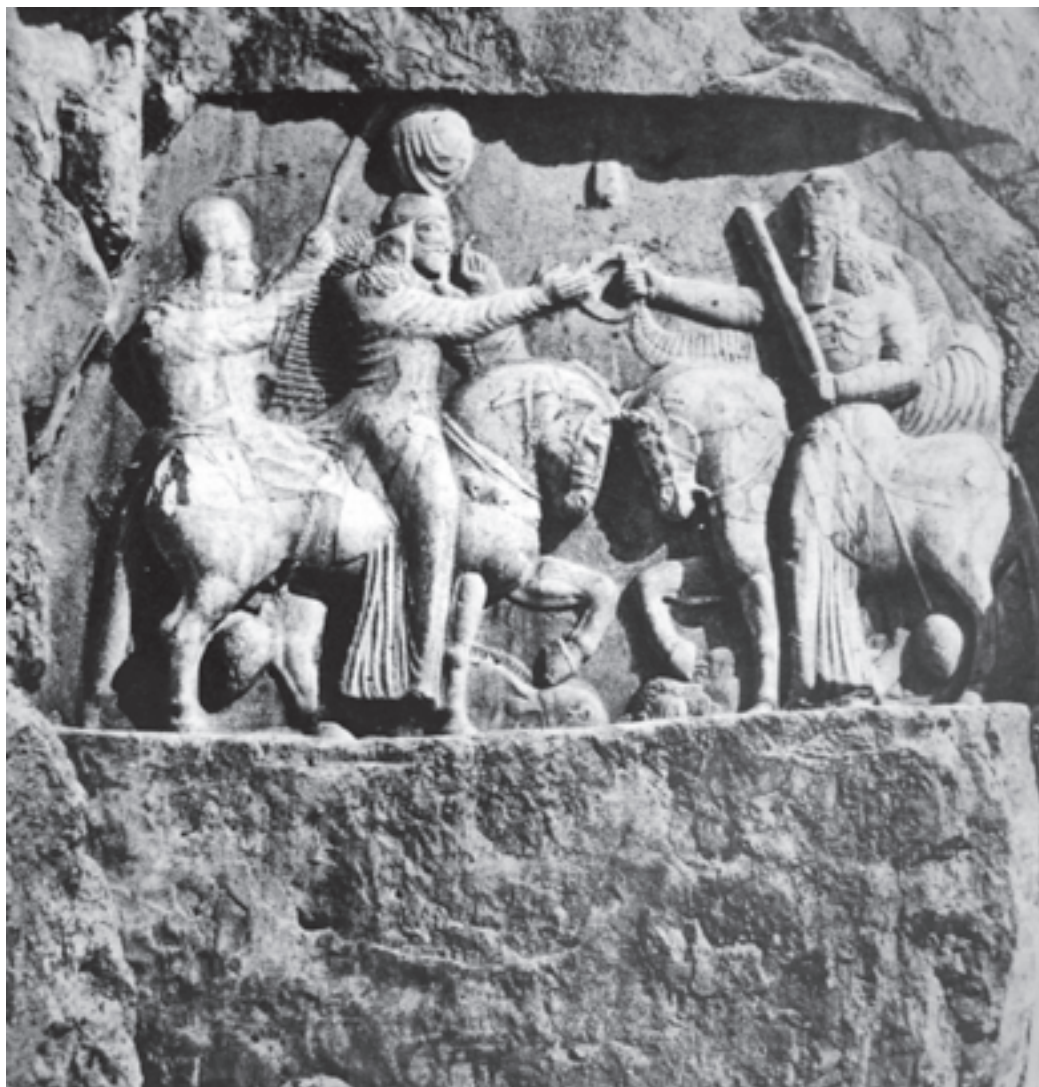
تصویر ۲-۳- حجاری ساسانی، اعطای سلطنت از طرف اهورامزدا به اردشیر ساسانی، نقش رستم، فارس، سده‌ی سوم میلادی

نقاش عهد سلجوقی، که شاید خوش‌نویسی کتاب را نیز به عهده داشته، پیوسته بخشی از صفحه‌ی کتاب را به صورت کادر، برای تصویر در نظر می‌گرفتند و رویدادهای مهم داستان را در آن نقاشی می‌کرده است. صحنه‌ها در این تصاویر، اغلب خلوت و ترکیب‌بندی‌ها ساده و متقارن هستند و مشابهت‌هایی تصویری با حجاری‌های دوره‌ی ساسانی دارند و رنگ آن‌ها محدود و به صورت تخت همراه با خطوط کناره‌نما مورد استفاده قرار می‌گیرد. در بعضی از این تصاویر، برخی علائم و نمادهای باستانی، هم‌چون بزرگ بودن و مرکزیت داشتن عناصر اصلی (مثلاً پیکر قهرمان یا شاه) و استفاده از هاله‌ی دور سر دیده می‌شود. (تصویر ۲-۳).