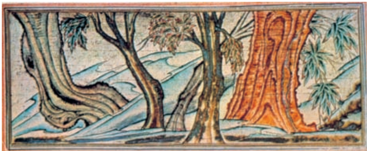
تصویر ۱۰-۲- برگه از کتاب جامع‌التواریخ، درخت مقدس بودا، ۷۱۴ ه.ق. تبریز

از ویژگی‌های نقاشی‌های این مکتب همان‌طور که اشاره شد، یکدست نبودن آن‌هاست؛ که نتیجه‌ی خاستگاه‌ها و سنت‌های متفاوت نقاشان حاضر در ربع رشیدی و دیگر مراکز هنری آن عصر بوده است. تأثیرپذیری از نقاشی چینی، که در مواردی چون تنه‌ی گره‌دار درختان و پرداختن به برخی حیوانات افسانه‌ای و ابرهای پیچان دیده می‌شود. هم‌چنین تأثیرپذیری از هنر بیزانس و سرزمین‌های غربی ایران، که در مواردی هم‌چون میل به عمق‌نمایی، تمایل برای نمایش حالات عاطفی، پرداختن به جزئیات و پیکرهای بلند قامت، خود را نشان می‌دهد. علاوه بر این، تداوم برخی سنت‌های خاص ایرانی، از جمله استفاده از رنگ تخت و خطوط کناره نما و استفاده از عناصر تزئینی از دیگر ویژگی‌های مکتب تبریز (ایلخانی) است. (تصاویر ۱۰-۲، ۱۱-۲، ۱۲-۲ و ۱۳-۲).