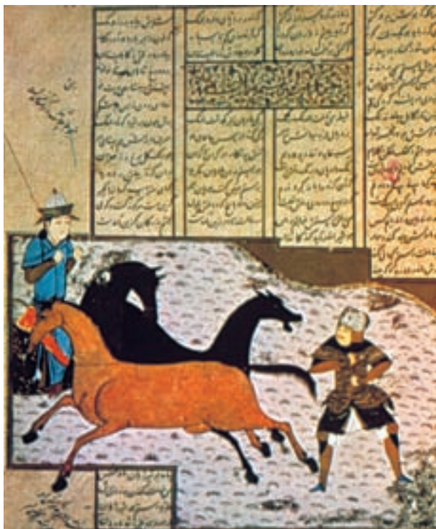
تصویر ۲۱-۲- برگی از شاهنامه‌ی ابراهیم سلطان، گرفتن رستم رخس را، حدود ۸۳۷ ه.ق. شیراز