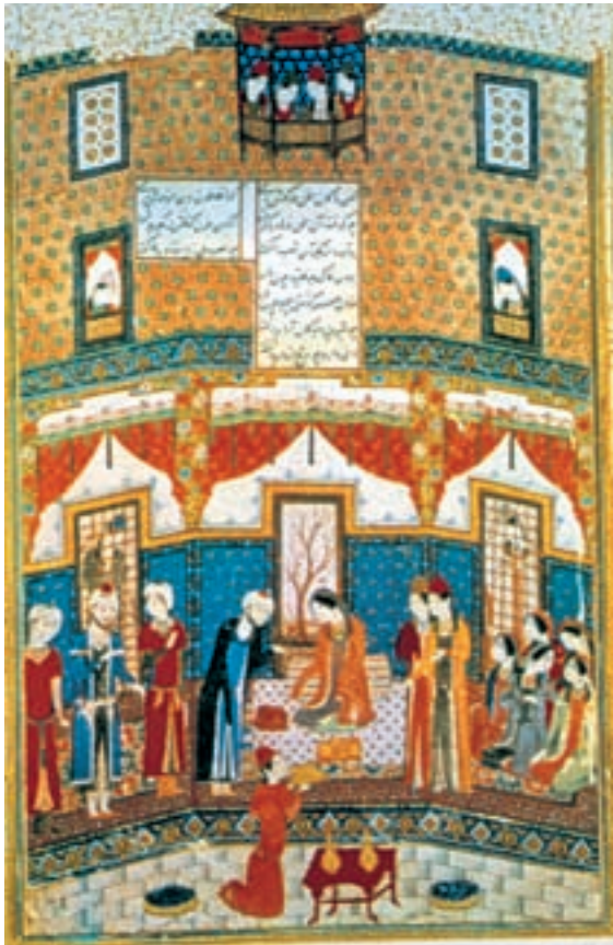
تصویر ۱۶-۲- برگه از خسرو و شیرین نظامی، خسرو در حضور شیرین، ۸۰۶ ه.ق. تبریز