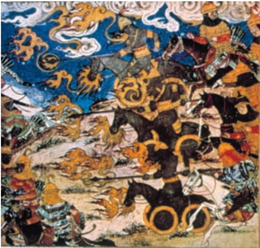
تصویر ۱۳-۲- برگی از شاهنامه‌ی ابوسعیدی (دیموت) جنگ اسکندر با هندیان، ۷۳۰ ه.ق. تبریز