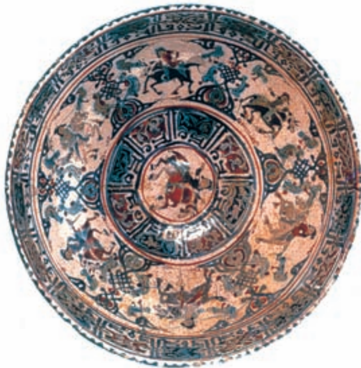
تصویر ۶-۲- سفال مینایی، کاشان، سده‌ی پنجم ه.ق

ب: نقاشی روی سفال: عامل رشد هنر سفالگری در سده‌های اولیه‌ی اسلامی را تحریم استفاده از فلزات گران‌بها (طلا و نقره) برای ساختن ظروف در دین اسلام، و نیز رقابت با هنر چینی‌سازی کشور چین دانسته‌اند. با توسعه‌ی هنر سفال‌گری در تمدن اسلامی، به تدریج روش‌های تولید، پخت و لعاب‌کاری سفال بهبود یافت و به نقش و نگارها مزین گردید. این نقش و نگارها معمولاً با نوشته‌هایی به خط کوفی یا نسخ همراه بود. به نظر می‌رسد سفالگران، هم‌چون کاتبان در آن عهد، احتمالاً خود، کار خوش‌نویسی و نقاشی را عهده‌دار بوده‌اند. زیرا نزدیکی‌های غیرقابل‌انکاری در تصاویر روی سفال‌ها و تصویرهای کتاب‌های مذکور می‌توان مشاهده کرد، چه به لحاظ ارتباط نوشته و تصویر، چه مقیاس‌ها و اندازه‌ها و چه از نظر شیوه‌ی استفاده از عناصری هم‌چون خط و رنگ. از جمله در هر دو (کتاب‌ها و سفال‌ها) رنگ‌ها تخت هستند و با خطوط کنارنما همراه‌اند. گفتنی است نمونه‌های فراوانی از سفال‌های مصور عهد سلجوقی با کیفیتی مناسب بر جای مانده است. در آن دوره، ظرف‌ها عمدتاً کاربردی بودند و جنبه‌ی عمومی داشتند و با تصاویری چون شاهزاده‌ی سوار بر اسب، عشاق در کنار برکه‌ی آب، پرندگان و حیوانات تمثیلی و یا با موضوعاتی برگرفته از داستان‌های ادبی و عاشقانه که با نقوش تزینی، شامل انواع ساده‌ای از اسلیمی‌ها و ختایی‌ها، آراسته می‌شدند. مراکز اصلی تولید سفال‌های مینایی در عهد سلجوقی شهرهای ری، کاشان، ساوه و نیشابور بود. نقاشی بر روی سفال در عهد مذکور چنان جایگاهی یافته بود که برخی سفال‌گران نام خود را بر سفال‌ها می‌نگاشتند. درحالی که نقاشان کتاب فقط از حدود سده‌ی نهم هجری به بعد نام خود را در آثارشان ثبت می‌کردند. (تصاویر ۶-۲ و ۷-۲).