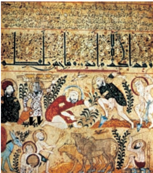
تصویر ۹-۲- برگی از کتاب التریاق، کشت گیاهان دارویی، سده‌ی ششم ه.ق