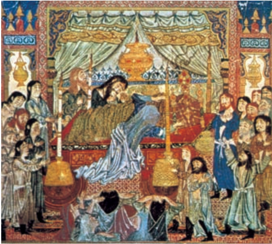
تصویر ۱۲-۲- برگی از شاهنامه‌ی ابوسعیدی (دیموت) زاری بر مرگ اسکندر، ۷۳۰ ه.ق. تبریز