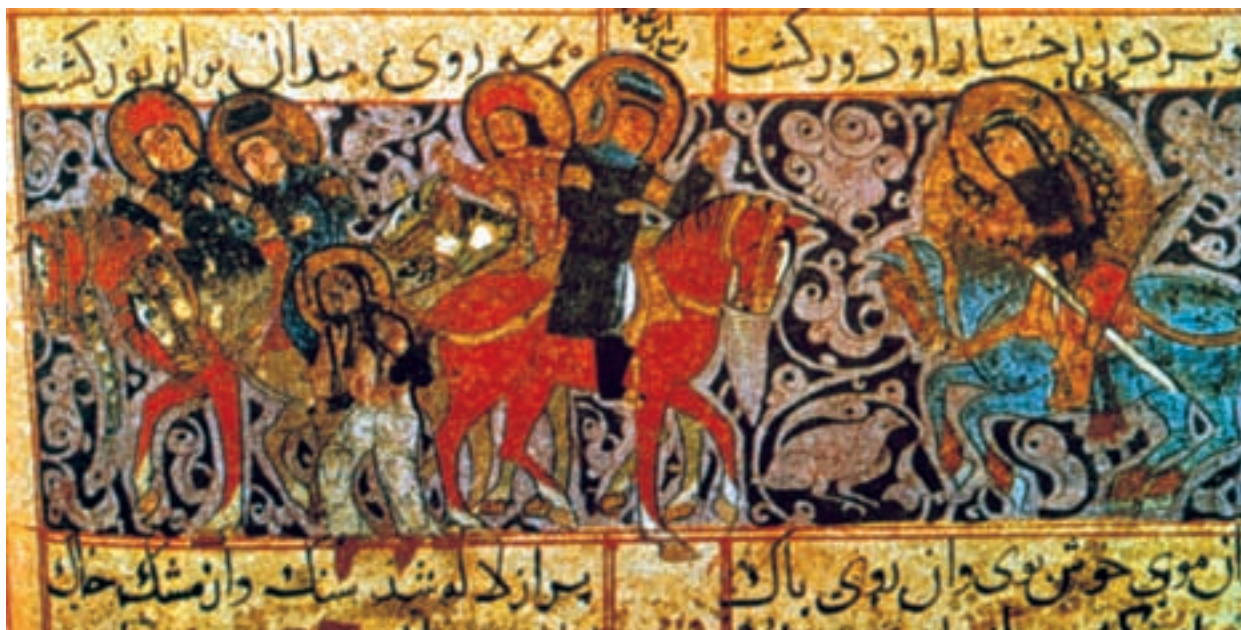
تصویر ۴-۲. برگه از کتاب ورقه و گلشاه، دیوار سواران، سده‌ی پنجم ه.ق.

تصویر ۳-۲ یک حجاری بزرگ از عهد ساسانی است و تصویر ۴-۲ یک نقاشی ظریف در داخل کتابی از عهد سلجوقی. بررسی کنید چه شباهت‌هایی را می‌توان میان این دو تصویر جست‌وجو کرد؟