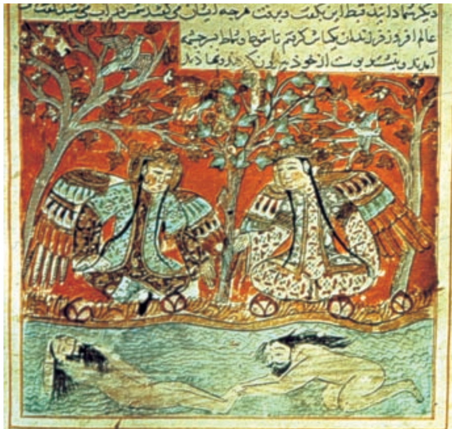
تصویر ۵-۲. برگه از کتاب سمک عیار، گوش فرادادن شمس به سخنان پریان، سده‌ی ششم ه.ق.