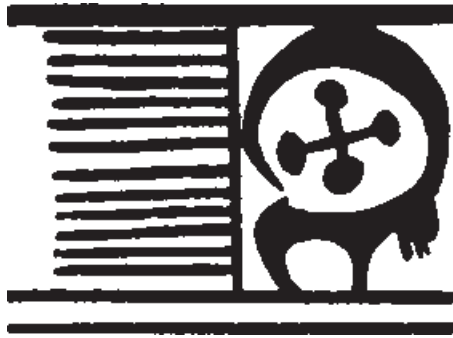
تصویر ۱-۴- نقش روی سفال از تپه‌ی گیان، نهاوند هزاره‌ی سوم ق.م

نقاشی روی سفال، در محدوده‌ی زمانی هزاره‌ی پنجم تا هزاره‌ی اول قبل از میلاد، از شاخص‌ترین تولیدات تصویری سرزمین ایران بوده است. طی این زمان طولانی تحول‌چندانی در نوع و مفاهیم نقاشی‌ها روی نداده است. (تصویر ۱-۴).