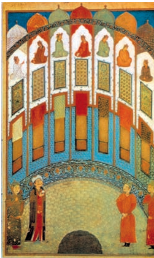
تصویر ۲۰-۲- برگی از گلچین اسکندر سلطان، بهرام گور در کاخ هفت گنبد، ۸۱۳ ه.ق. شیراز

تصویر ۲۲-۲- برگی از خاوران‌نامه‌ی ابن حسام، نشان دادن جبرئیل دلاوری‌های حضرت علی (ع) را به پیامبر (ص) ۸۳۳ ه.ق. شیراز اگرچه مضمون اغلب کتاب‌های مصور تاریخ نقاشی ایران ادبی است ولی خاوران‌نامه دارای مضمونی مذهبی است. این کتاب حاوی اشعاری حماسی درباره‌ی دلاوری‌های امام علی (ع) است.