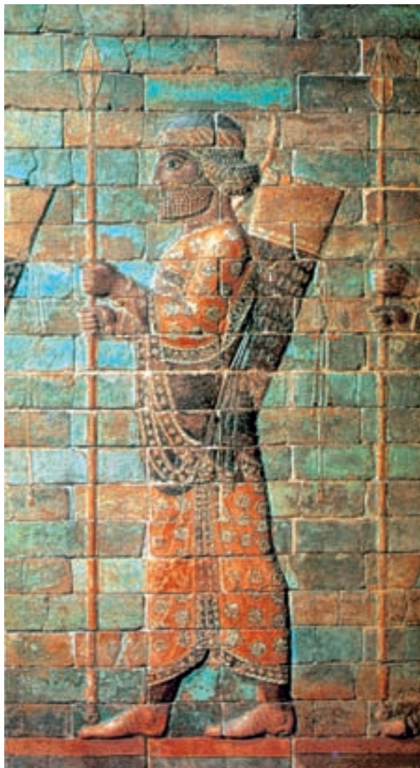
تصویر ۶-۱- سرباز جاویدان، نقاشی دیواری به شیوهی نقش برجسته‌ی لعاب‌داده شده، شوش، سده‌ی پنجم ق.م — ارتفاع حدود ۲ متر