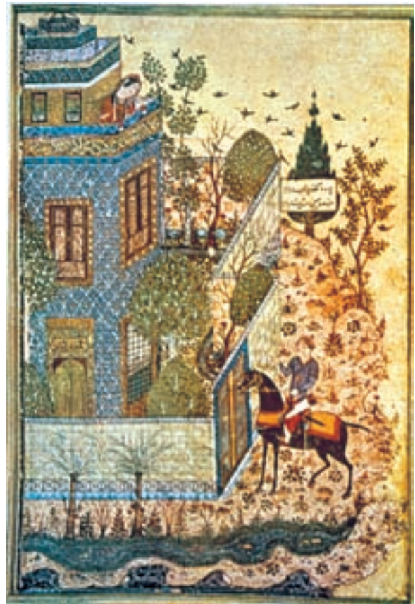
تصویر ۱۵-۲- برگه از دیوان خواجوی کرمانی، دیدار همای و همایون، اثر جنید، ۷۹۷ ه.ق. بغداد