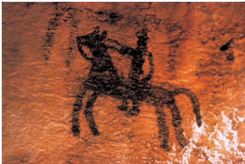
تصویر ۱-۱- سوارکار، نقاشی روی دیوار غار هومیان، لرستان، حدود هزاره‌ی ۸-۶ ق.م. ارتفاع حدود ۲۰ سانتی‌متر

قدیمی‌ترین آثار تصویری، که در ایران یافته‌اند، مربوط به غارهایی نظیر دوشه، هومیان و میرملاس در منطقه‌ی کوه‌دشت لرستان است. نقاشی‌های اندکی بر ورودی و داخل این غارها باقی مانده است که باستان‌شناسان آن‌ها را مربوط به اواخر دوره‌ی میان‌سنگی و اوایل دوره‌ی نوسنگی؛ یعنی حدود ۸-۶ هزارسال پیش دانسته‌اند. تصاویر مذکور صحنه‌هایی از رزم و شکار با تیر و کمان و حیواناتی چون اسب، گوزن، بزکوهی و سگ را نشان می‌دهند که به صورت تک‌رنگ در اندازه‌ای کوچک و به روشی ساده و با رنگ‌های قرمز آخرایبی و سیاه و زرد بر دیواره‌های غارها ترسیم شده‌اند (تصویر ۱-۱).