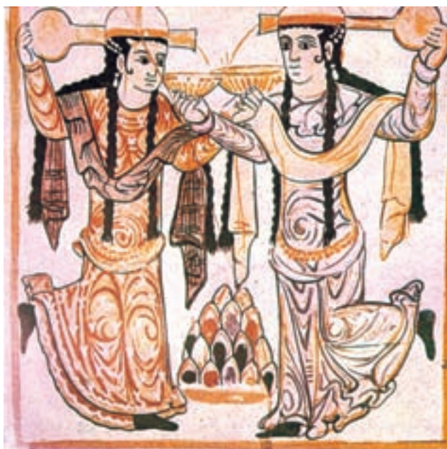
تصویر ۱-۲- رقصندگان، نقاشی دیواری، کاخ جوسق الخاقانی، سامرا، عراق، سده‌ی سوم ه.ق

پس از ظهور اسلام و فروپاشی حکومت ساسانی، ایران مدت‌ها توسط سلسله‌های عرب نژاد اموی و سپس عباسی اداره می‌شد. چندی بعد، حکومت‌های ایرانی، هم‌چون سامانیان، آل بویه و غزنویان، کوشیدند استقلال را به سرزمین ایران بازگردانند و هنر و فرهنگ ایرانی را که با اندیشه‌ی اسلامی آمیخته شده بود احیا کنند. اما سرانجام این سلسله‌ی سلجوقی بود که طی سده‌های پنجم و ششم هجری ۱ بر سراسر ایران حکم راند و هنرها، علوم و صنایع را به شکوفایی رساند.