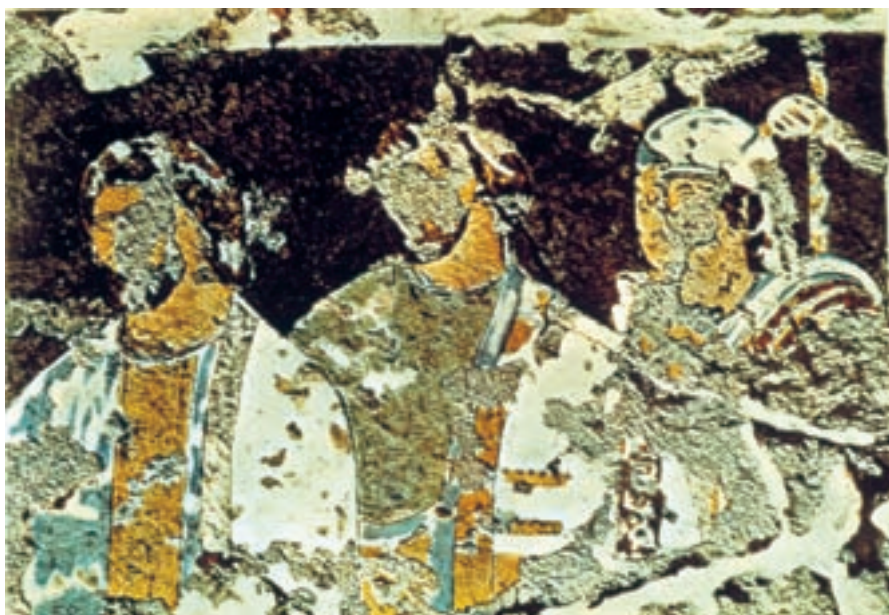
تصویر ۷-۱- ملکه و همراهان، (بخشی از تصویر) نقاشی دیواری، کوه خواجه، سیستان، سده‌ی اول میلادی