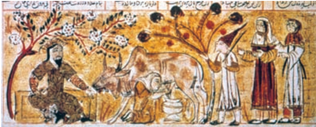
تصویر ۱۷-۲- برگ‌ی از شاهنامه‌ی قوام‌الدین وزیر، بهرام گور در کلبه‌ی یک دهقان، ۷۴۱ ه.ق. شیراز

از کتاب‌های مصور این مکتب تعدادی شاهنامه است که امروزه در موزه‌های جهان پراکنده‌اند از جمله شاهنامه‌ی قوام‌الدین وزیر (۷۴۱ ه.ق) و نمونه‌ی دیگر هم مونس الأحرار (محمد بن بدر جاجرمی ۷۴۱ ه.ق) است. (تصاویر ۱۷-۲ و ۱۸-۲).