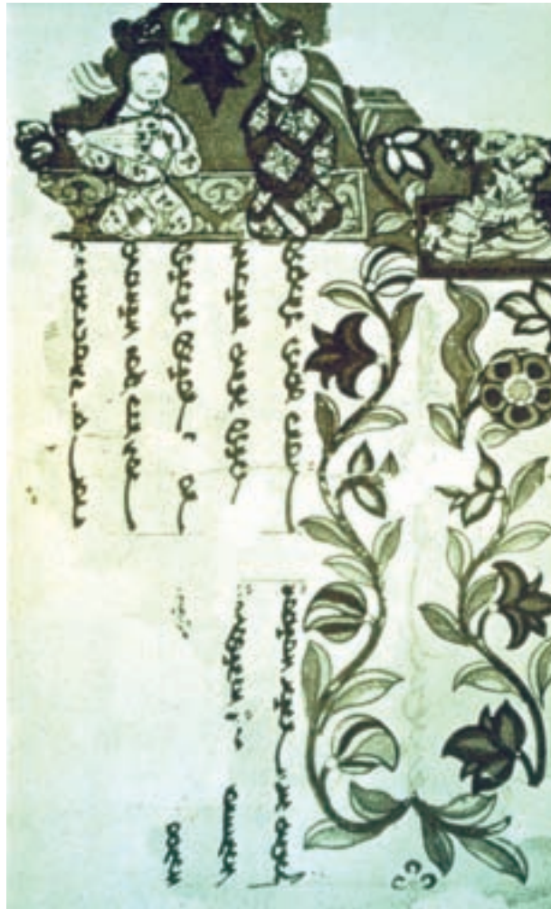
تصویر ۲-۲- برگی از ارژنگ مانی، به دست آمده از تورفان، سده‌ی دوم ه.ق

هنر دیوارنگاری در عهد اسلامی رونق و دوام چشم‌گیری نیافت و کم‌کم جای خود را در بناها به تزیینات گچ‌بری و خوش‌نویسی داد. برای مطالعه‌ی نقاشی عهد سلجوقی می‌توان به نمونه‌ی تصاویر کتاب‌های مصور به جای مانده و سفال‌های مینایی، لعاب‌دار منقوش و مزین به خوش‌نویسی مراجعه کرد.