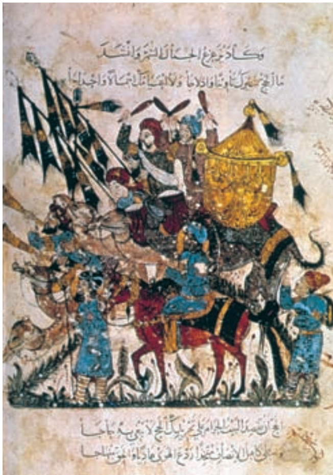
تصویر ۸-۲- برگی از کتاب مقامات حریری، سفر مکه، سده‌ی هفتم ه.ق