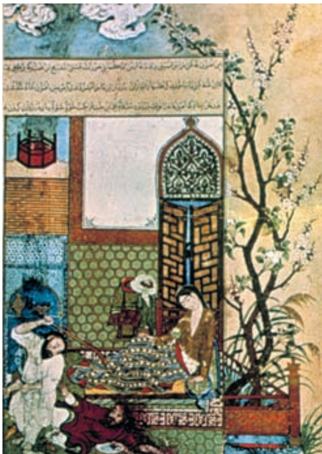
تصویر ۱۴-۲ - برگگی از کلیله و دمنه، گیرافتادن دزدی در اتاق،

دستاوردهای مکتب جلایری پیش‌درآمدی برای نقاشی شکوهمند مکتب هرات تیموری و تبریز صفوی در سده‌ی بعد بود.