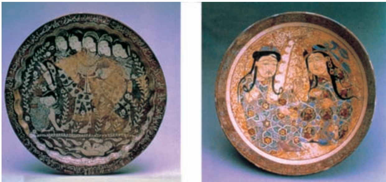
تصویر ۷-۲- سفال مینایی، نیشابور، سده پنجم ه.ق