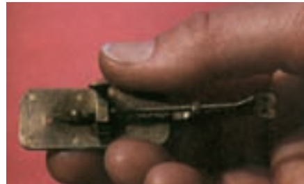
شکل ۱ - ۱ میکروسکوپ اولیه که لیون‌هوک ساخته بود. شکل ۲ - ۱ - اشکال ترسیم شده به وسیله لیون‌هوک

وی در نامه‌ای به محافل علمی چنین نوشت: «موجودات بسیار ریز برخی کروی شکل، برخی بیضوی، برخی دارای شاخکهای ریز، بعضی با ضمائی در انتهای بدن و برخی با حرکت کنه یا تند به رنگهای مختلف دیده می‌شوند.»