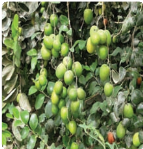
شکل ۳-۶- کنار پیوندی