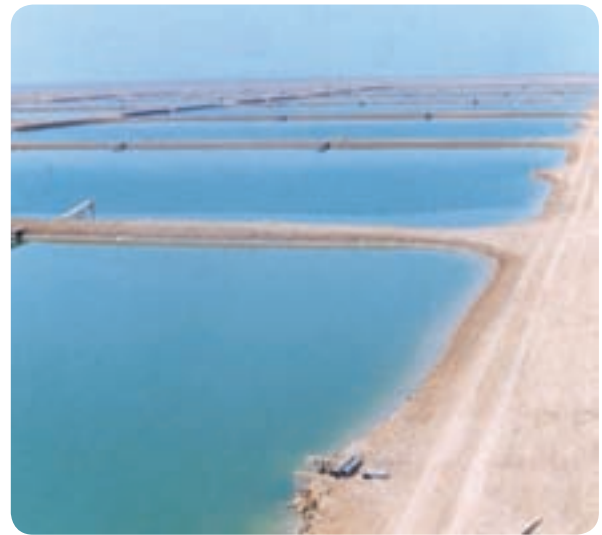
استخرهای پرورش میگو