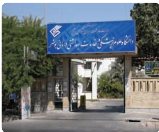
شکل ۱۵-۶- دانشگاه علوم پزشکی بوشهر