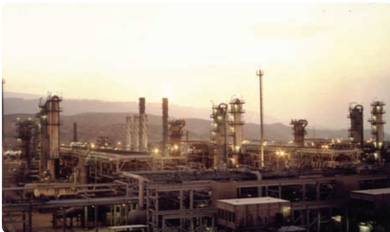
شکل ۲۸-۶- پالایشگاه گاز فجر جم