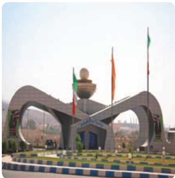
شکل ۱۰-۶- شرکت پالایشگاه گاز فجر جم