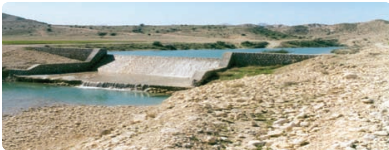
شکل ۱۳-۶- احداث استخرهای ذخیره آب