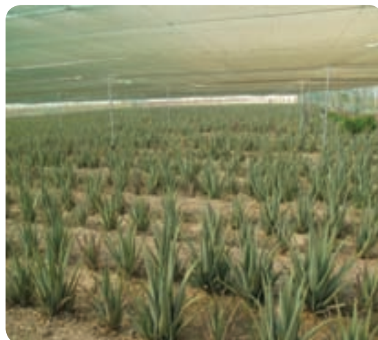
شکل ۶-۱- آلونه ورا