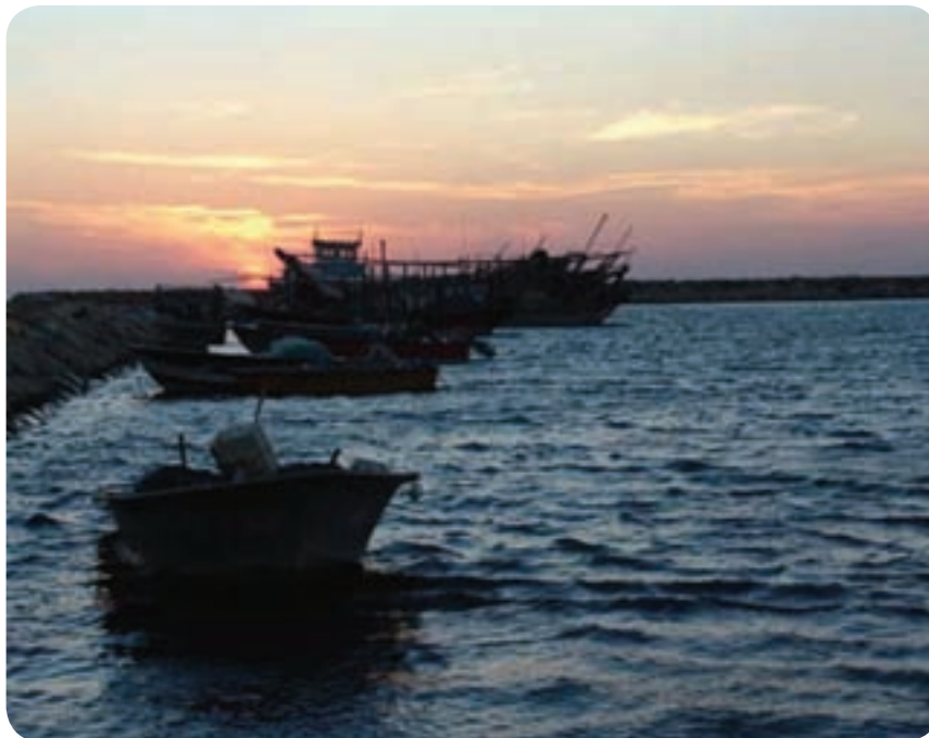
شکل ۲۷-۶- توسعه مناطق نمونه گردشگری