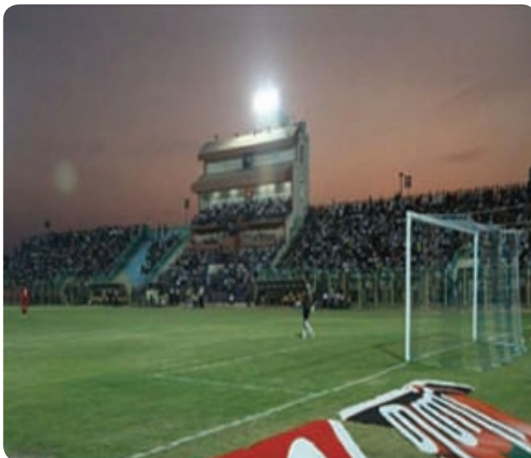
شکل ۲۵-۶- استادیوم شهید بهشتی