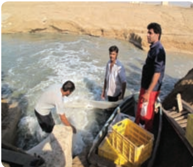
برداشت میگوی پرورشی

استان بوشهر با توجه به شرایط خاص اقلیمی حاکم بر آن و قرار گرفتن در طول سواحل خلیج فارس به عنوان یکی از غنی ترین دریا‌های جهان و استفاده از بخش وسیعی از اراضی مستعد ساحلی جهت کشت و پرورش میگو موجب رونق صنایع و خدمات وابسته به آن شده است.