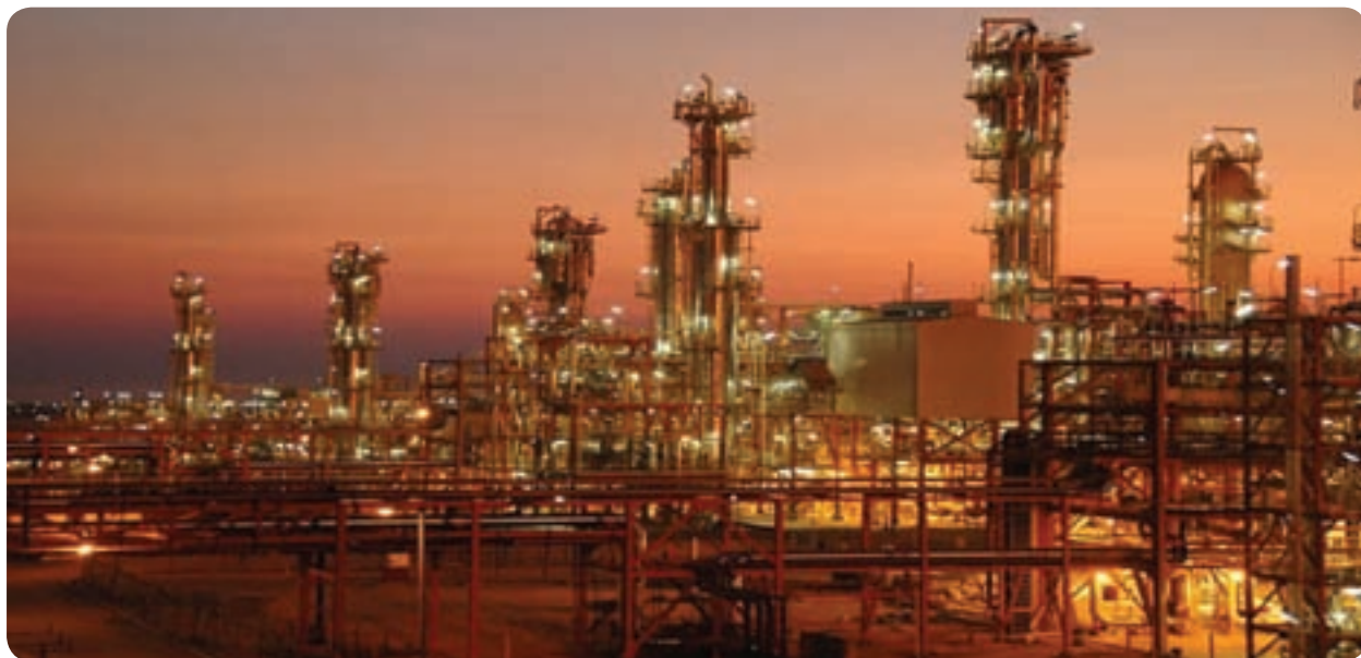
شکل ۸-۶- پارس جنوبی

در شهرستان شما چه تأسیسات نفتی و گازی احداث شده است؟