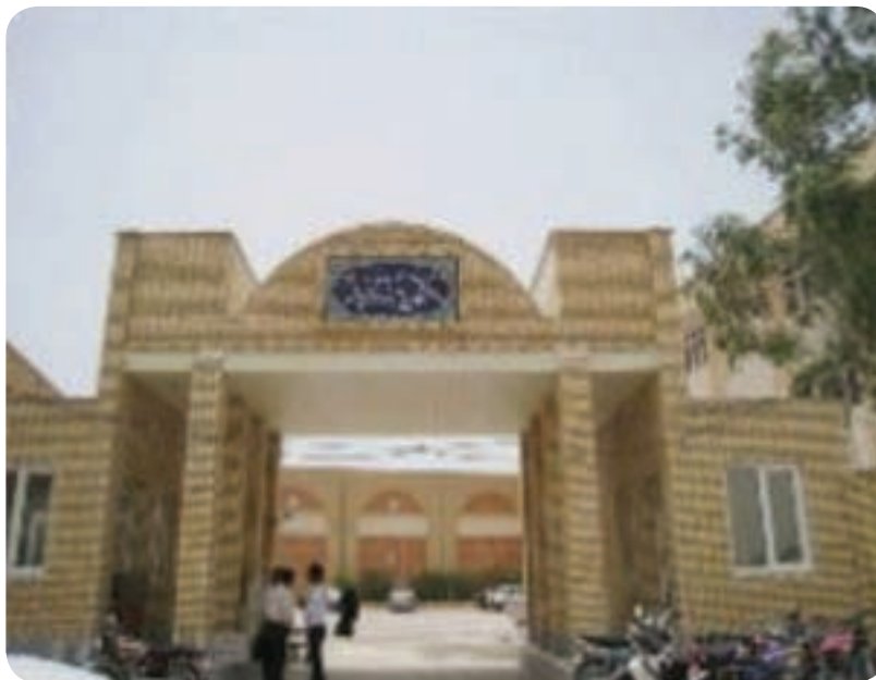
شکل ۲۳-۶- دانشگاه پیام نور