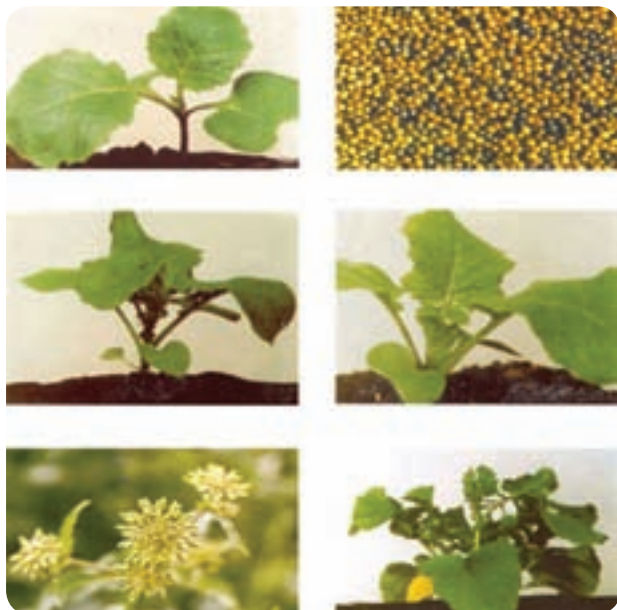
شکل ۴-۶- کلزا