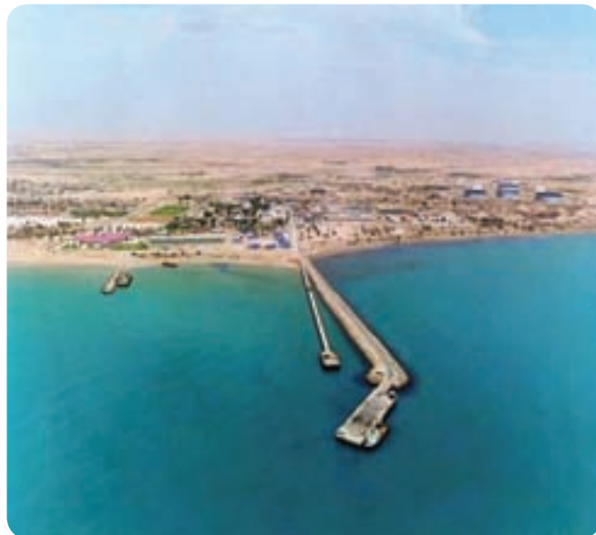
شکل ۹-۶- منطقه نفتی بهرگان (بندر امام حسن(ع) شهرستان دیلم)