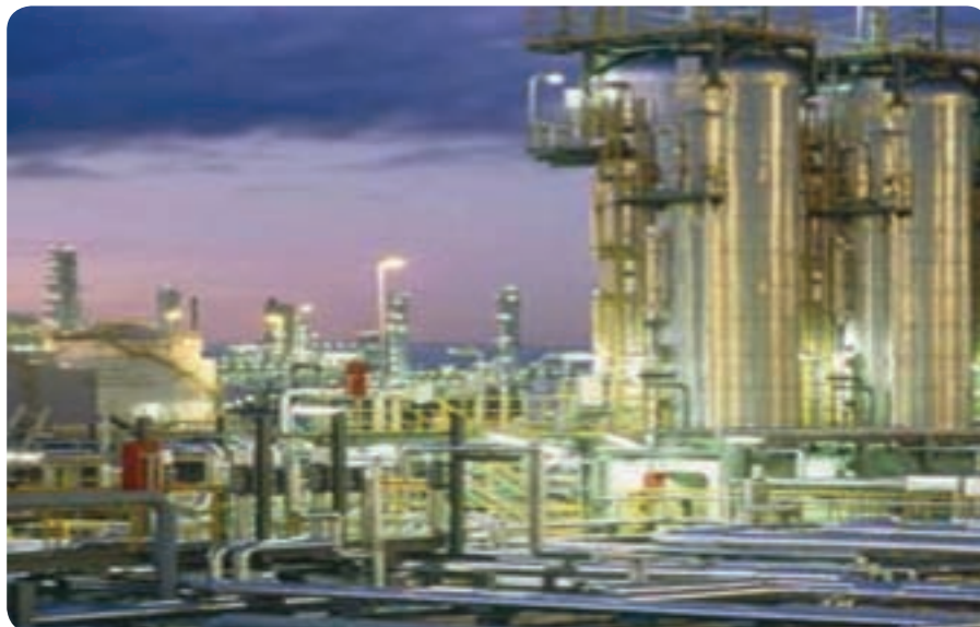
شکل ۲۱-۶- صنایع پتروشیمی

با اجرای طرح‌های بزرگ صنعتی نظیر صنایع نفت و گاز و پتروشیمی، نیروگاه هسته‌ای، ساخت و تعمیر شناورهای دریایی و گسترش شهرک‌های صنعتی، شاهد رشد و بالندگی بخش صنعت در استان بوده‌ایم. از نظر تولید گاز سبک استان بوشهر به تنهایی ۳۷/۷۱ درصد گاز سبک کشور را از طریق پالایشگاه فجر جم تولید می‌کند.