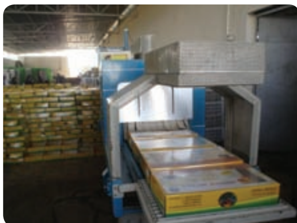
شکل ۵-۶- بسته بندی خرما