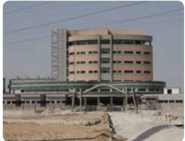
شکل ۱۶-۶- بیمارستان بوشهر