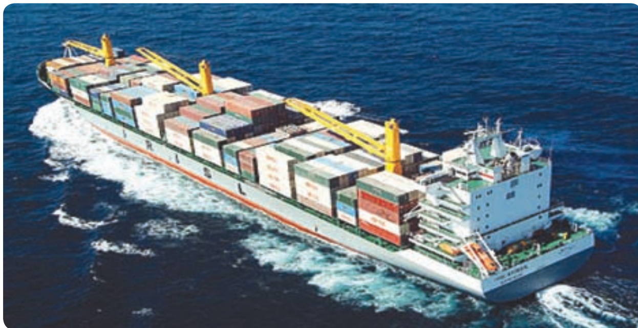
شکل ۲۶-۶ صادرات غیر نفتی

۳- توسعه صنایع بسته‌بندی، ذخیره‌سازی و انبار داری محصولات.