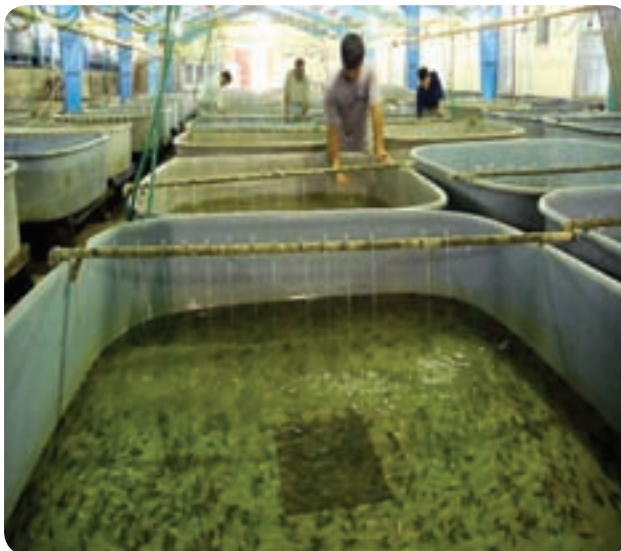
حوضچه تکثیر میگو