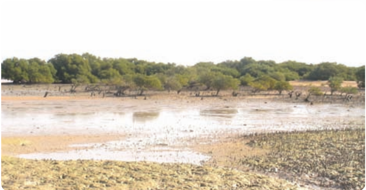
شکل ۱۲-۶- گسترش جنگل های حرا