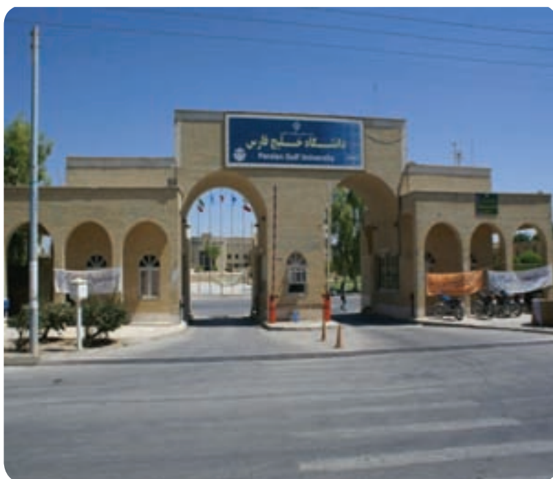
شکل ۲۴-۶- دانشگاه خلیج فارس