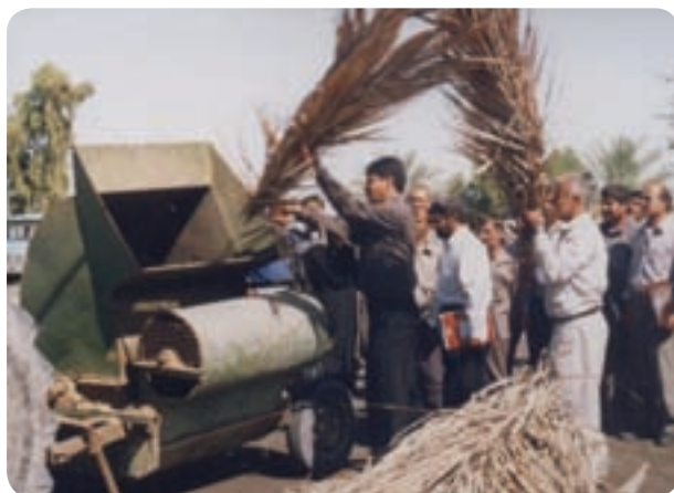
شکل ۶-۶- تبدیل برگ خرما به خوراک دام