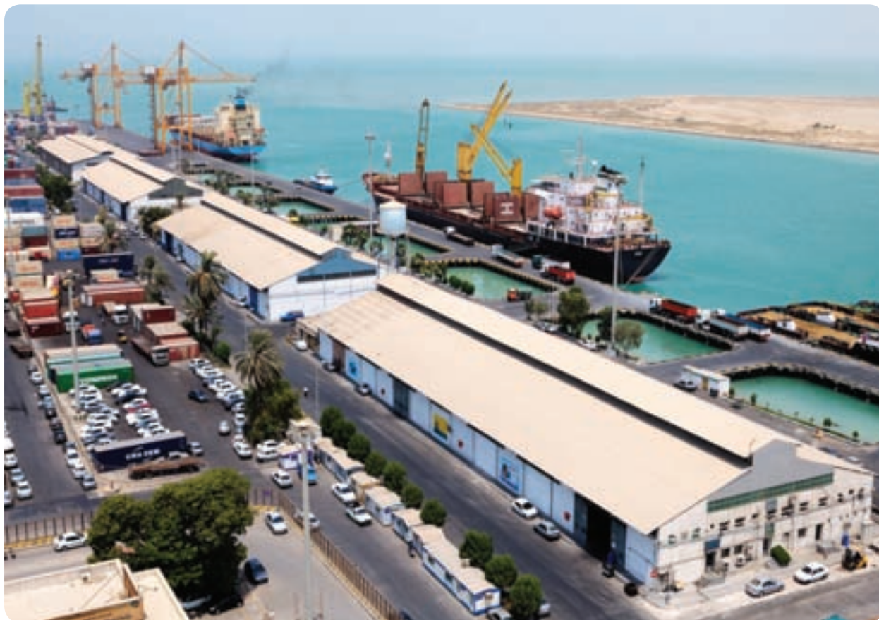
شکل ۱۸-۶- صادرات و واردات کالا