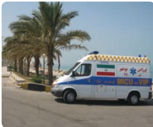
شکل ۱۴-۶- اورژانس جاده‌ای استان