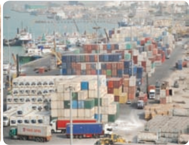
شکل ۱۹-۶- حمل و نقل کالا (گمرک)