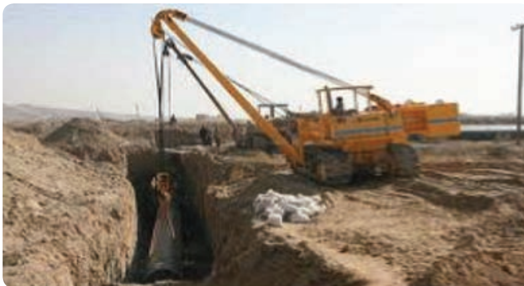
شکل ۱۱-۶- گاز رسانی در استان