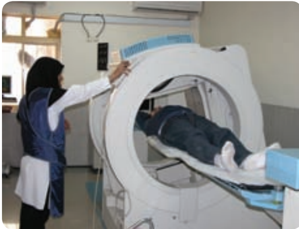
شکل ۱۷-۶- مرکز پزشکی هسته‌ای