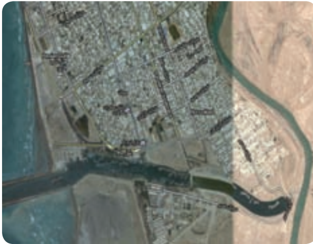
شکل ۲۰-۶- تصویر ماهواره ای از اسکله و شهر گناوه