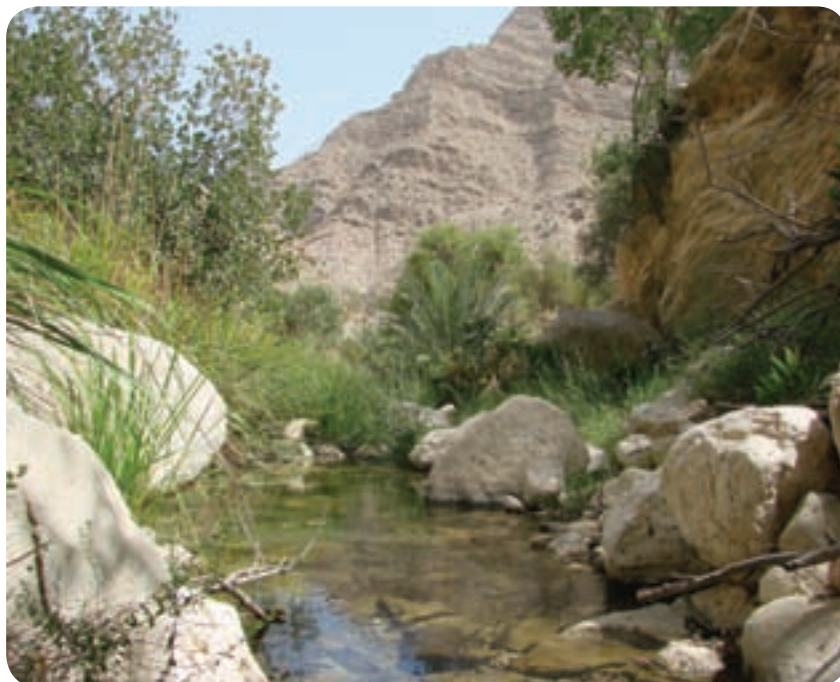
منطقه گردشگری خاییز