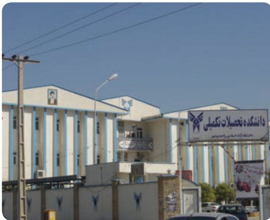
شکل ۲۲-۶- دانشگاه آزاد اسلامی

تمامی دانشگاه‌های موجود در استان پس از انقلاب اسلامی تأسیس شده که عبارت‌اند از: دانشگاه خلیج فارس، دانشگاه علوم پزشکی، پیام نور، آزاد اسلامی، مراکز علمی و کاربردی و تربیت معلم.