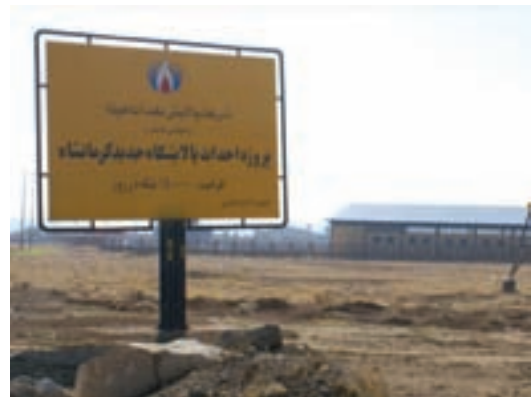
شکل ۶-۶- پالایشگاه نفت آناهیتا کرمانشاه