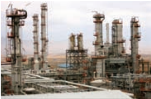
شکل ۲-۶- مجتمع پتروشیمی کرمانشاه