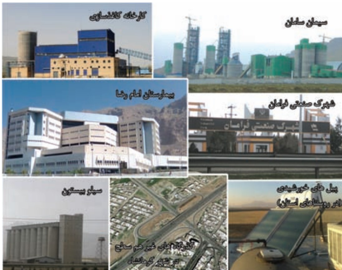
شکل ۴-۶- تصاویری از دستاوردهای استان کرمانشاه