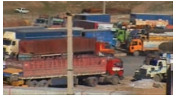
شکل ۱-۶- بازارچه مرزی پرویزخان

در دهه اول پس از انقلاب اسلامی، سرعت توسعه در بخش‌های زیربنایی و عمرانی استان کرمانشاه مانند دیگر استان‌های واقع در غرب کشورمان، به دلیل موقعیت مرزی و تأثیر مستقیم از جنگ تحمیلی، روند کندی داشت. اما در دهه‌های بعدی روند حرکت سرعت بیشتری یافته است. نمود این تحولات در استان را می‌توان در بخش‌های مختلف اقتصادی و زیربنایی مشاهده کرد. در این درس به‌طور گذرا مهم‌ترین این دستاوردها در بخش‌های مختلف بررسی می‌شود: