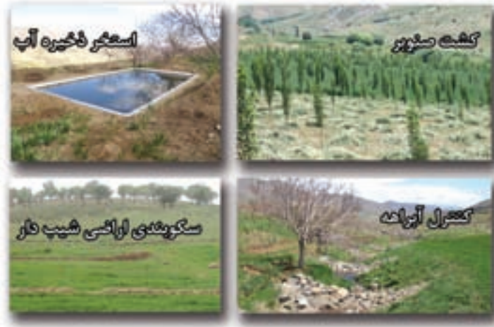
شکل ۵-۶- مهم ترین دستاوردهای بخش منابع طبیعی