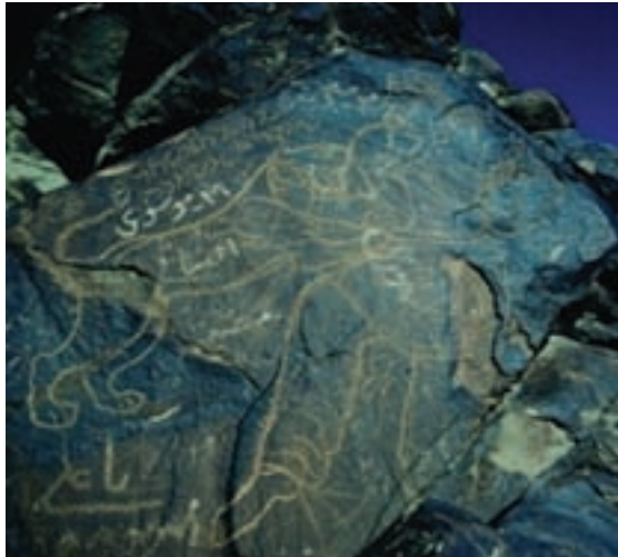
شکل ۱۲-۱۲- سنگ نگاره کال جنگال بیرجند