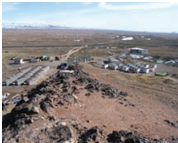
شکل ۲۲-۱۲- آب گرم فردوس