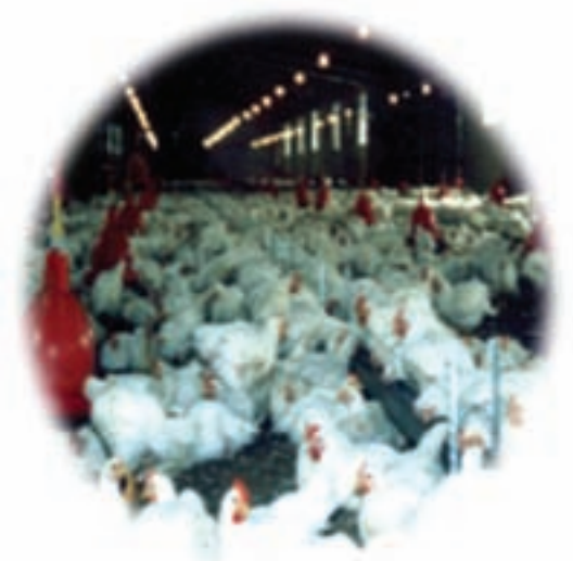
شکل ۴-۱۳- توانمندی‌های اقتصادی در بخش پرورش دام و طیور