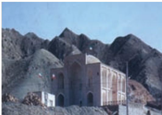
شکل ۱۴-۱۲- امامزاده سلطان ابراهیم رضا