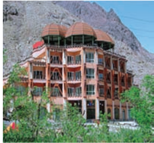
شکل ۱۱-۱۲- هتل کوهستان بند عمرشاه (امیرشاه) بیرجند