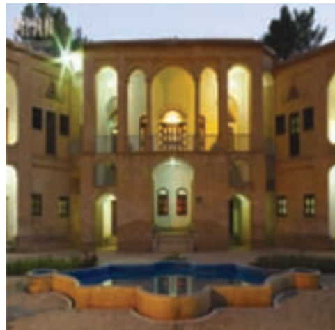
شکل ۱-۱۲- باغ موزه و عمارت اکبری بیرجند