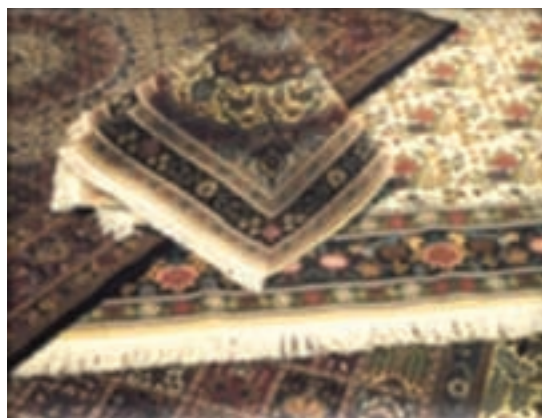
شکل ۶-۱۳- فرش مود