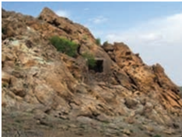
شکل ۱۸-۱۲- غار چنشت