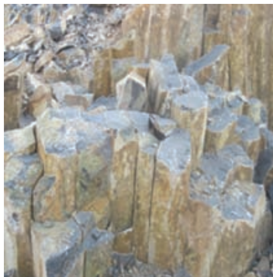
شکل ۷-۱۳- توانمندی‌های اقتصادی در بخش معدن