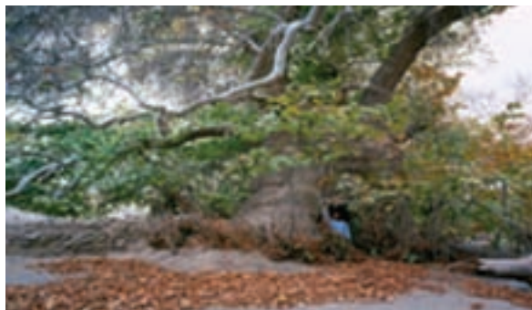
شکل ۱۵-۱۲- درخت هزار ساله دوشنگان

● منطقه نمونه گردشگری مصعبی کریمو در سرایان : این منطقه با وسعتی حدود ۵۲۶ هکتار درحد فاصل روستای مصعبی و کریمو شهرستان سرایان قرار دارد. که دارای آب و هوای مطلوب و چشم‌انداز طبیعی زیباست.