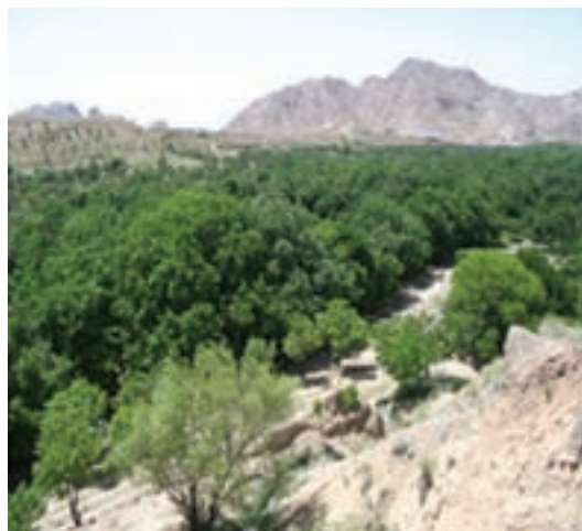
شکل ۱۶-۱۲- دره ییلاقی کریمو و مصعبی سرایان