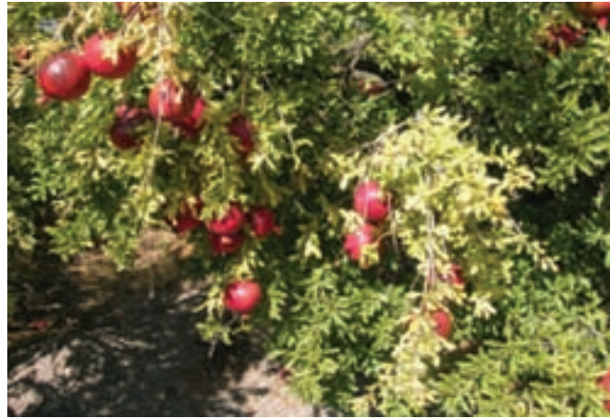
شکل ۳-۱۳- باغات انار در استان خراسان جنوبی

پ) دامپروری : علی‌رغم شرایط نامناسب اقلیمی، بیش از ۱۵۱۵۳ خانوار عشایری در استان به فعالیت‌های دامی مشغول‌اند. علاوه بر آن در بخش دامپروری، پرورش مرغ گوشتی و تخم‌گذار، گاو شیری و گوشتی، گوسفند، بز و شتر به صورت سنتی و صنعتی انجام می‌پذیرد.