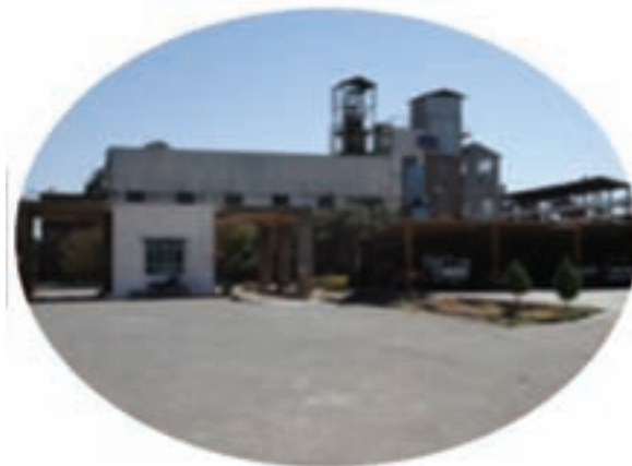
شکل ۵-۱۳- توانمندی‌های اقتصادی در بخش صنعت