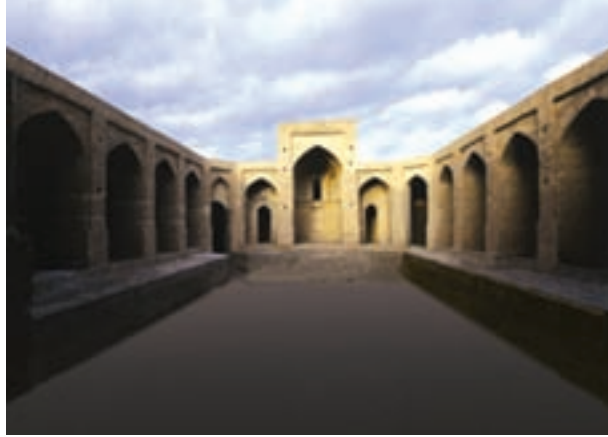
شکل ۱۷-۱۲- کاروانسرای سرایان

● روستاهای هدف گردشگری چنشت و ماخونیک در سریشیه: روستای هدف گردشگری چنشت در ۳۵ کیلومتری شهر مود واقع شده است و از نظر جاذبه‌های طبیعی و تاریخی - فرهنگی اهمیت خاصی دارد اما روستای ماخونیک در محور سریشیه به دُرُح قرار دارد. و بیشتر از اهمیت تاریخی برخوردار است.