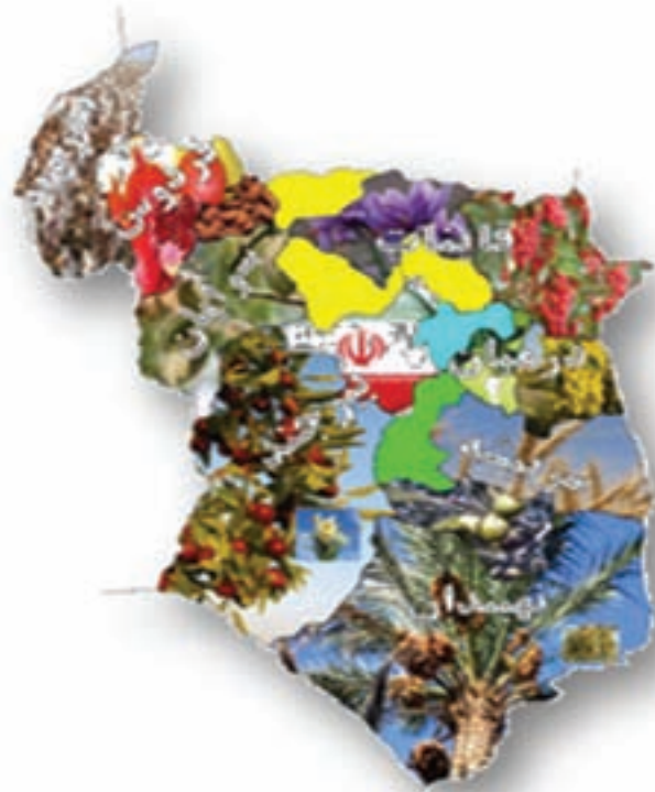
شکل ۲-۱۳- نقشه پراکندگی محصولات کشاورزی استان

استان ما دارای ۱۳۲۶۳۹ هکتار اراضی زیر کشت محصولات زراعی با تولید ۵۷۰۴۱۲ تن و ۴۶۸۸۸ هکتار سطح زیر کشت محصولات باغی با تولید ۶۱۸۹۳ تن است. همچنین از لحاظ دام، استان دارای ۳۴۱۹۳۷۷ واحد دامی می باشد که علاوه بر تولید نیاز استان، به سایر استان های همجوار نیز تولیدات آن ارسال می شود.