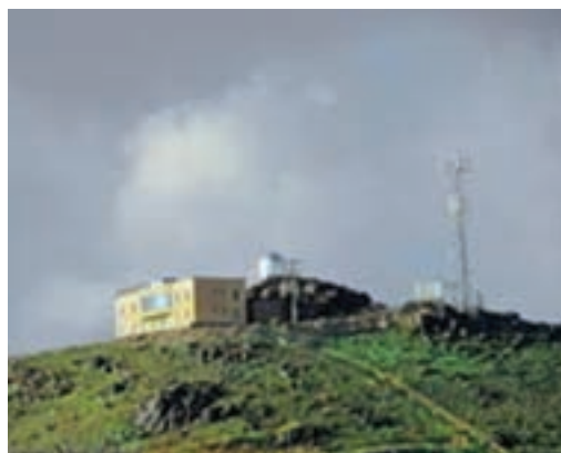
شکل ۱۹-۱۲- رصدخانه دکتر مجتهدی

● منطقه نمونه گردشگری تون و باغستان - آبگرم فردوس: شهر تاریخی و قدیمی تون در جنوب شهر فردوس با وسعتی حدود ۱۸ هکتار واقع شده است که مجموعه‌ای از جاذبه‌های تاریخی و فرهنگی را تشکیل می‌دهد؛ اما منطقه نمونه گردشگری باغستان آبگرم بیشتر از جاذبه‌های طبیعی برخوردار است.