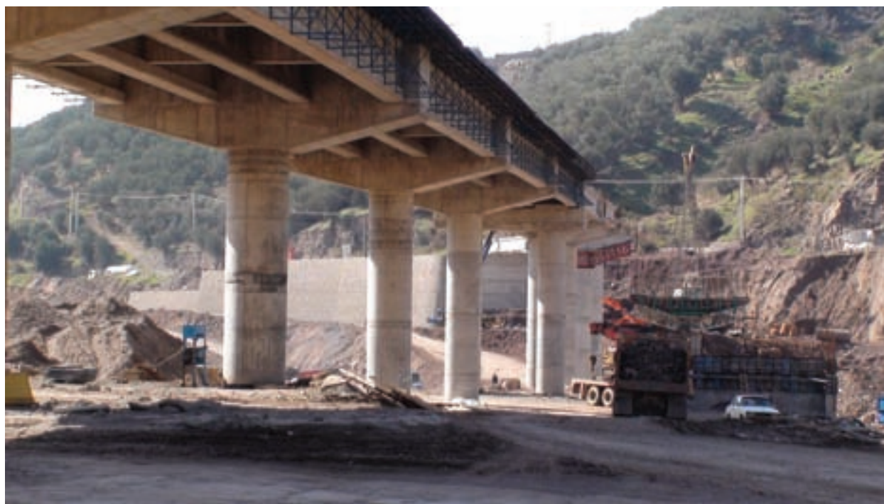
شکل ۱۵-۶- راه ارتباطی بزرگراه

با تشکر از سازمان‌ها و نهادهایی که در تألیف کتاب با گروه مؤلفان همکاری کرده‌اند؛ از جمله :