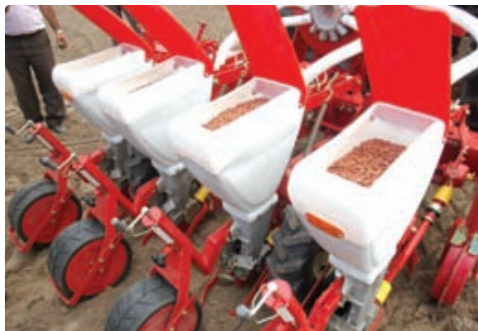
شکل ۹-۶- کاشت مکانیزه بادام زمینی (آستانه اشرفیه)