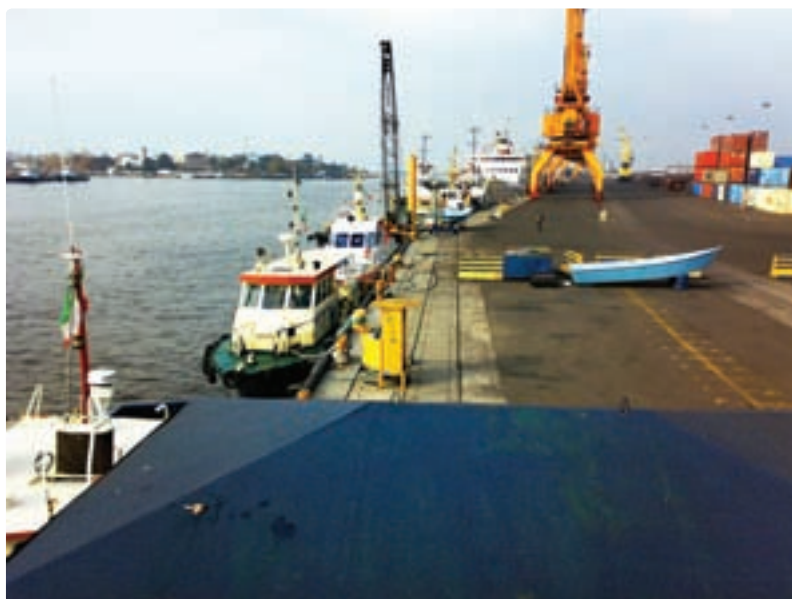
شکل ۷-۶- حمل و نقل دریایی

بعد از سال ۱۳۵۷، ظرفیت بارگیری و تخلیه بار بندر انزلی افزایش یافت و چهار پست اسکله و دو باب انبار سرپوشیده به این تأسیسات اضافه شد. طول موج‌شکن غربی افزایش یافت و بخشی از کانال به منظور دسترسی به محوطه مورد نیاز احیا شد.