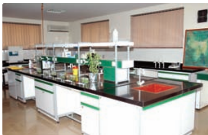
شکل ۱۲-۶- روش‌های جدید بیوتکنولوژی

افزایش بازدهی آبیاری و ازدیاد نرخ بهره‌وری از منابع آب : با استفاده بهینه از منابع آب و با بالا بردن بازدهی آبیاری می‌توان کشاورزی استان را توسعه داد. در این زمینه، لازم است بین ارگان‌های مختلف برای استفاده صحیح و معقول از آب هماهنگی‌هایی صورت گیرد. ایجاد تأسیسات کوچک مهار آب‌های سطحی و بهره‌برداری بیشتر از آب‌های زیرزمینی به همراه استفاده از روش‌های جدید آبیاری، می‌تواند در افزایش تولید باغ‌های چای، زیتون، توت و کشتزارهای برنج مؤثر باشد.