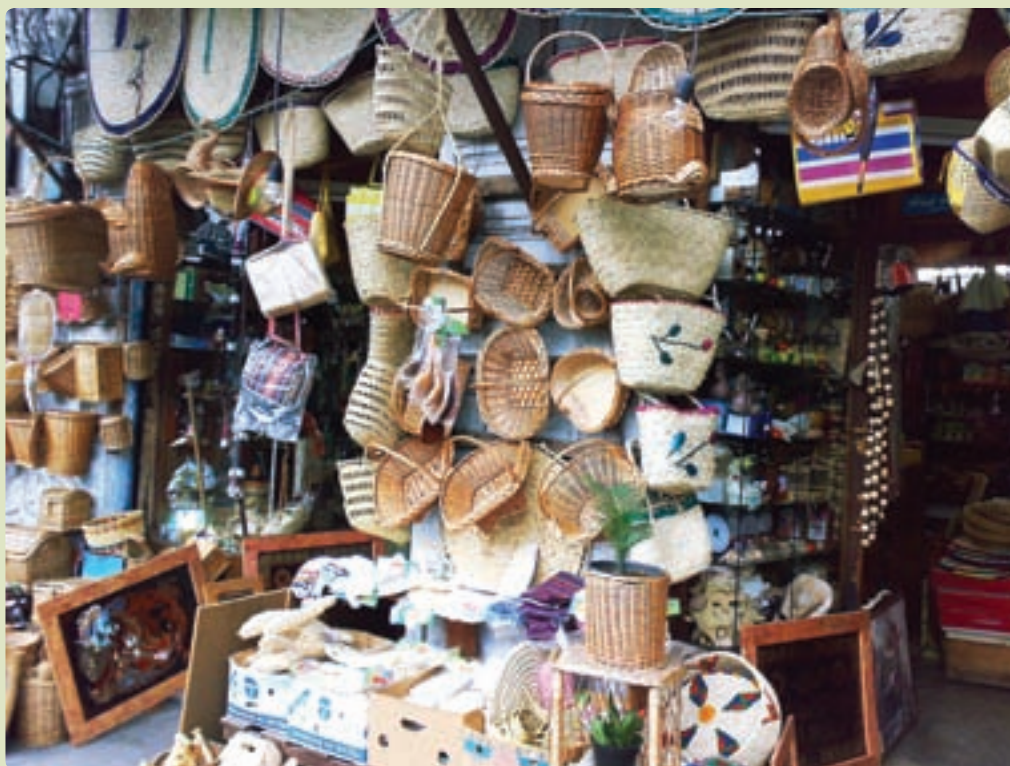
شکل ۵-۶- صنایع دستی