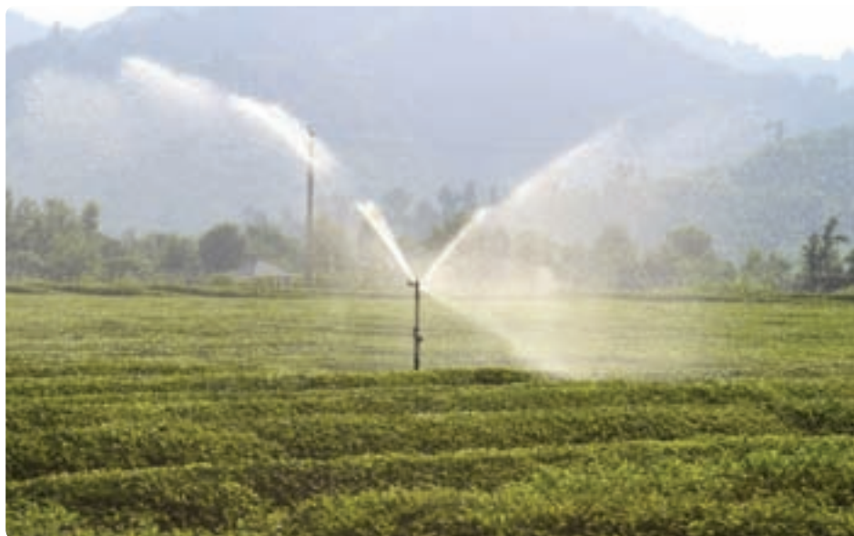
شکل ۱-۶- آبیاری مکانیزه

یکی از مهم‌ترین مواردی که برنامه‌ریزی در آن، افزایش تولید در بخش کشاورزی را به دنبال دارد، مسائل مربوط به بخش آب