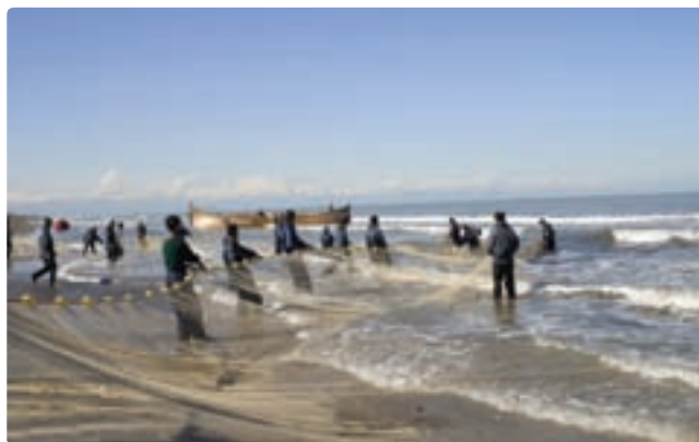
شکل ۳-۶- صید ماهی در دریای خزر