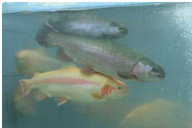
شکل ۲-۶- پرورش ماهی قزل آلا

همچنین، با توجه به فعالیت‌های زنبورداری در گیلان، مقدار سالانه تولید عسل ۳۲۰۰ تن است که ۱۰ درصد عسل کشور را تأمین می‌کند. این استان در بخش مربوط به فعالیت‌های صیادی و آبی‌پروری موقعیت منحصر به فردی دارد که با وجود رودها و آبگیرهای داخلی و دریا، مقدار تولید قابل افزایش است. در سال ۱۳۵۷ صید انواع ماهیان استخوانی و کیلکا در مجموع ۱۲۱۱ تن بوده است.