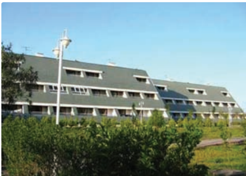
شکل ۶-۶- هتل سفید کنار

۳- وضعیت خدمات و بازرگانی: در طی سه دهه اخیر در استان، بخش خدمات خیلی پیشرفت کرده است. در تمامی سال‌های مورد بررسی، شمار شاغلان آن به طور مطلق و نسبی افزایش یافته است. آهنگ افزایش در سال‌های ۸۵-۱۳۷۵ به شدت رشد داشته و سهم شاغلان این بخش از ۳۹/۱ درصد به ۵۰/۱ درصد افزایش یافته است. در این دوره به طور متوسط، سالانه ۱۳۳۴ شغل در این بخش ایجاد شده است.