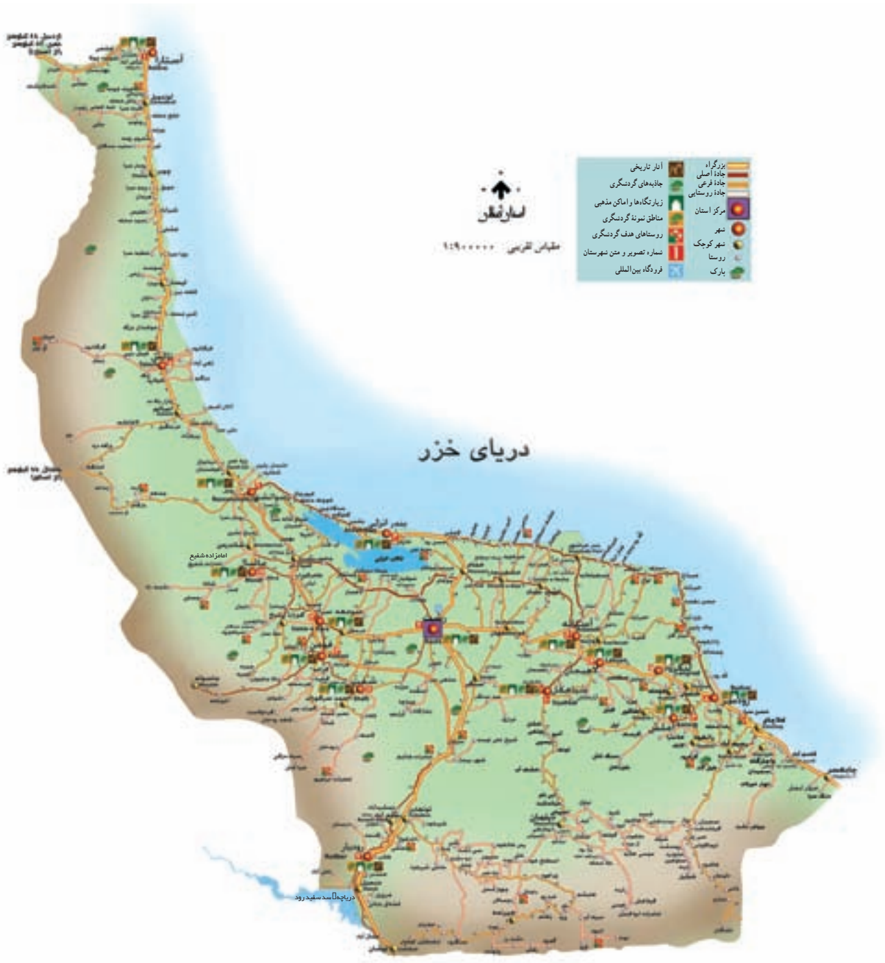
شکل ۱۷-۶ نقشه گردشگری استان