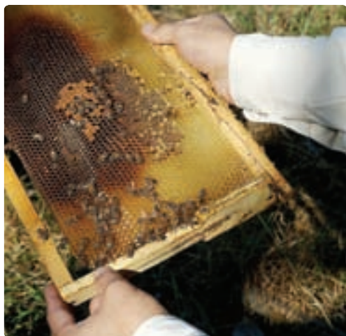
شکل ۱۰-۶- پرورش زنبور عسل

— یکپارچه‌سازی اراضی و مکانیزه کردن کشاورزی: سرانه زمین کشاورزی گیلان ۱/۱۳ هکتار است. وسعت کم زمین‌های کشاورزی و کوچک کردن هریک از قطعه‌ها باعث می‌شود تا سرمایه‌گذاری‌ها و مکانیزه کردن کشاورزی مقرون به صرفه نباشد و بازدهی تولید پایین بیاید.