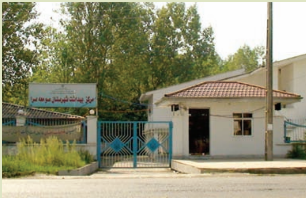
شکل ۸-۶- مرکز بهداشت

است. تخت‌های بیمارستانی از ۱۴۶۶ تخت در سال ۱۳۵۷ به ۳۷۱۶ تخت در سال ۱۳۸۵ افزایش یافته است.