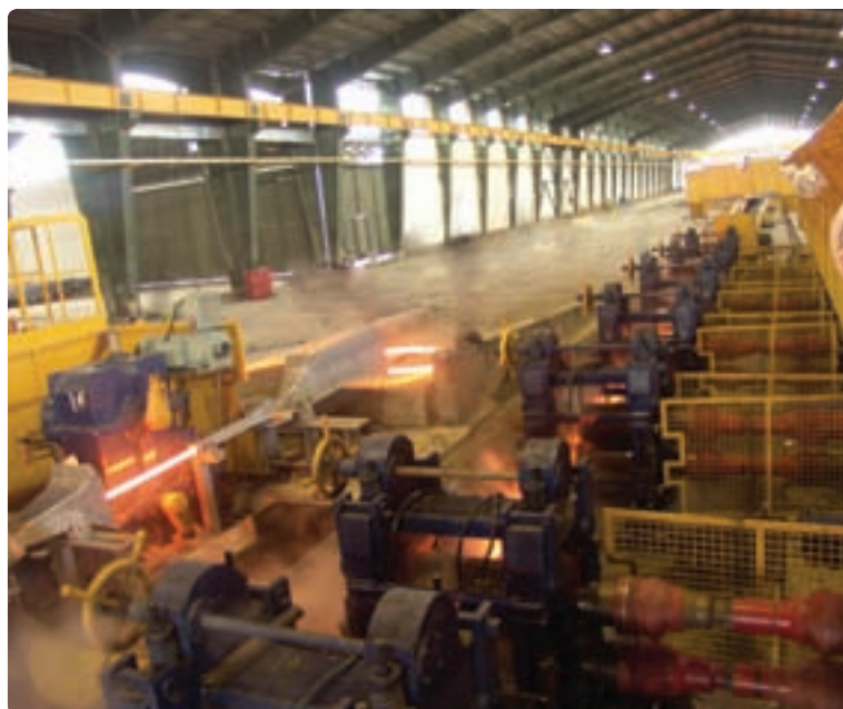
شکل ۱۴-۶- نمونه‌ای از صنایع استان

برای توسعه بازرگانی، رشد صنایع کارخانه‌ای، گردشگری و ... توسعه جاده تهران - قزوین - رشت به آستارا ضروری است. این محور ارتباطی در جابه‌جایی بار و مسافر و ارتباط با کشورهای خارجی و استان اردبیل نقش عمده‌ای دارد.