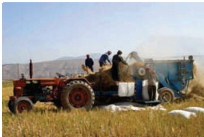
شکل ۱۱-۶- کشاورزی مکانیزه

— توسعه صنایع تبدیلی محصولات کشاورزی : تولید محصولات مختلف کشاورزی مثل زیتون، گیاهان دارویی، چوب، آبریان و ... در استان می‌تواند با توسعه صنایع تبدیلی به افزایش اشتغال، تأمین ارز، تأمین درآمد و سهم آن در افزایش تولید خالص ملی و برآورده کردن نیازهای مصرفی جمعیت کمک کند. — افزایش تولیدات گلخانه‌ای : کشت گلخانه‌ای در استان، زمینه را برای تولید بیش تر انواع مختلف محصولات کشاورزی فراهم می‌سازد و علاوه بر سوددهی بالا موجب می‌شود تا از این تولیدات در همه فصول سال استفاده کنیم.