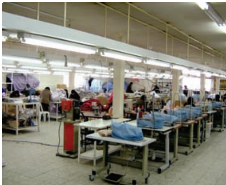
شکل ۱۳-۶- نمونه‌ای از صنایع استان