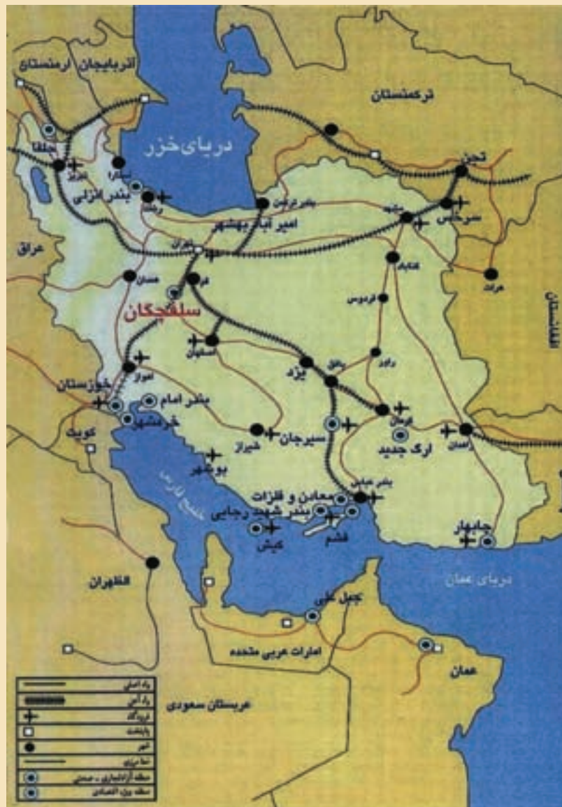
شکل ۳۲-۵- نقشه موقعیت جغرافیایی منطقه ویژه اقتصادی سلفچگان در ایران و منطقه

به شکل ۳۲-۵ توجه کنید. منطقه ویژه اقتصادی سلفچگان در محدوده‌ای به وسعت ۲۰۰۰ هکتار در ۳۰ کیلومتری شهر قم و در چهارراه جاده‌های ترانزیت، در مرکز ایران واقع شده است. این منطقه به‌عنوان مهم‌ترین و نزدیک‌ترین منطقه ویژه اقتصادی به مرکز سیاسی - اقتصادی کشور، واقع در مسیر راه‌آهن سراسری و بزرگراه‌های