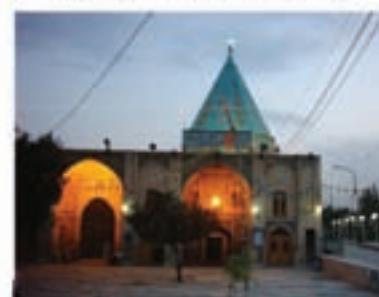
امامزاده علی ابن جعفر