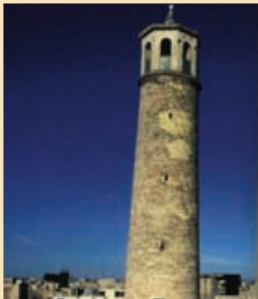
شکل ۲۰-۵- مناره میدان کهنه