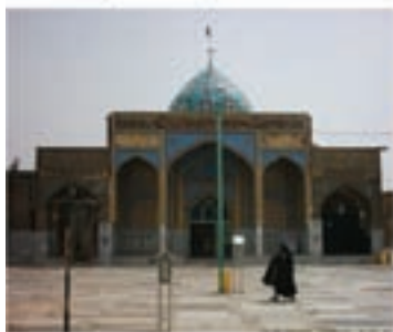
امامزاده سید علی