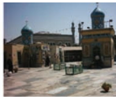
مقبره میرزای قمی و ذکریا ابن آدم