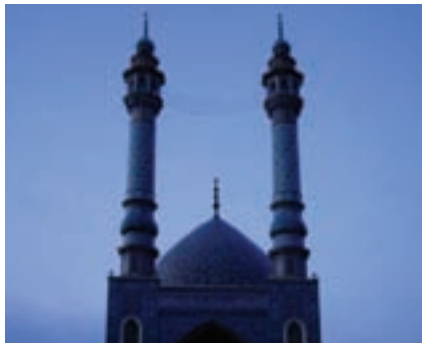
شکل ۶-۵- مسجد اعظم

در استان قم مساجد بزرگی وجود دارد که مهم‌ترین آنها عبارت است از: