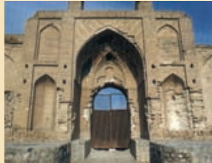
شکل ۱۴-۵- کاروان سرای محمدآباد کاج