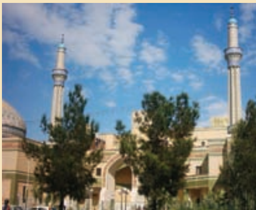
شکل ۱۰-۵- مدرسه علمیه امام خمینی (ره)

ت) مدرسه‌های علوم دینی : شهر قم از دیرباز محلّ تدریس علوم دینی و پایگاه فقاہت شیعه بوده است؛ از این رو مدارس فراوانی برای آموزش علوم دینی به طلاب در قم وجود دارد که مهم‌ترین آنها مدرسه فیضیه، دارالشفاء، سبطیه (بیت النور)، رضویه، حجتیه، جهانگیر خان و ... است که در این میان، مدرسه فیضیه از جهت تاریخی و انقلابی از اهمیت بیشتری برخوردار است.