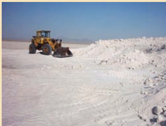
شکل ۳۱-۵- استخراج نمک از دریاچه حوض سلطان

معادن دریاچه نمک قم و حوض سلطان: دریاچه نمک قم به عنوان منبع عظیم و سرشار انواع املاح معدنی طی سالیان اخیر مورد توجه و مطالعه قرار گرفته است. نتایج طرح مطالعه، بیانگر وجود ۲۰ میلیون تن منیزیم در دریاچه است که کاربردی مؤثر در صنایع نسوز دارد. علاوه بر منیزیم از شورابه‌ها حدود ۱۲ کانی می‌توان به دست آورد، که کاربردهای متنوعی در صنایع گوناگون نظیر کودهای شیمیایی، کاغذ، عایق کاری لوله، ضد یخ و ... دارند. در دریاچه حوض سلطان نیز انواع نمک‌های خوراکی و صنعتی وجود دارد که هم‌اکنون استخراج می‌شود.