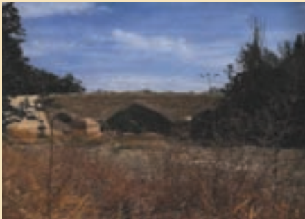
شکل ۱۷-۵- پل تاریخی طبنوج