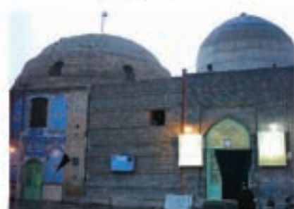
امامزاده موسی مبرقع و چهل اختران