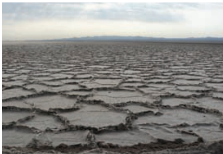
شکل ۲۳-۵- چشم اندازی از دریاچه حوض سلطان

۲- دریاچه حوض سلطان : شامل دو چاله جدا از هم به نام حوض سلطان و حوض مَره است. دریاچه حوض سلطان با طبیعت زیبای خود، مناظر بدیعی را برای بازدیدکنندگان خلق می کند. علفزارهای اطراف دریاچه حوض سلطان در گذشته شکارگاه مخصوص سلاطین و حاکمان بوده است.