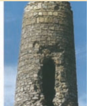
شکل ۱۸-۵- میل علی آباد از آناردوره سلجوقی

۴- موزه آستانه مقدسه: این موزه در سال ۱۳۱۴ افتتاح شد. بخش اعظم نفیس موزه شامل قرآن‌های نفیس خطی، کاشی‌های محراب و مرقد، تابلوهای نقاشی و مینیاتور، ظروف شیشه‌ای و سفالی، انواع هنر خاتم و سکه‌های ضرب شده دوران اسلامی است.