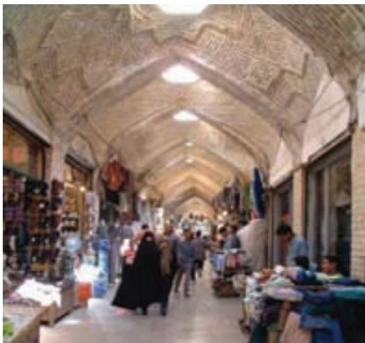
شکل ۴-۵- بازار قم