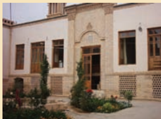
شکل ۱۲-۵- منزل حضرت امام خمینی (ره)

ج) قلعه‌ها: مانند قلعه قمرود، قلعه مظفر آباد و قلعه ملک آباد ج) کاروان سراها: مانند کاروانسرای حوض سلطان، دیر گچین، پل دلاک و پاسنگان ح) پل‌ها: مانند پل دلاک، حوض سلطان و طینوج خ) آب انبارها: مانند آب انبار چهل اختران، صدر آباد، لب چال، راهجرد و کوه سفید د) میل‌ها: مانند میل صفر علی و میل بابک ذ) آتشکده‌ها و تپه‌های تاریخی: مانند آتشکده نویس در منطقه خلجستان و تپه تاریخی صرم، قلی درویش و قره تپه قمرود که در درس دهم با آنها آشنا شدید. ر) آثار دیگر: مانند مناره‌های میدان کهنه که قبلاً سر در مدرسه علمیة غیاثیه بوده است و تک منار میدان کهنه که در خیابان آیت الله طالقانی (آذر) قرار دارد.