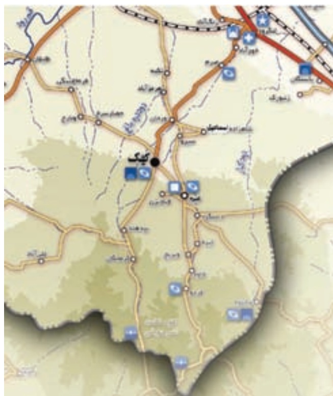
شکل ۲۴-۵- نقشه منطقه بیلاقی کهک

۳- منطقه بیلاقی کهک : شهر کهک با روستاهای اطراف آن، مانند فردو، وشنوه و کرمجگان و خاوه، یکی از مناطق زیبای بیلاقی استان قم محسوب می شود. وجود باغ های زیبا، آب و هوای معتدل و وجود چشم اندازهای بسیار زیبا سبب جذب گردشگران داخلی و خارجی به این منطقه زیبا می شود.