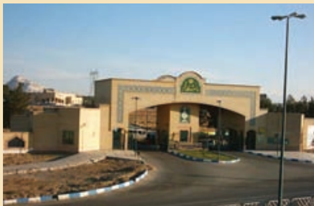
شکل ۳۵-۵- دانشگاه قم

پ) کتابخانه‌ها: در حال حاضر، در شهر قم کتابخانه‌های بزرگ و مهمی مانند کتابخانه آیت‌الله مرعشی نجفی، کتابخانه دفتر تبلیغات اسلامی حوزه علمیه قم، کتابخانه مدرسه فیضیه، کتابخانه مسجد اعظم، وجود دارد که در این میان، کتابخانه آیت‌الله مرعشی نجفی (ره) دارای اهمیت جهانی است.