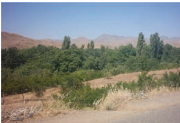
شکل ۲۷-۵- منطقه بیلاقی خلیجستان