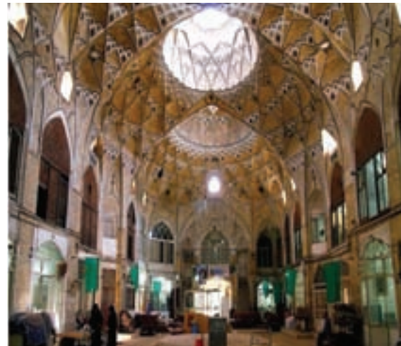
شکل ۳-۵- تیمچه بازار قم

۳- بناهای قدیمی و تاریخی: بناهای تاریخی زیادی در استان وجود دارد که در اینجا با بعضی از آنها آشنا می‌شوید: الف) مجموعه بازار قم: بازار قم با قدمت حدود ۴۰۰ سال در مرکز شهر واقع شده و شامل دو راسته بازار نو و کهنه با پوشش گنبدی و سرپوشیده است. یکی از بناهای باشکوه در بازار قم، تیمچه بازار است. این تیمچه در سمت شمال راسته بازار نو، قرار دارد. این بنا از نظر وسعت، هنر معماری و تزیینات از جمله بناهای منحصر به فرد به‌شمار می‌رود که در دوره قاجاریه ساخته شده است.