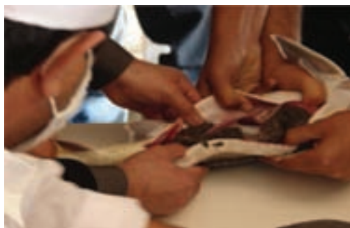
شکل ۲۹-۵- تولید ماهی خاویار در استان