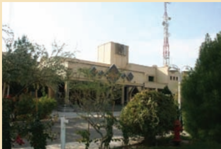
شکل ۳۷-۵- صدا و سیما مرکز قم

ث) صدا و سیما: شهر مقدس قم به سبب آنکه مرکز معنوی جهان تشیع و خاستگاه انقلاب اسلامی ایران محسوب می‌شود و نیز به برکت بارگاه ملکوتی کریمه اهل بیت (س) و مسجد مقدس جمکران از جایگاه ممتاز معنوی و فرهنگی برخوردار است. از این رو صدا و سیما مرکز قم باید در شأن این شهر مقدس باشد. نقش صدا و سیما مرکز قم به مراتب فراتر از یک شبکه استانی است. در مرکز قم علاوه بر برنامه‌سازی برای بیش از یک میلیون و چهل هزار نفر جمعیت استان قم از چشمه جوشان اهل بیت (ع) در این شهر به نفع شبکه‌های ملی و فراملی استفاده کرده و برنامه‌های مورد نیاز صدا و سیما را در حوزه معارف دینی تولید می‌کند. این ویژگی صدا و سیما مرکز قم، ویژگی منحصر به فردی است و هیچ‌یک از مراکز صدا و سیما این شرایط خاص را ندارد. رادیو سراسری معارف از این استان پخش می‌شود.