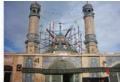
امامزاده معصومه کهنک