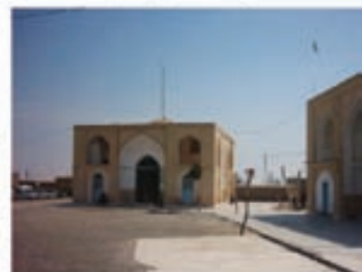
پنج امامزاده جمکران