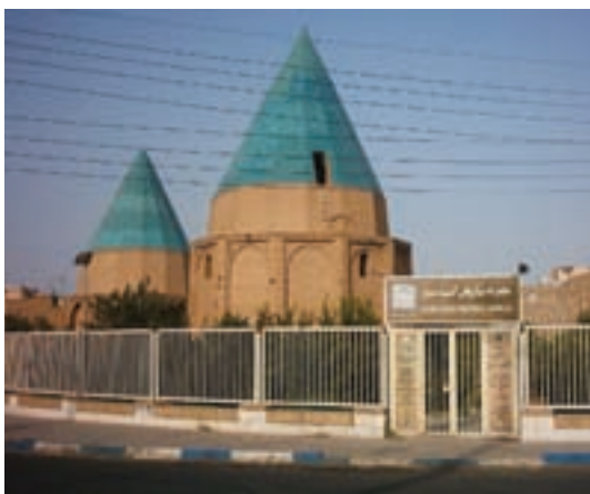
شکل ۵-۵- مقابر گنبد سبز