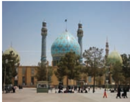
شکل ۹-۵- مسجد مقدس جمکران