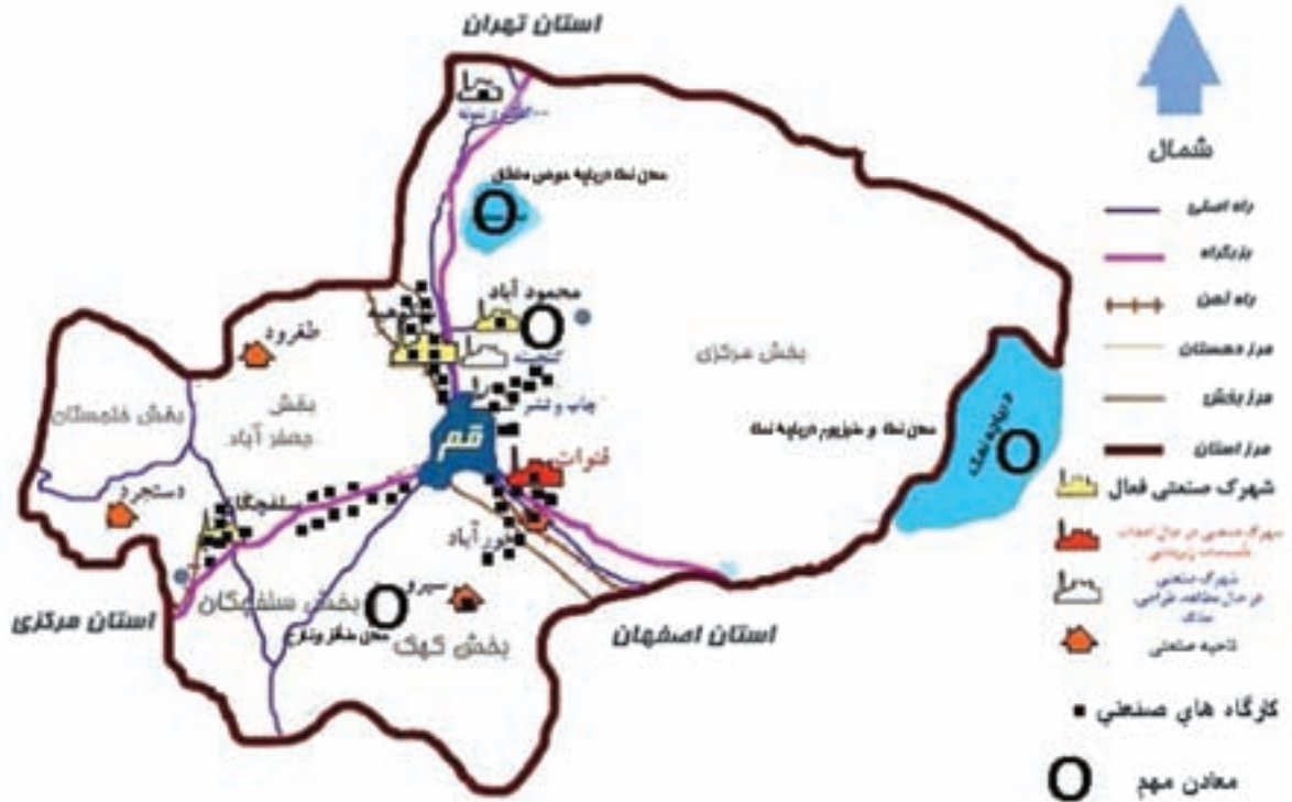
شکل ۳۰-۵- نقشه پراکندگی جغرافیایی صنایع و معادن استان