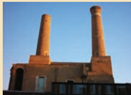
شکل ۱۶-۵- مناره‌های میدان کهنه