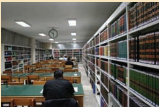
شکل ۳۶-۵- کتابخانه آیت‌الله مرعشی نجفی

کتابخانه آیت‌الله مرعشی نجفی: این کتابخانه، یکی از غنی‌ترین کتابخانه‌های جهان تشیع است که با همت آیت‌الله مرعشی نجفی (ره) تأسیس شد. این کتابخانه دارای گنجینه‌ای با ارزش از نسخه‌های خطی نفیس بالغ بر ۶۵۰۰۰ عنوان است که بسیاری از آنها در جهان هم‌تا ندارند و غالباً توسط دانشمندان مسلمان در سده‌های سوم و چهارم (بیش از هزار سال پیش) به زبان‌های مختلف نوشته شده‌اند و هم‌چنین، نزدیک به یک میلیون جلد کتاب‌های چاپی دارد. این کتابخانه نخستین کتابخانه کشور از نظر نسخه‌های خطی و سومین کتابخانه جهان اسلام به‌شمار می‌رود.