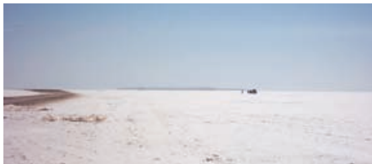
شکل ۲۲-۵- منظره‌ای از دریاچه نمک (در انتهای عکس کوه سرگردان مشاهده می‌شود).

۱- دریاچه نمک : این دریاچه بین سه استان قم، اصفهان و سمنان قرار گرفته است. در سطح این دریاچه، نمک‌های پف کرده شکل‌های هندسی زیبایی را به وجود آورده که به «پلی‌گون» معروف است و هنگام طلوع و غروب خورشید مناظر دیدنی و زیبایی را به وجود می‌آورد. هم‌چنین، هنگام وزش باد توده‌های بزرگ ماسه، مانند امواج دریا به حرکت در می‌آیند و تپه‌های موقتی تشکیل می‌دهند. ارتفاع برخی از این تپه‌ها به ۴۰ متر و طول برخی از آنها به چند کیلومتر می‌رسد. دریاچه نمک می‌تواند مقصد بسیاری از گردشگران طبیعت باشد.