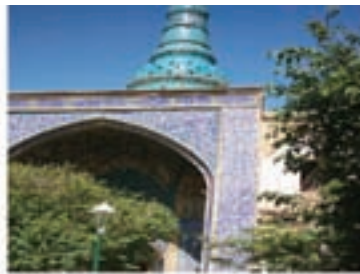
امامزاده شاه حمزه