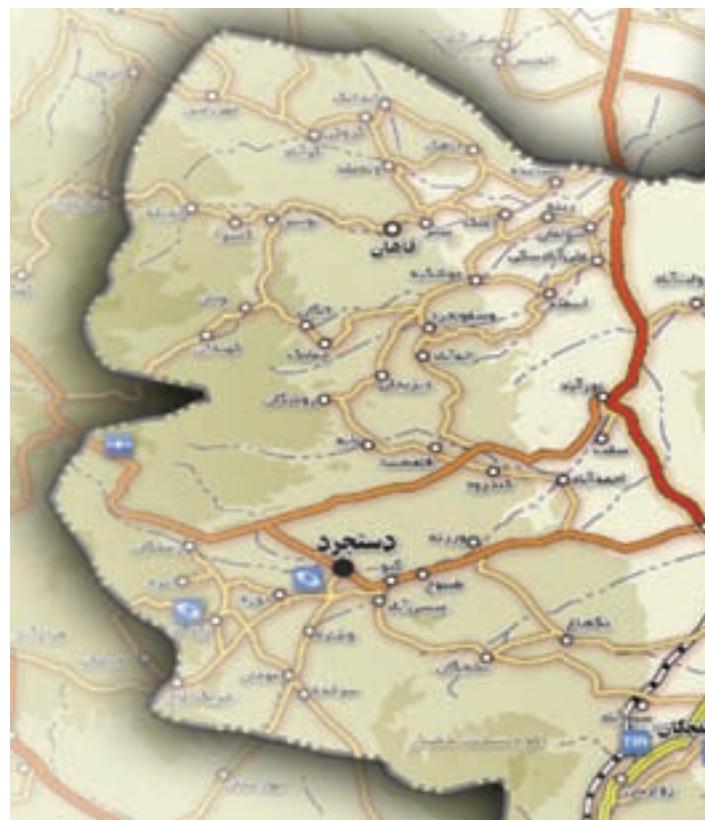
شکل ۲۶-۵ نقشه منطقه ییلاقی خلجستان

۴- منطقه ییلاقی خلجستان : این منطقه با داشتن آب و هوای معتدل و وجود روستاهای بسیار زیبا مانند قاهان و ونان یکی از مناطق زیبای ییلاقی استان قم است. وجود باغ‌های زیبا، کوه‌های مرتفع و قرار گرفتن در مسیر راه قم به ساوه و قم به تفرش سبب شده تا گردشگران بسیاری از این منطقه دیدن کنند.