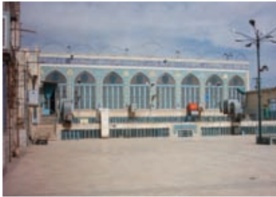
شکل ۸-۵- مسجد امام حسن عسکری (ع)