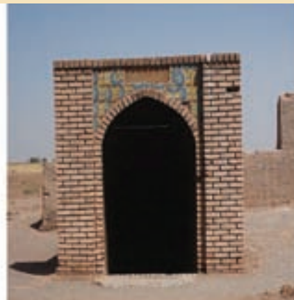
شکل ۱۹-۵- آب انبار در نزدیک امامزاده سکینه خاتون