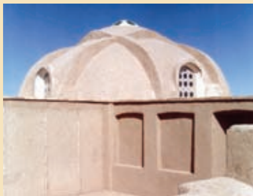
شکل ۱۳-۵- خانه ملاصدرا در کهنک (دوره صفویه)

ث) خانه‌های تاریخی: شامل خانه حضرت امام خمینی (ره)، آیت الله بروجردی، ملا صدرا، حاج علی خان زند، حاج قلی خان و ... است.