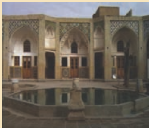
شکل ۱۱-۵- مدرسه علمیة جهانگیر خان

ث) خانه‌های تاریخی: شامل خانه حضرت امام خمینی (ره)، آیت الله بروجردی، ملا صدرا، حاج علی خان زند، حاج قلی خان و ... است.