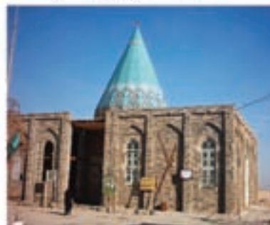
امامزاده طیب و طاهر