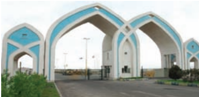
شکل ۳۳-۵- منطقه ویژه اقتصادی سلفچگان قم