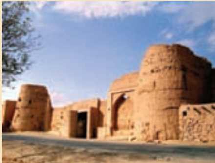
شکل ۱۵-۵- قلعه قمرود