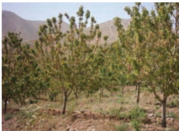
شکل ۲۸-۵- باغ های میوه (گیلاس) در جنوب استان