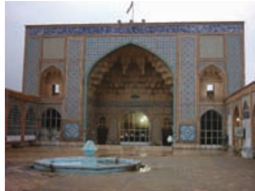
شکل ۷-۵- مسجد جامع شهر قم