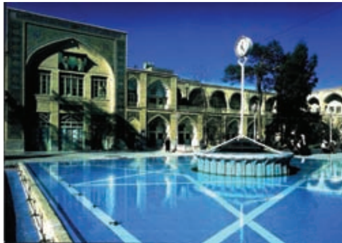
شکل ۳۴-۵- مدرسه فیضیه قم

— مدرسه فیضیه : مدرسه فیضیه یکی از پرآوازه‌ترین حوزه‌های علوم دینی در جهان اسلام است. این مدرسه از نیمه اول قرن سیزدهم هجری جایگزین بنای «مدرسه آستانه» شده و به اعتبار متون معتبر تاریخی از اواسط قرن ششم هجری قمری وجود داشته است. این مدرسه دارای چهار ایوان بوده و در دو طبقه با ۴۰ حجره تحتانی متعلق به عصر قاجار و ۴۰ حجره فوقانی متعلق به قرن چهاردهم هجری قمری است که با هدایت حضرت آیت الله حائری یزدی (ره) بر فراز حجره‌های پیشین در گرداگرد حیاط مرکزی بنا شد. قدیمی‌ترین بخش مدرسه، ایوان جنوبی آن است که مزین به کاشی‌کاری‌های زیبای معرق است. این ایوان طرف قبله و متصل به حرم مطهر است و سر در صحن عتیق حضرت فاطمه معصومه (س) از طرف فیضیه محسوب می‌شود. مدرسه فیضیه در شکل‌گیری و پیروزی انقلاب اسلامی نقش مهمی داشته است.