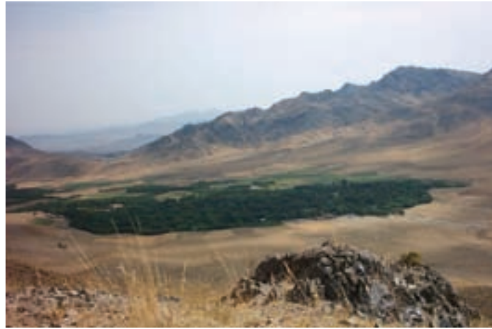
شکل ۲۵-۵ منطقه زیبای درباغ در بخش کهک

۴- منطقه ییلاقی خلجستان : این منطقه با داشتن آب و هوای معتدل و وجود روستاهای بسیار زیبا مانند قاهان و ونان یکی از مناطق زیبای ییلاقی استان قم است. وجود باغ‌های زیبا، کوه‌های مرتفع و قرار گرفتن در مسیر راه قم به ساوه و قم به تفرش سبب شده تا گردشگران بسیاری از این منطقه دیدن کنند.