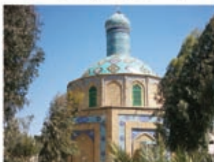
امامزاده احمد بن قاسم