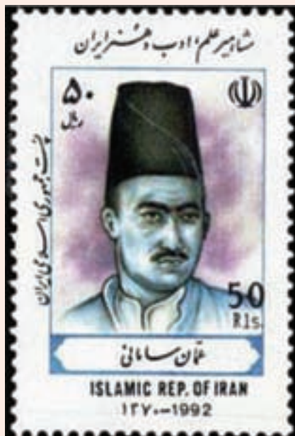
تصویر ۲۴-۱۰- تمبر یادبود میرزا نورالله عثمان سامانی

عثمان، شاعر شیعی سرود و عارف شهیر ایران در عصر قاجار، در سال ۱۲۵۸ ه.ق. در خانواده ای اهل