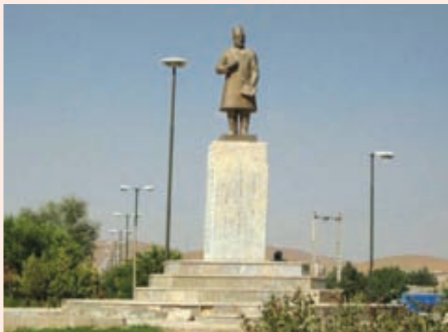
تصویر ۲۷-۱- تندیس یادبود میرزا حبیب دستان بنی در شهر بن

و معاشرت با اهل علم و ادب مشغول شد و آثار و اشعار گرانبهایی از خود به یادگار گذاشت. حسین پیرمان سرانجام در سال ۱۳۵۳ ه.ش. چشم از جهان فرو بست. از آثار او به دیوان اشعار، کویر اندیشه و خاشاک می توان اشاره کرد.