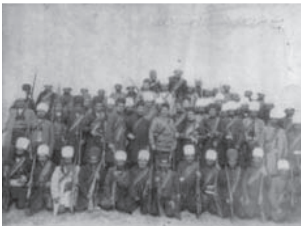
تصویر ۱۹-۱۰- فتح تهران در جریان مشروطه خواهی توسط مجاهدان