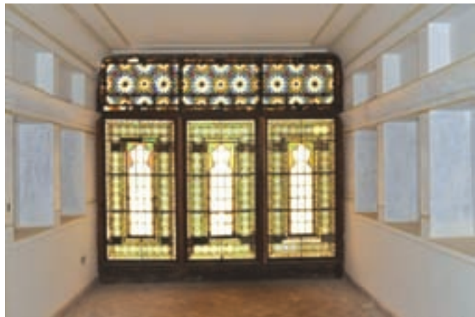
تصویر ۱۳-۱۰ - خانه آزاده چالشر