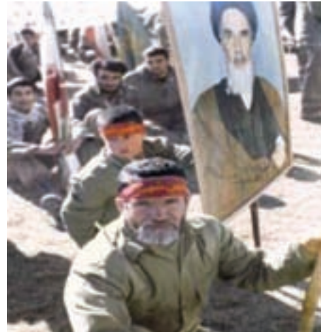
تصویر ۸-۱۱- اعزام رزمندگان اسلام به جبهه (در این نبرد، پیر و جوان، از ایران اسلامی دفاع می کردند)

«خدایا تو میدانی که من در این لحظه، خالصانه و مخلصانه قدم در این راه نهادم و از همه چیز زندگی گذشتم و همه مادیات و معنویات را نادیده گرفتم.»