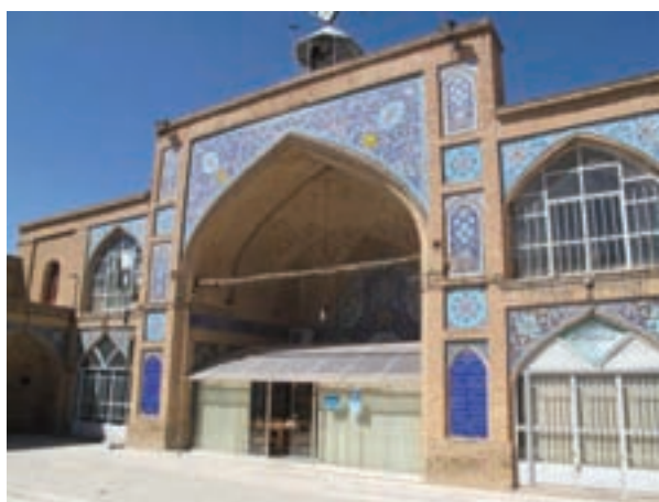
تصویر ۱۵-۱۰ - مسجد جامع شهرکرد

یکی از وقایع مهم تاریخ استان در دوره قاجاریه، نقش مهم مردم استان در جریان اعاده مشروطیت (مشروطه دوم) و مقابله با استبداد محمدعلی شاهی بود. به دنبال تقاضاهای اعضای کمیته مشروطه خواهان اصفهان و علمای با نفوذی چون «حاج آقا نورالله اصفهانی» مجاهدین مشروطه خواه چهار محال و بختیاری به فرماندهی خوانین با نفوذ بختیاری به ویژه «حاج ابراهیم خان