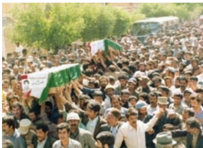
تصویر ۱۱-۷- تشییع پیکر شهدا در زمان جنگ تحمیلی

همچنین روستاهای شیخ شبان، هرچگان و شهر وردنجان به دلیل تعداد زیاد شهدا نسبت به جمعیت به عنوان روستاهای نمونه کشور محسوب شده‌اند. به‌عنوان مثال، روستای شیخ شبان (از توابع شهرستان شهرکرد) با داشتن حدود ۲۵۰۰ نفر جمعیت در زمان جنگ، حدود ۱۰۰۰ نفر رزمنده داشته است که از این تعداد حدود ۸۰ نفر به فیض شهادت نایل آمده‌اند.