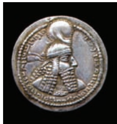
تصویر ۶-۱۰- سکه دوره ساسانی