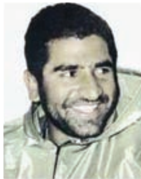
سردار شهید ایرج آقا بزرگی نافچی