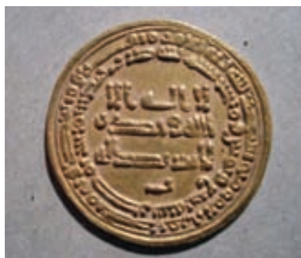
تصویر ۹-۱۰- سکه دوره اسلامی - مسجد جامع چاشتر