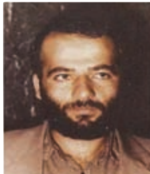
شهید مجتبی استکی