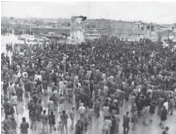
تصویر ۲۱-۱۰- سقوط نماد نظام شاهنشاهی در شهرکرد - دی ماه ۱۳۵۷

در زمان حکومت پهلوی دوم، اگر چه دولت سیاست مدارا با عشایر را در پیش گرفت، ولی با لغو عنوان «خان» در نظام سیاسی عشایر، عملاً رأس سلسله مراتب ایلی، قطع و کلاتران و کدخدایان به عنوان عوامل اجرایی دولت برای آرام نگه داشتن منطقه در مقابل افراد ایل قرار گرفتند. در این زمان اعمال فشار و نیز نفوذ و کنترل حکومت مرکزی ادامه یافت و با وجود رشد بسیار محدود در شیوه‌های تولید اقتصادی و نیز ویژگی‌های زندگی اجتماعی، دگرگونی اساسی در میان بختیاری‌ها صورت نپذیرفت و سیر زندگی کوچ روی به همان شیوه سنتی انجام می‌گرفت.