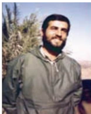
سردار شهید حاج غلامرضا کاووسی