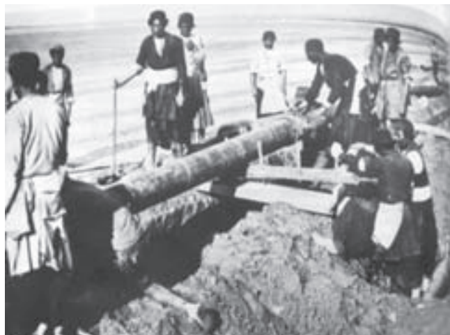
تصویر ۲۰-۱- بختیاری‌ها و نفت