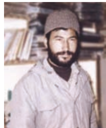
تصویر ۱۱-۱۱- سردار شهید حسینعلی ترکی