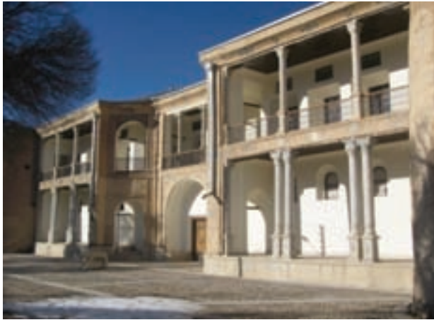
تصویر ۱۷-۱۰- قلعه امیر مفخم در دزک