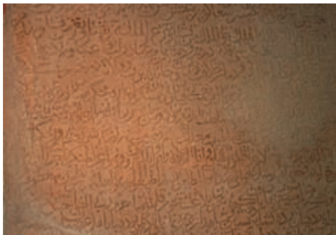
تصویر ۱۱-۱۰- سنگ نوشته برجای مانده از دوره صفویه در فرخ شهر

به زاینده‌رود توسط این پادشاه، بر اهمیت این منطقه بیش از پیش افزوده شده. و در منابع آن دوره از مناطق مختلف چهار محال و بختیاری نام برده شده است. به نوشته منابع دوره صفوی «خلیل خان» پسر جهانگیرخان پس از وی به حکومت بختیاری رسیده است.