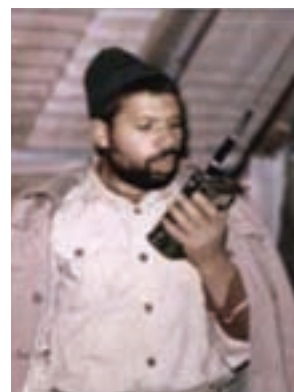
سردار شهید مرتضی اسماعیل زاده