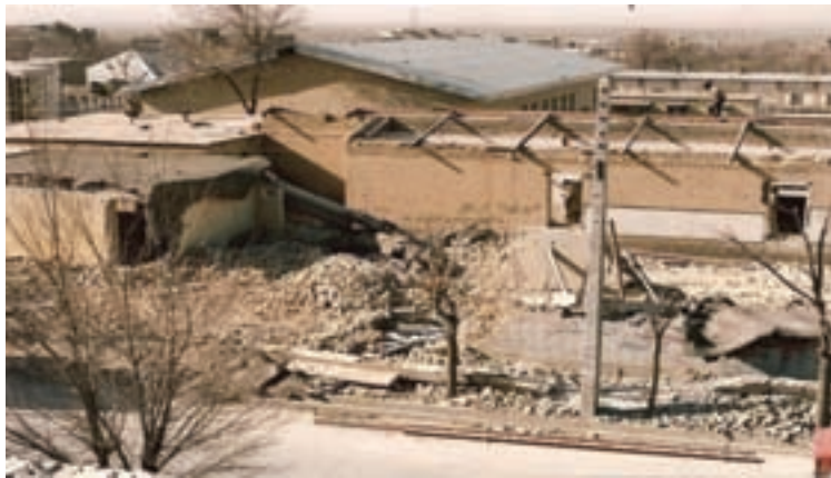
تصویر ۱۰-۱۱- بمباران شهرکرد توسط جنگنده های دشمن یعنی در تاریخ ۱۳۶۶/۱۲/۲۰

از آنجایی که مردم استان با تمام توان از رزمندگان اسلام حمایت می نمودند، دشمن یعنی برای شکستن مقاومت آنها، حملات وحشیانه ای به شهرکرد انجام داد که در اثر این حملات تعداد ۸۴ نفر از هم استانی های ما به درجه رفیع شهادت نایل آمدند.