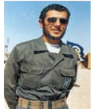
سردار شهید سید کمال فاضل