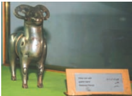
تصویر ۸-۱۰- مجسمه بازمانده از دوره ساسانی

نفوذ سیاسی - اجتماعی، تمدنی و فرهنگی ساسانیان در استان به قدری زیاد بوده که علاوه بر بقایای جاده‌ها و پل‌ها، تعداد زیادی اشیاء تاریخی از جمله سکه و مهر از این دوره بر جای مانده است. بردگوری‌ها نیز از دیرین آثار سنگی استان در دوران قبل از اسلام می‌باشند که در شهرستان‌های اردل، کوه‌رنگ، کیار، فارسان و لردگان پراکنده‌اند.