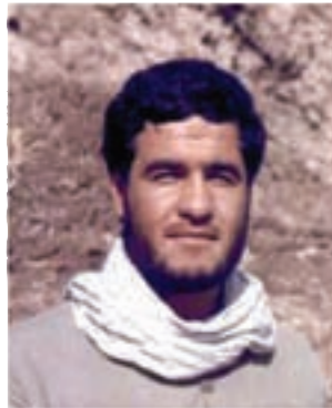
سردار شهید جمشید براتیپور