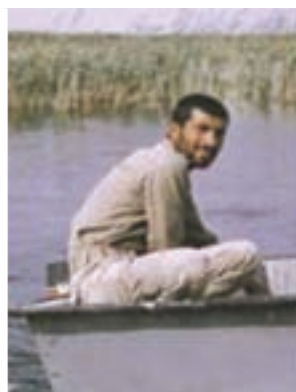
سردار شهید اردشیر غریب