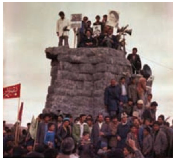
تصویر ۲۲-۱۰- سقوط نماد نظام شاهنشاهی در بروجن

در هر حال حکومت پهلوی اگر چه با اجرای الگوی توسعه غربی در حوزه اقتصادی و ایجاد طبقه متوسط جدید در حوزه اجتماعی و تضعیف و تخریب فرهنگ دینی و حاکم نمودن فرهنگ غربی در ایران، اهداف خاصی را دنبال می‌کرد؛ ولی در استان چهار محال و بختیاری به دلیل ریشه‌های قومی و مذهبی و اثرپذیری مردم از روحانیت و شعائر مذهبی، این سیاست نتوانست در بین مردم استان طرفداری بیابد؛ و آنان در جریان نهضت مردم ایران به رهبری امام خمینی (ره)، و شکل‌گیری انقلاب اسلامی، نقش مهمی ایفا کردند.