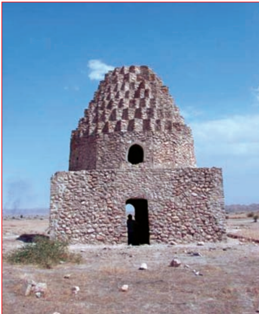
شکل ۱۰- ۵- جاذبه تاریخی استان