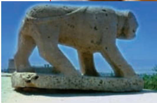
شکل ۷-۵ - شیر سنگی