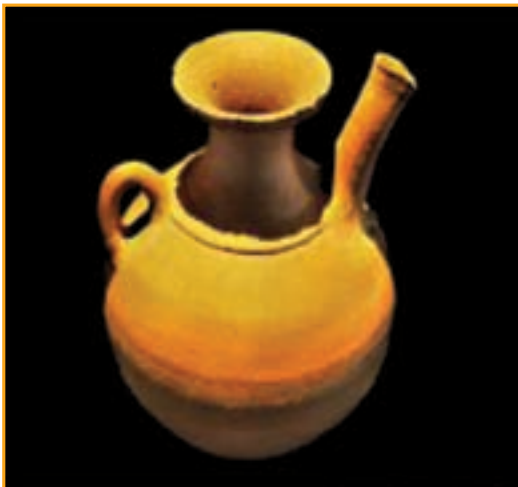
شکل ۵- ۵ - گنجینه یاسوج، ظرف سفالی - پیش از میلاد

تنها موزه استان، موزه (گنجینه) میراث فرهنگی در شهر یاسوج است. این موزه از یک بخش باستان شناسی تشکیل شده که در آن حدود ۲۷۰ شیء تاریخی فرهنگی از دوره های مختلف به نمایش گذاشته شده است. این اشیاء عمدتاً در کاوش های باستان شناسی به دست آمده اند.