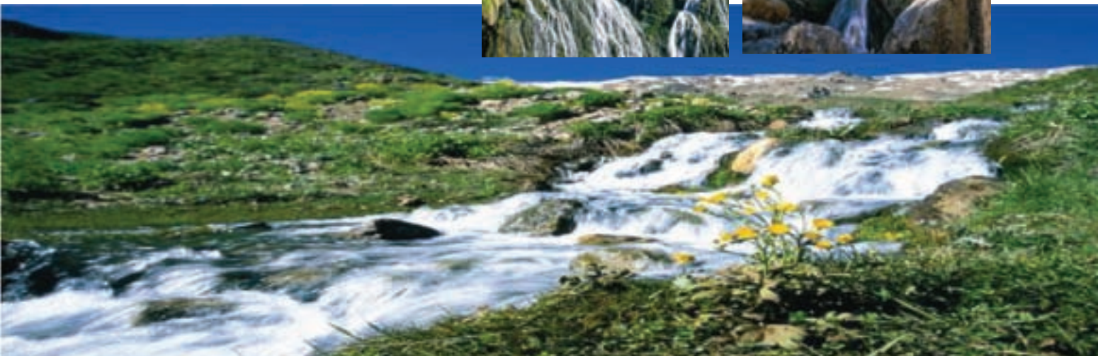
شکل ۹-۵- چشم اندازی از آبشارهای استان