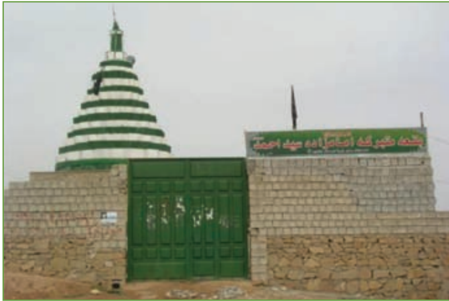
شکل ۴- ۵

۵- روستای توریستی کریک در ۱۵ کیلومتری جنوب غربی شهر سی سخت دارای طبیعت دل انگیزی است و معماری منازل مسکونی آن به صورت پلکانی می باشد. این روستا دارای سه امامزاده میر اسحاق محمد، معروف به شاه عسکر و امامزاده علی و امامزاده شاه نعمت الله می باشد. این روستا به علت قابلیت های تاریخی فرهنگی و چشم انداز طبیعی، مذهبی از روستاهای مهم گردشگری در سطح استان و کشور است. بارگاه امامزاده های مهم بی بی زهرا خاتون در دامنه های زیبای قتل دنا، امامزاده سید محمد در سی سخت و امامزاده محمود طیار سادات محمودی در شهرستان دنا قرار دارند.