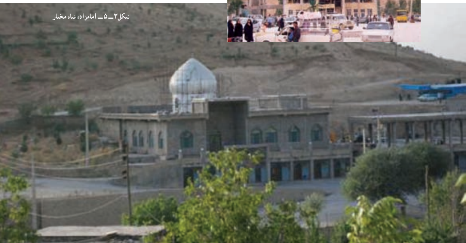
شکل ۳-۵- امامزاده شاه مختار