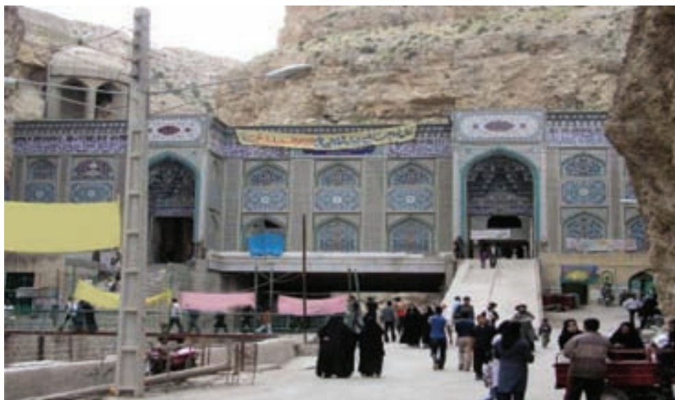
شکل ۱-۵- امامزاده بی بی حکیمه خاتون (س)