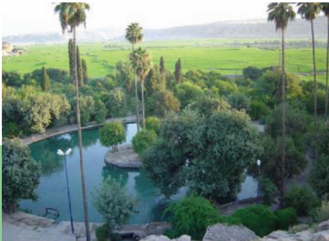
شکل ۱۴-۵ - چشمه بلقیس جرام