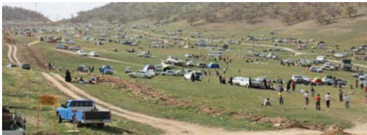
شکل ۱۱-۵ - سرنجل کل یاسوج