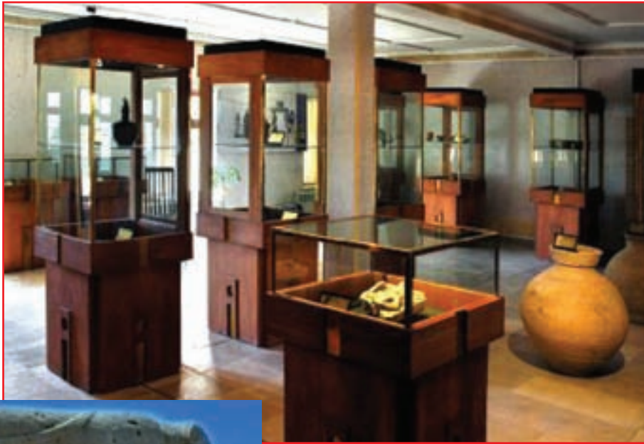
شکل ۶-۵ - گنجینه یاسوج