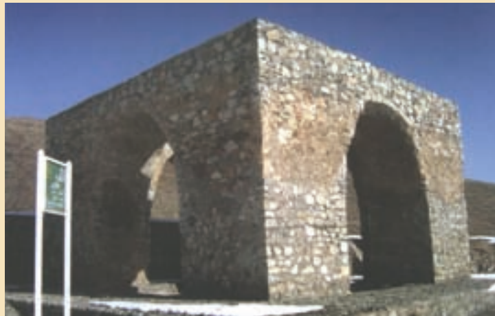
شکل ۷-۴- چهار طاقی (آتشکده) نویس در غرب استان

۲- چهار طاقی یا آتشکده : چهار طاقی یا آتشکده از آثار به جای مانده دوران پیش از اسلام در سرزمین قم است که معروفترین آنها چهار طاقی نویس (شکل ۷-۴) واقع در بخش خلجستان (روستای نویس) و چهار طاقی کزیمجان واقع در جنوب استان قم (در روستای کرمجان) است که هر دو مربوط به عصر ساسانی است.