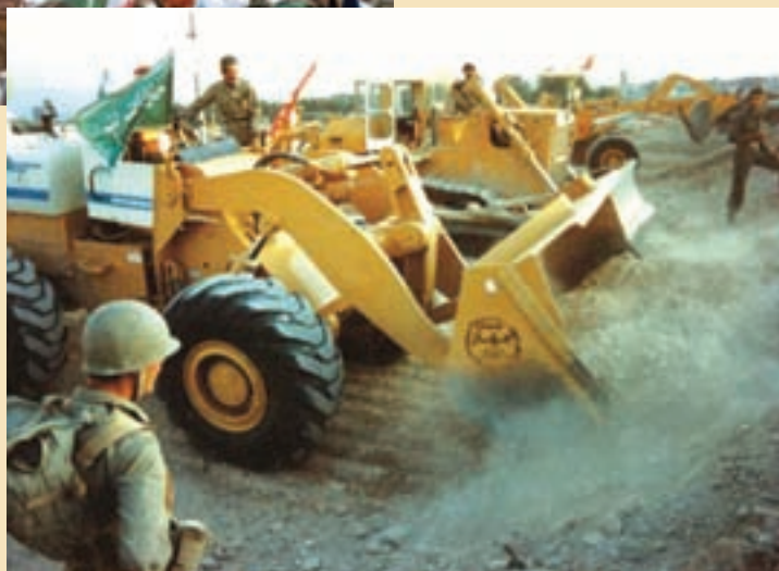
شکل ۱۵-۴ نقش جهادسازندگی در هشت سال دفاع مقدس