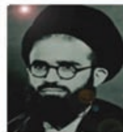
آیت الله سعیدی