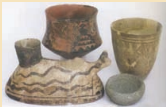
شکل ۴-۶- آثار کشف شده در قره تپه قمروند

ظروف از سفال‌های آجری و نخودی رنگ استفاده می‌کردند اما با ورود آریایی‌ها، سفالینه‌های خاکستری جایگزین آنها شد.