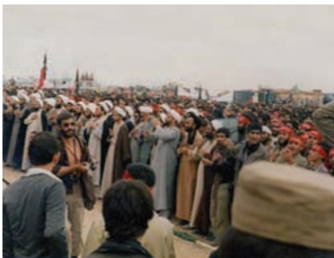
شکل ۱۴-۴- اعزام طلاب به جبهه