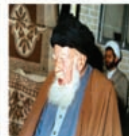
آیت الله بهاء‌الدینی