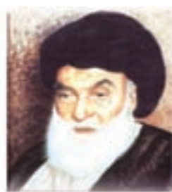
آیت الله بروجردی