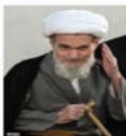
آیت الله مشکینی