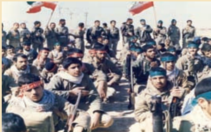
شکل ۱۶-۴ نقش دانش آموزان قمی در دفاع مقدس