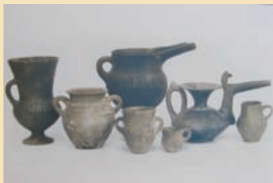
شکل ۴-۵- آثار کشف شده در تپه تاریخی صرم