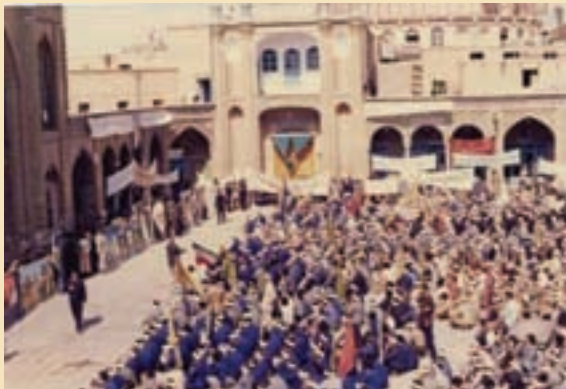
شکل ۱۱-۴- عزیمت رزمندگان روحانی به جبهه‌ها