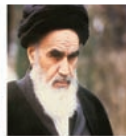
امام خمینی (ره)