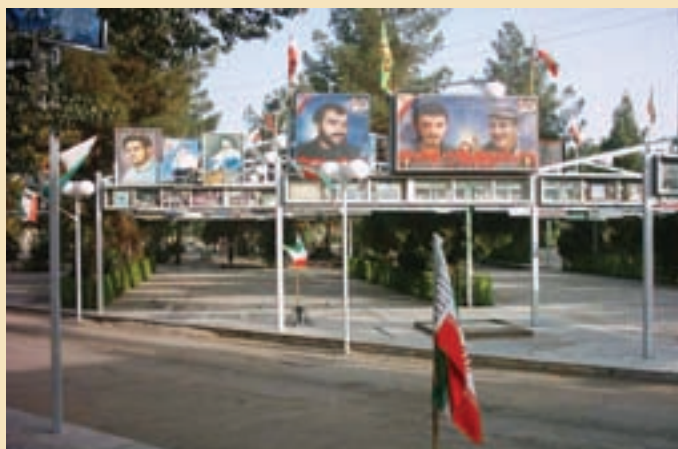
شکل ۱۸-۴- گلزار شهدای امام زاده علی بن جعفر علیه السلام قم

شهدای گمنام : یکی از مکان‌هایی که مورد بازدید و زیارت مردم قم و زائران حرم مطهر حضرت معصومه (س) قرار می‌گیرد مرقد پاک و مطهر ۱۴ شهید گمنام در محل کوه خضر نبی (ع) است. این شهدا که در پایین کوه خضر به خاک سپرده شده‌اند یکی از میعادگاهها و زیارتگاههای مردم به‌شمار می‌رود که در هفته به‌خصوص شب‌های جمعه پذیرای تعداد زیادی از زائران و هم‌زمان شهدا و مردم استان و دیگر مناطق کشور است.