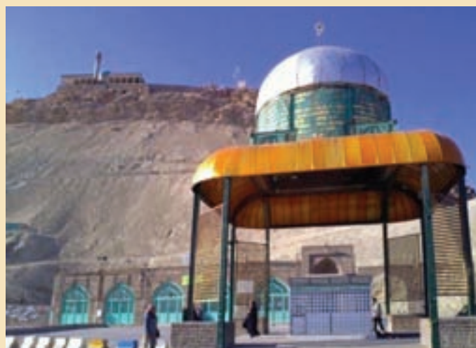
شکل ۱۹-۴- مرقد مطهر شهدای گمنام استان در دامنه کوه خضر نبی (ع)

شهدای گمنام : یکی از مکان‌هایی که مورد بازدید و زیارت مردم قم و زائران حرم مطهر حضرت معصومه (س) قرار می‌گیرد مرقد پاک و مطهر ۱۴ شهید گمنام در محل کوه خضر نبی (ع) است. این شهدا که در پایین کوه خضر به خاک سپرده شده‌اند یکی از میعادگاهها و زیارتگاههای مردم به‌شمار می‌رود که در هفته به‌خصوص شب‌های جمعه پذیرای تعداد زیادی از زائران و هم‌زمان شهدا و مردم استان و دیگر مناطق کشور است.