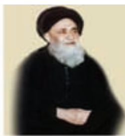
آیت الله مرعشی نجفی