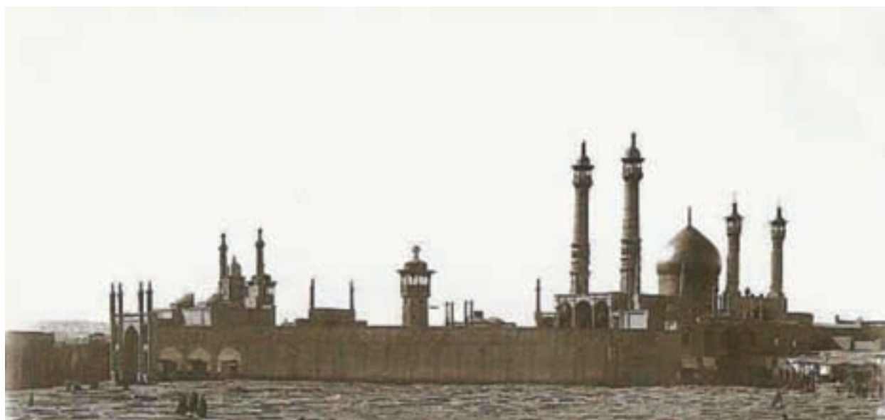
شکل ۲-۴- تصویر تاریخی از حرم مطهر حضرت معصومه (س)

در دوران سلطنت پهلوی دوم، قم به سنگر مبارزه فکری و مذهبی علیه سیاست‌های ضد مذهبی حکومت تبدیل شد. اولین جرقه انقلاب اسلامی در بهمن سال ۱۳۴۱ در شهر مقدس قم زده شد. مخالفت‌های علما و در رأس آنها حضرت امام خمینی (ره) با لایحه انجمن‌های ایالتی و ولایتی، رفراندوم اصول ششگانه انقلاب شاه و لایحه کاپیتولاسیون، شهر قم را به پایگاه مبارزه علیه رژیم محمد رضا پهلوی تبدیل کرد.