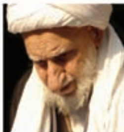
آیت الله بهجت