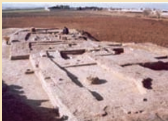
شکل ۴-۴- تپه تاریخی قلی درویش