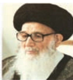
آیت الله گلپایگانی

در دوره معاصر، بزرگان زیادی در این سرزمین مقدس زندگی کرده‌اند که به چند نفر از آنها اشاره می‌شود: حضرت امام خمینی (ره) بنیان‌گذار جمهوری اسلامی ایران، آیت الله حاج شیخ عبدالکریم حائری مؤسس حوزه علمیه قم، علامه محمد حسین طباطبایی صاحب تفسیر ارزشمند المیزان، آیت الله مرعشی نجفی، آیت الله بروجردی، آیت الله گلپایگانی، آیت الله خوانساری، آیت الله بهاء‌الدینی، آیت الله اراکی، آیت الله صدر، آیت الله بهجت، آیت الله مشکینی و استاد علی اصغر فقیهی معلم و پژوهشگر برجسته. گفتنی است شهید مفتح، شهید مرتضی مطهری، شهید بهشتی، شهید آیت الله سعیدی و شهید حسین غفاری در راه پیروزی انقلاب اسلامی، به شهادت رسیدند.