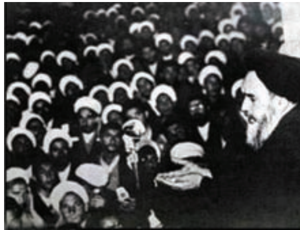
شکل ۳-۴- سخنرانی پرشور امام خمینی (ره) در ۱۲ خرداد سال ۱۳۴۲

پس از پیروزی شکوهمند انقلاب اسلامی ایران، شهر قم به پایتخت مذهبی کشور تبدیل شده است و علما و مردم آگاه قم در تحولات سیاسی کشور نقش مهمی ایفا می کنند و همواره پشتیبان برنامه ها و اهداف انقلاب اسلامی هستند.