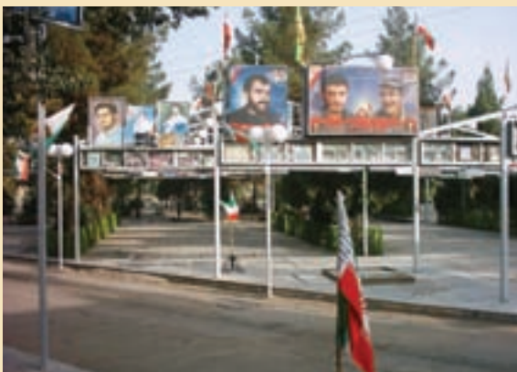
شکل ۱۲-۴- گلزار شهدای قم

در طول جنگ حدود ۵۰/۰۰۰ نفر از استان قم به جبهه‌های نبرد اعزام شدند. از این تعداد، حدود ۶۰۰۰ نفر از رزمندگان قمی به شهادت رسیدند، ۱۲۷۰۰ نفر به افتخار جانبازی نائل آمدند و ۵۴۰ نفر نیز از آزادگان سرافرازند.